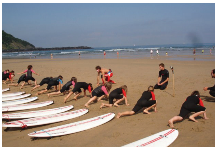
Abenturaz eta kirolaz gozatzeko aukera dute 8 eta 12 urte bitarteko haurrek, besteak beste, surfean aritzeko. Jolasteko aukera ugari dute.

Gainera kalitatezko txokoak dira, ekintza bereziak eta indartsuak dituztenak, eta aurreko urteetan neska mutil zaharrenek kasuan behintzat batzuek etorri dira Lasarte-Oriako lagunek erakarrita, hau da, kanpoko hiruzpalau lagunekin etorri dira herrikoak.