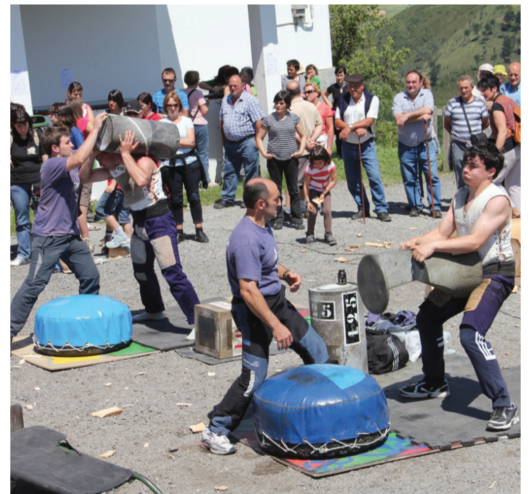
Herritar ugari gerturatu zen Azkortera iaz. Harrijasotzaileen erronka polita ikusi zuten.

Irteeran parte hartu nahi dutenek goizeko 09:00etan Sagardotegi kalean dute hitzordua.