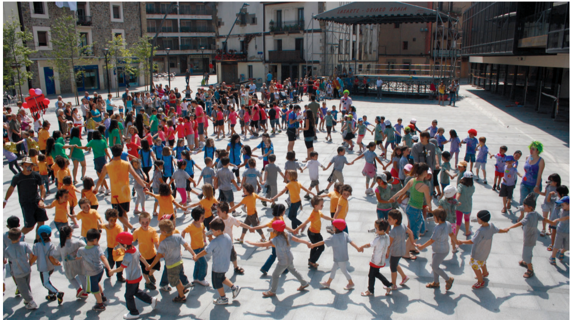
Haurrak ikastetxeetan elkartzen baldin badira ere, gero ekintzak kalean burutzen dira gehienetan.