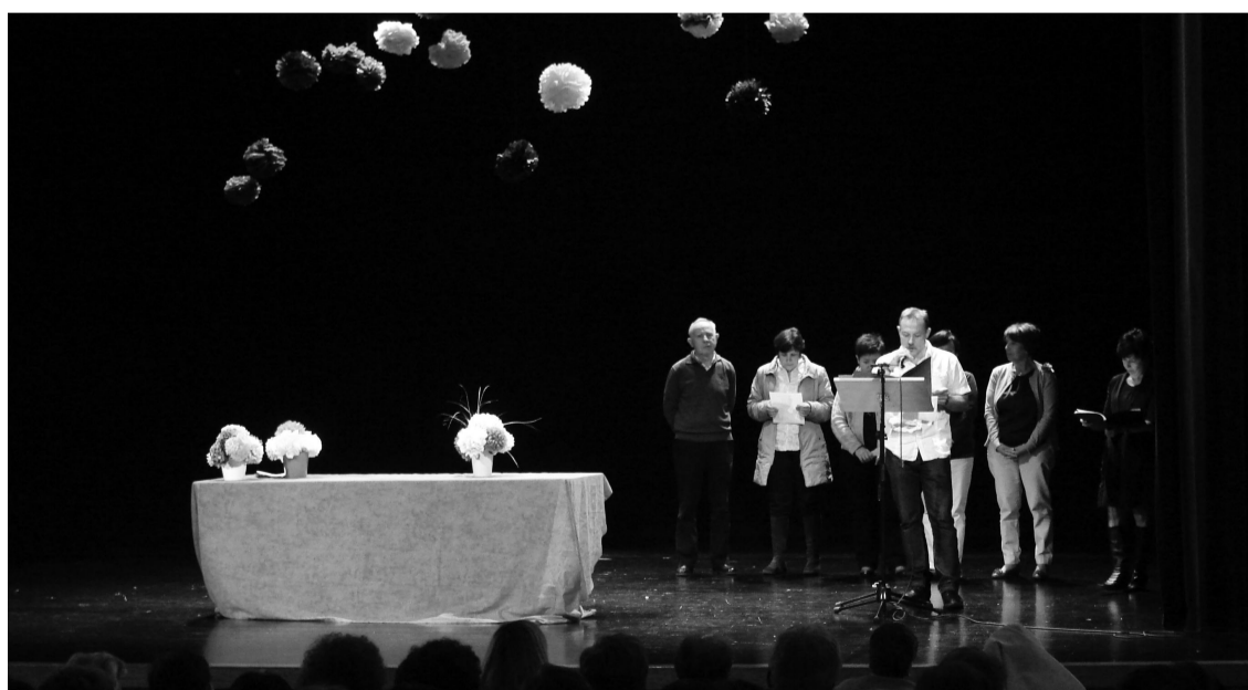
Irakurketak egin zituzten ikasleak banan-banan Manuel Lekuonako oholtzara igota.