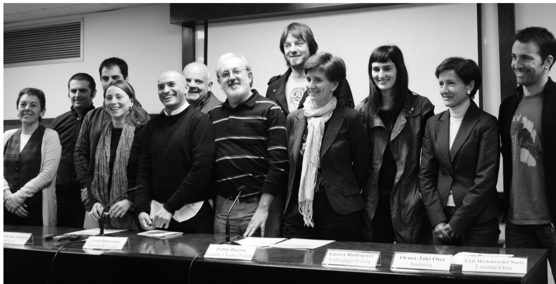
Bailarako udal ordezkariak eta enpresa parte hartzaileen ordezkariak agerraldia egin zuten Manuel Lekuonan astelehenean.

Enpresa batek "Baietz gurean!" egitasmoan parte hartzea erabakitzean, HPSK Lanhitz programaren barruan definituta duen Erreferentzia Marko Estandarra (EME) erabiltzen dute Buruntzaldeko