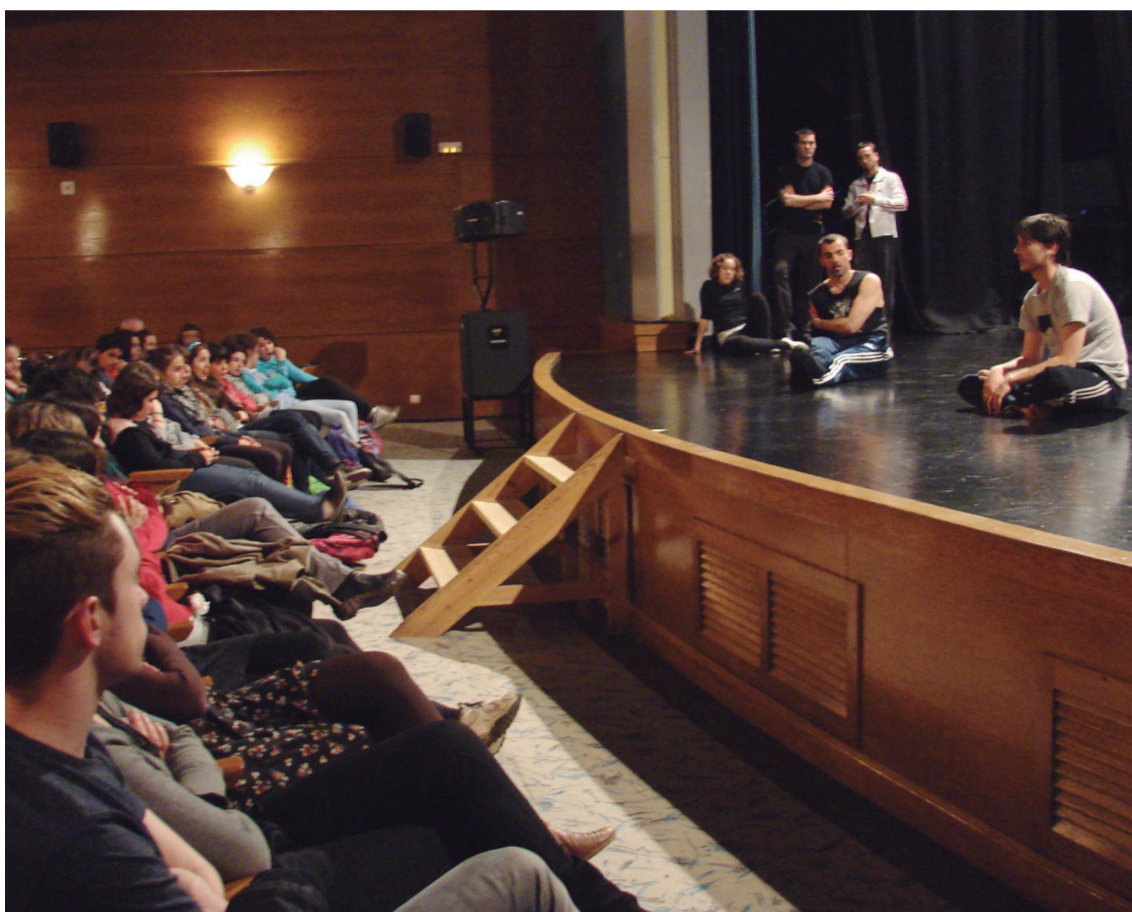
Dantzatzeaz gain, Kukaikoek euren koreografien inguruan solasean aritzeko aukera izan zuten.

Hilaren 14tik 25era bitartean, Kukukak antzerki eta dantza astea antolatu du eta eskolako taldeek ikasturtean prestatutako lanak erakutsiko dituzte. Maiatzaren 26rako, festa handi bat antolatuko dute Okendon.