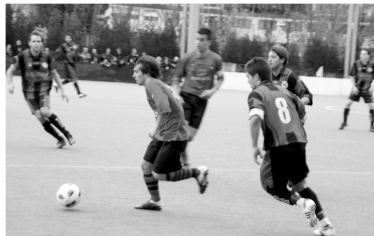
Gogor egin zuten lan Ostadarrek eta bederatzirekin amaitu zuten partida. T. VALLES

Lehen kaleratzea gutxi ez balitz, 75. minutuan bigarren jokalaria bat kanporatu zuten epaileak eta Ostadarrek bederatzi jokalarirekin egin behar izan zion aurre partidaren amaierari.