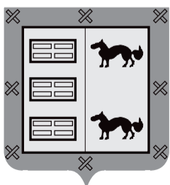
Lasarte-Oriako Udala Euskara Batzordea