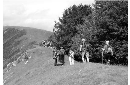
Arantzatik Lasarte-Oriarako bidea egin zuten iaz hogeitazaleak.

Aurten 11 orduko txangoa izango da egingo duena. Antolatzaileek aipatu digute-