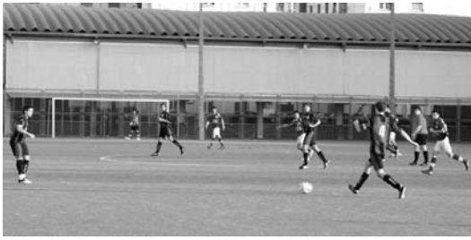
Sanpedrotarrak taldearen aurka gogor jokatu ziren herritarrak, garaipena eskuratzeko.