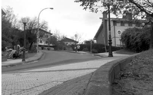
Zabaletako aldapa berurbanizatzea auzoz auzoko bileretako ideietako bat da.