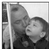
Aitona eta Haritz

Zorionak Jalguneko lagun partetik! Merezitako ospakizuna egingo dugu bihar.