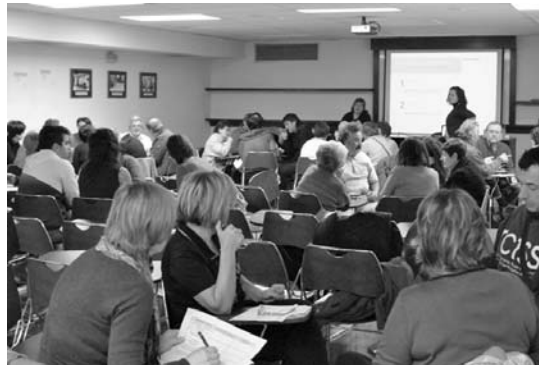
“Auzoz auzo. Pausoz pauso” ekimenak parte-hartze ona izan du.