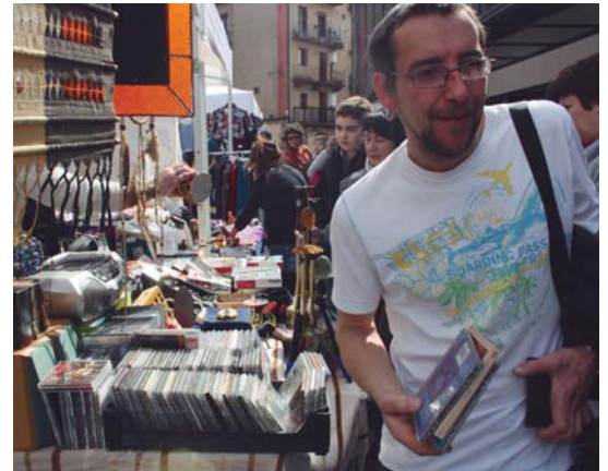
Herritar asko hurbildu ziren azokara, eta gehienek erosi zuten zerbit.