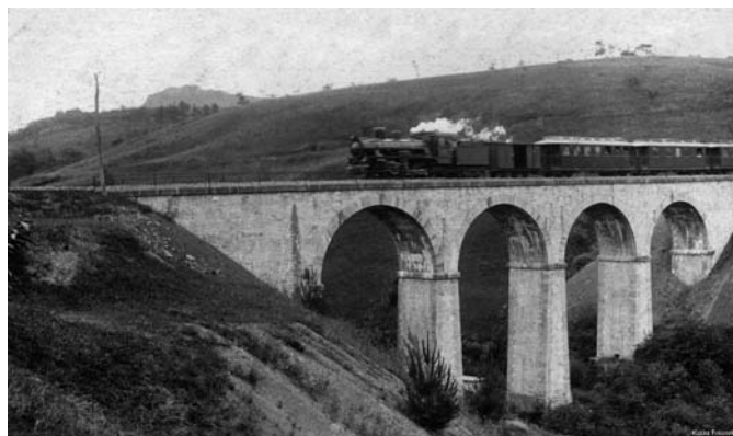
Plazaolako tren egun Tren txiki deritzen zubitik.