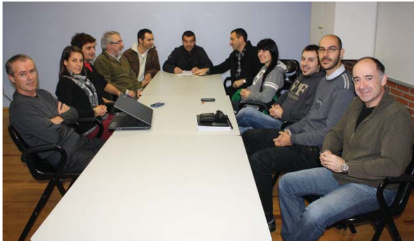
Kirol eta Euskara Zerbitzuko ordezkarien eta Kiroldetik monitoreen arteko bilera.

2002-2003 ikasturtean jarri zen programa abian, "ikusirik kiroldegiko erabiltzaileen artean asko zirela ikastaroak euskaraz egiteko adinako euskararen ulermen maila zutenak". Orduan, bost taldetan aplikatu zuten metodologia hori, horiek baitziren monitore elebidunen ardurapean zeuden taldeak (kiroldegiko talde guztien %30 inguru). Hamargarren aldiz ari dira horretan 2011-2012 ikasturtean eta ia ehunetik ehunetan, 43 taldetan, eragiten ari dira. Gimnasioko eta igerilekuko laguntzaileak daude soilik kanpoan.