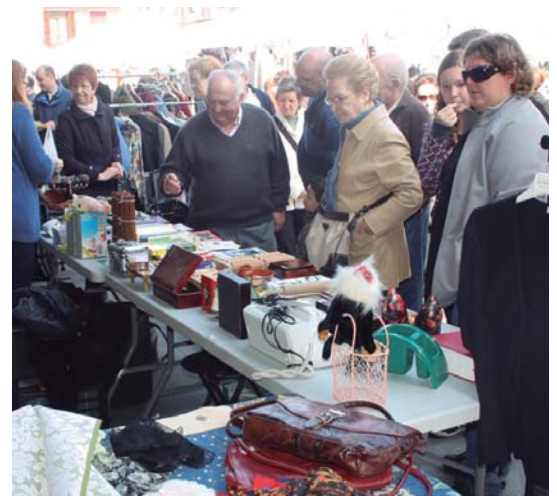
Adin guztietako jendea ibili zen batera eta bestera mauka bila.

Lehiaketa bat ere jarri dute abian, etxean nola birziklatzen duzun erakusteko. Bidali zure argazkia olaiarenerroka@gmail.com-era, onenarentzat Mugaritzen afaria sari.