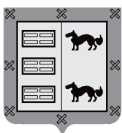
Lasarte-Oriako Udala Euskara Batzordea