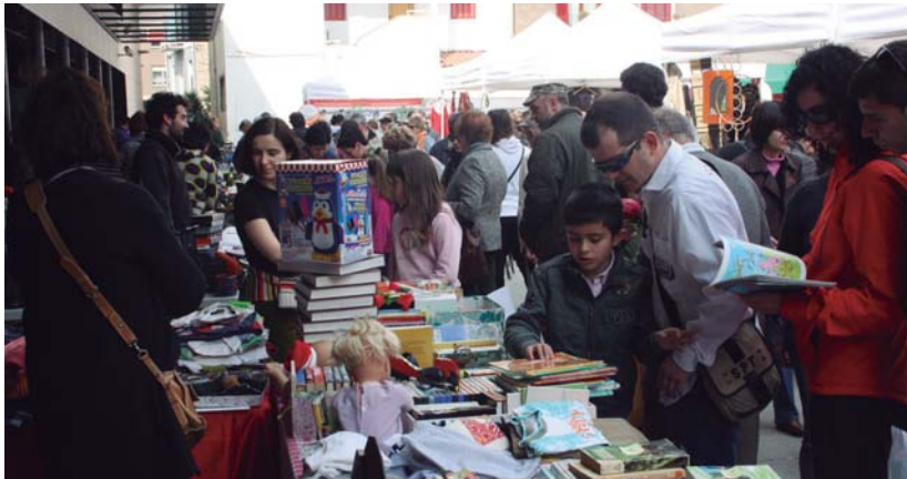
Eguraldi ona lagun, bete-bete eginda ageri zen Okendo plaza larunbat eguerdian.