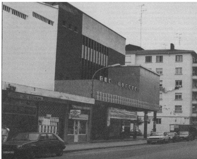
Tedoso zinea 1989an.