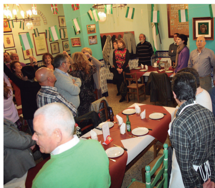
Andaluziako ereserkia zutik jarrita entzun zuten bazkaltzera joan zirenek.