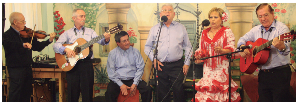
Duendes Flamencos, Gitanillos del Alba eta Coro Semblante Rocierok abestu zuten mezan, arratsean, Sentimientok.