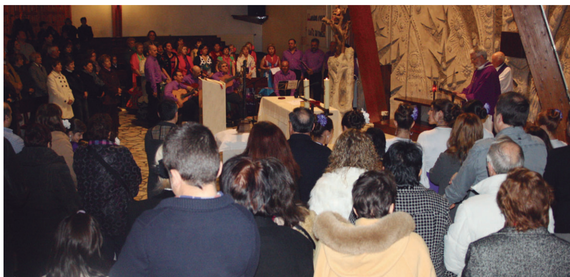
Herritar ugari hurbildu ziren Arantzazuko Ama birjinaren elizara Andaluzia Eguna ospatzeko egin zen meza aditzera.