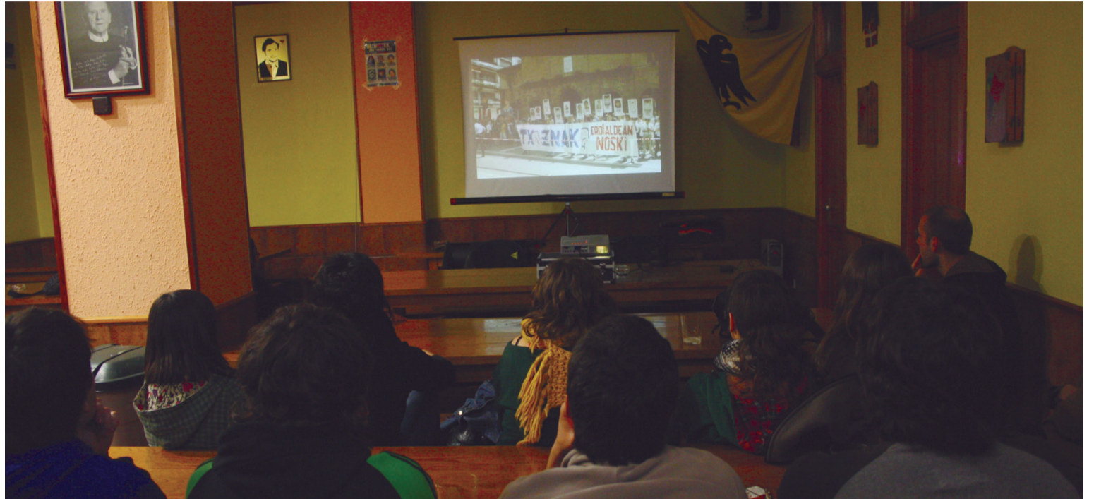
Hainbat gazte bildu ziren Xirimiri Elkartearen Sorgin Jaiek sorreratik gaur egunera arte izan duten bilakaera azaltzen duen bideo emankizuna ikusteko.

Sorgin Jaiek eztabaida eta hausnarketa prozesu bat abiatu zuten duela hilabete batzuk. Orain, eztabaida horren emaitzak plazartu dituzte lau puntutan banatuta: antolakuntza, herri mugimendua, aurrera begira jarritako helburuak eta Udalarekiko harremana aztertu dituzte bertan. Hori aurkezteko, ostiral ilunabarrean bideo emanaldi bat egin zuten Xirimirin eta bertan sorreratik gaur egunera arte Sorgin Jaien antolakuntzan aritu direnen iritzia bildu eta urtez urte gertatutakoa laburtzen zuen argazki galeria ikusi zituzten.