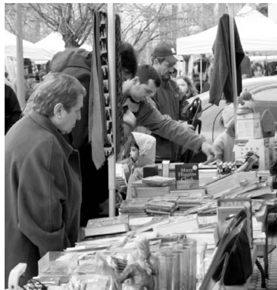
Erabiltzen ez diren eta egoera onean dauden gauzak saltzeko aukera ematen du azokak.

Postua erreserbatu nahi dutenek www.merka2sanmarcos.org webgunean edo 943 670249 zenbakira deitu behar dute.