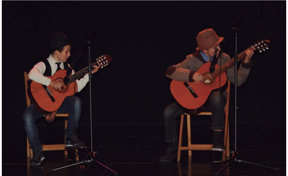
Musika eskolako ikasleek kontzertu bufoa eskaini zuten Manuel Lekuona kultur-etxean.

Hauetan eta Trumoi tabernan, pintxo poteo olinpikoa egin ahal izango dute kirolari trebeek. Antolatzaileek mozo-rotzeaz gain, ekimen honetan