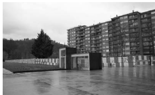
Hipodromo etorbideko lur saila aparkaleku bezala erabiltzeko eskaera egin dute.

Izan ere, bizilagunek argudiatzen dutenez, "krisi egoera dela eta, Muriasek ez ditu epe motzean etxebizitzak eraikiko".