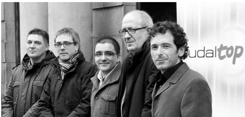
Udaltop antolatzen duten erakundeetako ordezkariak aurtengo jardunaldietako aurkezpenean.