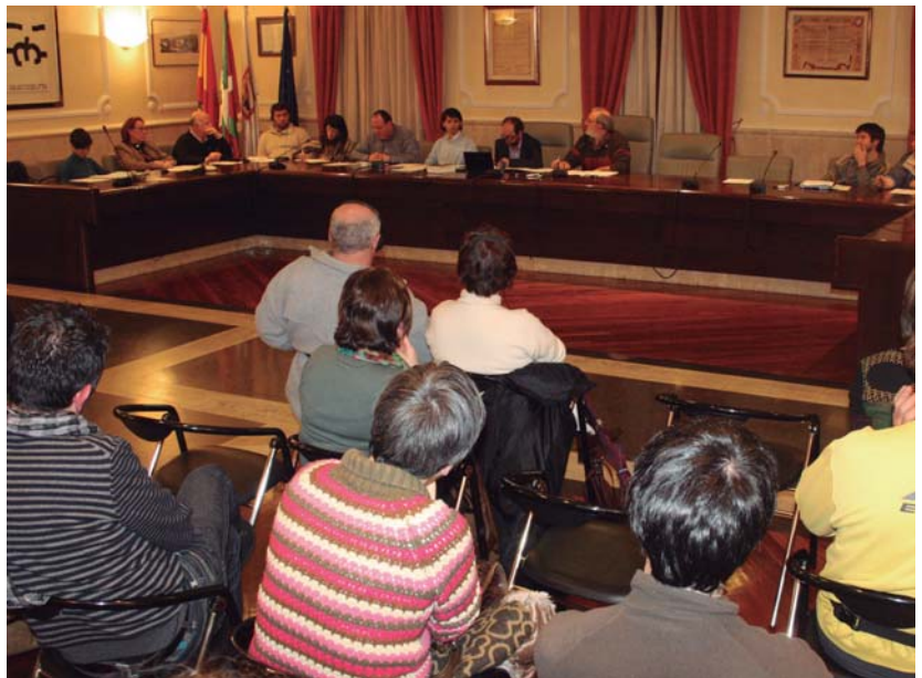
Zenbait herritar gerturatu zen pleno aretora Udalbatzarreko nondik norakoak ezagutzeko.