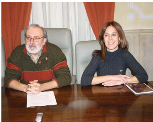
Zuhurtziaz jokatu du Udalak eta ordaintzeta egiteko moduan da.

Dena den, udal ordezkariak ustez ez da argi gorririk piztu, Udala ordaintzeta horiek Aldundiak ezarritako epe eta baldintzetan egiteko moduan da, baina hausnarketa "sakona eta eraginkorra" egiteko unea da. "Hausnarketa egiten