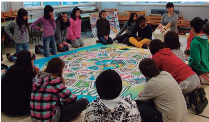
Sasoeta eskolako ikasleak Flextitit Flextira jolasaren aurrean azalpenak adi-adi entzuten.

Birziklapenari dagokionez, argi dute haurrek zein ontzitan bota behar den gauza bakoitza, urdinean hau, horian bestea... baina edukioontzi berdean beira eta kristalaren arteko ezberdintasuna bitan galdetu behar izan zuten batzuk.