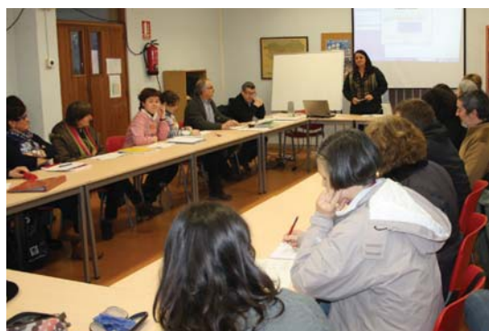
Astelehenean hasi ziren Landaberri ikastolan irakasleen formakuntza saioekin.

Gainera, hitzaldietara etorri beharko lirateke, eguneroko bizitzan erabilgarri diren hainbat tresna emango zaielako, saiotik etxera joan eta egun horretan bertan praktikan jartzeko modukoak, eta baita, tailerra oso praktikoa delako ere, ez da azalpen teoriko luzerik izango, segituan egunero gurasoek bizi dituzten egoerak lantzen hasiko gara. Eta elkarrekin 20 guraso egoteak bi elementu oso aberasgarri ditu, batetik tailerren beraren edukia eta bestetik beste familien esperientziak: 20 guraso elkartzean batzuek besteie irakatsi diezaiokeguna, ia ia, tailerrek berak erakusten duena bera bezain inportantea da. •