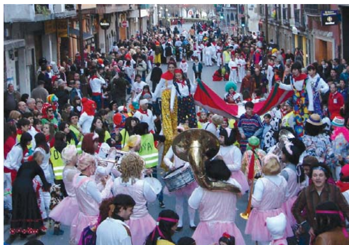
laz, inauterietako gaia, San Ferminak izan zen eta eguraldia lagun herritar askok hartu zuten festan parte. Aurtengo inauteriak ere jendetsuak izatea espero dute antolatzaileek.