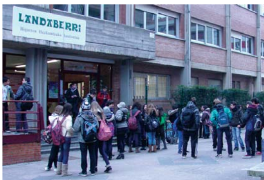
Landaberri BHIko ikasleek goizeko hamaiketan amaitu zituzten saioak.

Bestalde, Lasarte-Oriako Udalak eta Euskotrenek ere lau orduz eten zuten haien