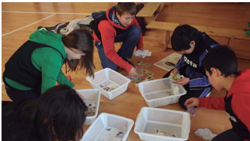
Landaberri astearrean burutu ziren tailerrak eta gustora aritu ziren ikasleak jolasean.

Batez ere, berrerabilerak duen garrantziaz ohartu behar dira orain eta ideia horretan hezi. Izan ere, hezkuntzak duen garrantziarengatik burutzen dira halako ekimenak gizarte honetan kopurua