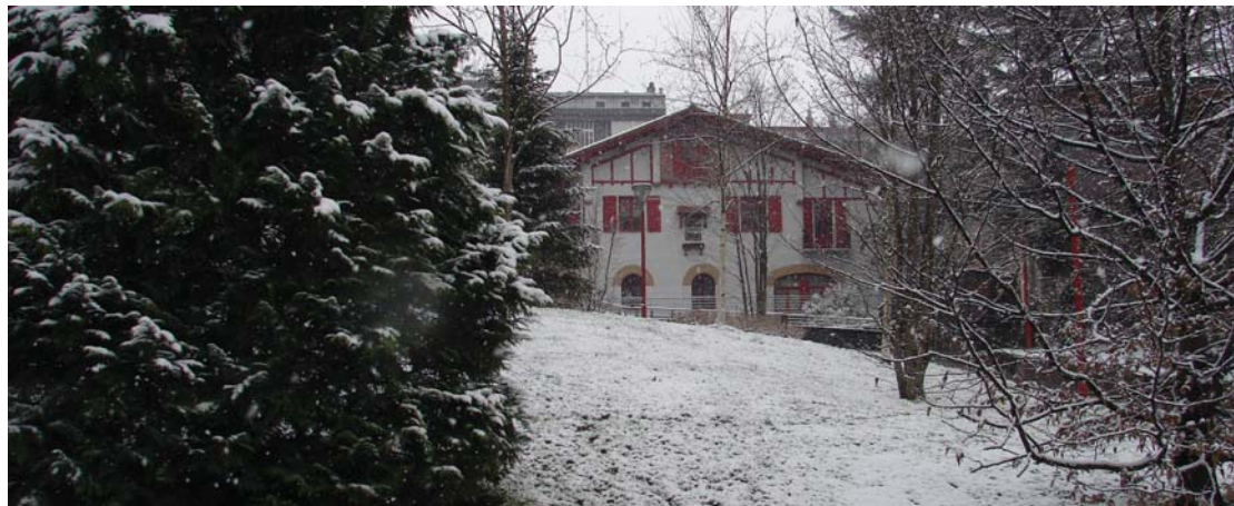
Villa Mirentxu inguruko parkeak halako itxura hartu zuen atzo eguerdian.

Oinatz taldeko lagunak eta 20 bat herritarrek harresi barruko Donostia-ri buruzko historia eza-gutu zituzten urtarillaren 22an egin zuten txangoa. Giro ederrean, gidari berezi eta ongi prestatuen bitartez, Motako Gaztelu, Santa Maria basilika edo San Bizente elizari buruzko hainbat kontu eta gertaera entzun zituzten. /5. orrialdea