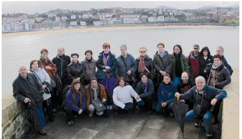
Donostiako ikuspegi polita izan zuten Oinatz taldeko lagunek eta herritarrek Urgull Menditik.

Izan ere, Santa Maria lehenik eliza erromanikoa zen, 1.500ean, bere lekuan eliza gotikoa egin zuten, baina ondoan zuen bolborategiak eztanda egin zuenean suntsitu zen. Gerora, 1700ean Cara-