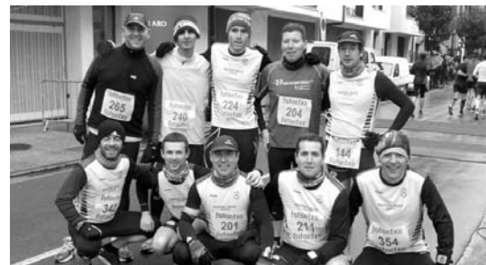
Idiazabalgo proban parte hartu zuten lasarteoriarretako batzuk.