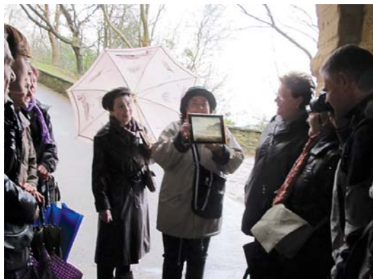
Motako gaztelu eta harresiko nondik norakoak adi entzun zituzten. OINATZ TALDEA

caseko Errege konpainiak Koruko Amabirjina babesle bezala hartu eta eliza berregitako dirua jarri zuen.