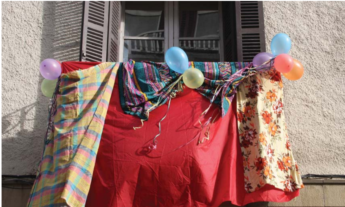
Ttakuneko balkoia inauteri koloreekin apaindu zen. Antolatzaileek deialdia luzatu dute inauterietan herriko balkoia apaintzeko.

Ondoren, plazan, ikuskitzuna eskainiko dituzte herriko bi koadrilek, ATC saskibaloitako jokalariek osatzen duten "Zumeta-