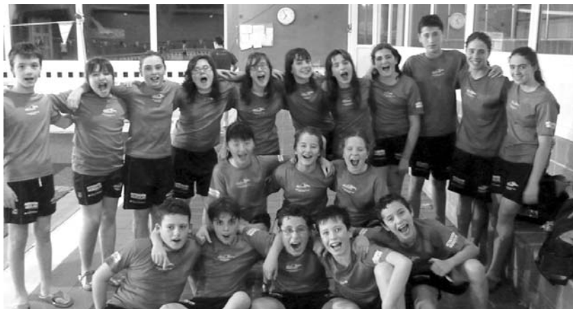
Kutxa Sariko kanporaketan parte hartu zuten Buruntzaldea IKTko gazteek lan ona egin zuten.

11:15etatik 12:30era, Eskola Kirolean LH3ko ikasleentzat igeriketa topaketa izango, Kiroldegiko igerilekuan.