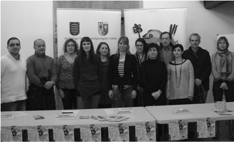
Sarien zozketan udal ordezkari eta autoeskoletako ordezkariak egon ziren Usurbilen burutu zen agerraldian.