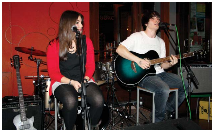
Bi "n" Bi taldeak Jalgin emandako kontzertuan punk doinuez gain, kantu lasaigoez gozatzeko aukera izan zen.

H iru kontzertu eskaini ziren ostiral gauean Lasarte-Orian. Lehena, Añorgatik etorritako Bi "n" Bi talde gazteak eskaini zuen Jalgi Kafe Antzokian. Bertan punk doinuak entzuteaz gain, kantu lasaigoak ere aditu ziren gitarra akustikoaren laguntzaz. Abend-en berriz, metal doinuak izan ziren nagusi gauerditik aurrera. Lehenik, Hira talde oiartzuarraren kontzertua ikusteko parada izan zen eta ondoren, Mendeku Itxua talde usurbildarra izan zen entzungai. Ostiral gaua musikarekin uztartu zen beste behin Lasarte-Orian. •