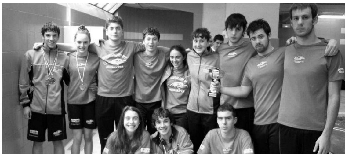
Lan ederra egiten ari dira Buruntzaldea IKT-ko gazteak Neguko txapelketetan.

Otsailaren 4ean, larunbatean, Eskola Kirolean parte hartzen duten LH3 eta LH4ko ikasleentzat igeriketa topaketa egingo da herriko kiroldegiko igerilekuan. LH4koen txanda 10:00etatik 11:15era izango da eta ondoren LH3koak 11:15etatik 12:30era izango dute euren tartea. •