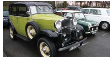
Afrikarrak hotzez akabatten, bokadiloa eta motxilaren tradizioa, auto klasikoak...