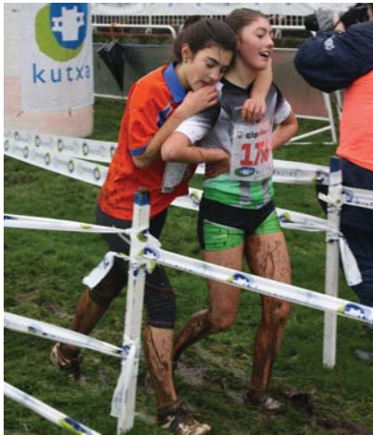
Huskizunaz gain, laguntasun eta kiroltasun lezioak ere eman zituzten lasterkariak.