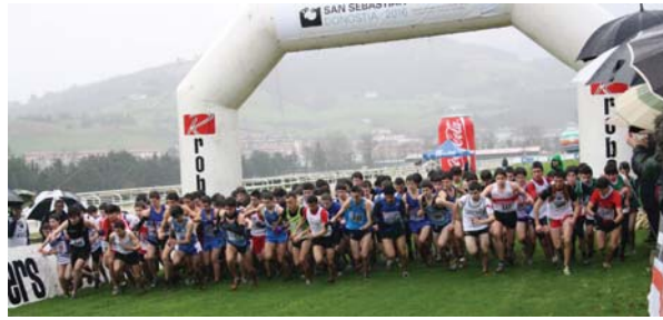
Irteeran guztiak nahi izaten dute leku onena hartu... Horretarako ukalondo, beso eta belau, dena erabili beharra dago.