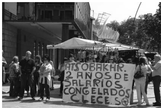
Maiatzan langileek Udaletxearen aurrean egindako mobilizazioaetakoa bat.

Egoitzak azken urteotan Aldundiak ezarritako langile kopurua baino gehiago ditu, baina langileen ustez, "guztiz beharrezkoak zerbitzua behar bezala emateko". Langileek diotenez, Lasarte-Oriako egoitzan dauden pertsonen denetarik beharrik dituzte eta kasu askotan dedikazio osoa eskatzen dute. Kasu hauetarako,