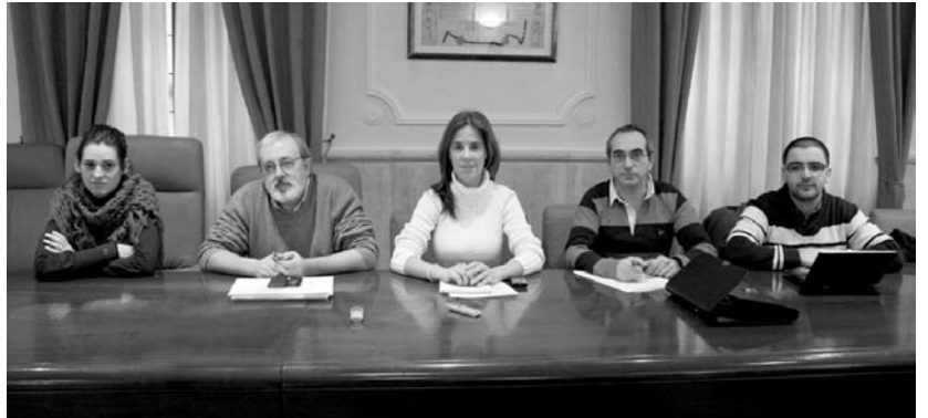
Bildu, EAJ eta LOHP alderdietako zinegotziek PSE-EEK 2012. urteko aurrekontuei buruz adierazitakoari erantzun zioten.