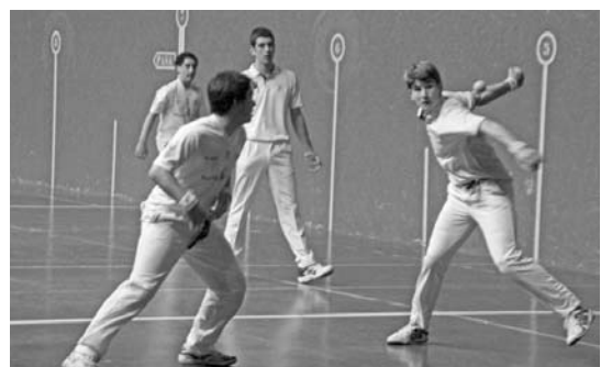
Euskal Herriko txapelketako partida ederra ikusi zen Michelingo pilotalekuan. T.VALLÉS

Hala ere, Intzako bikoteak 16 tantoa egin eta "sakea eskuartzarekin batera, bere jokoa