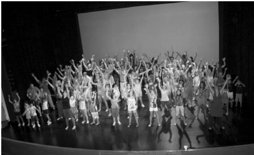
Kukuka antzerki eta dantza eskolak ikasturte berriaren eta hamargarren urteurrenko aurkezpena egin zuen irailean.