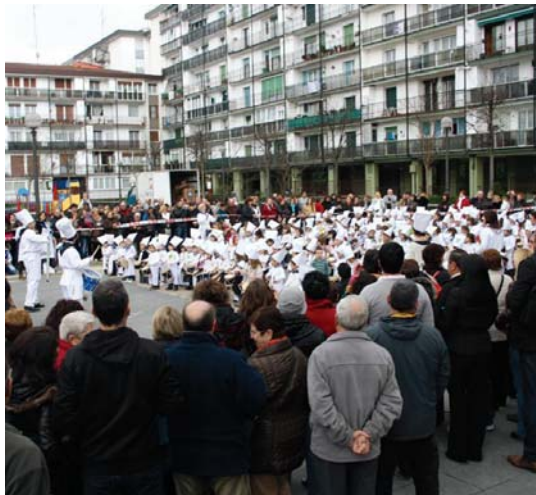
Guraso ugari hurbildu ziren Landaberri ikastolako Garikoetxea erakiner eta Isla plazara etxeko txikiak ikustera. Batzuentzat gainera lehengo danborrada izan zen.