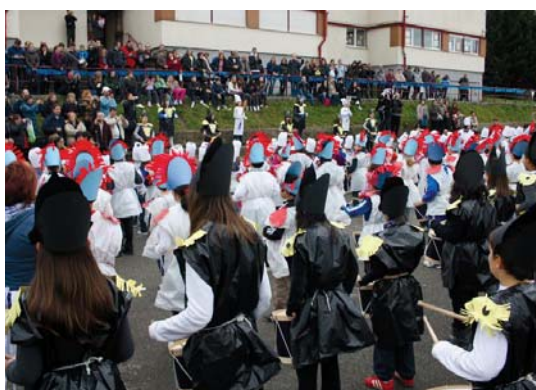
Ederki jarraitu zituzten danbor-jole nagusien aginduak ikastetxeetako hurrek.