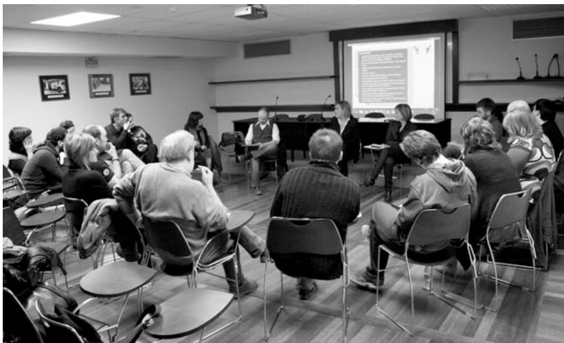
Hitzaldi-aretoan egin zuen aurkezpena Abaraskak eta politika, kultura zein hezkuntza arloko jendea bildu zen bertan.