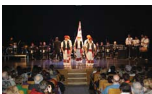
Erkezes dantza taldearek ere omenaldia egin nahi izan zioten Zero Setteri.