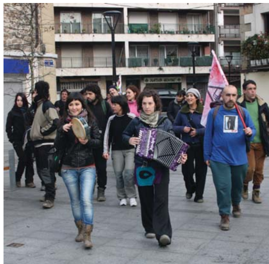
Arratsaldean kalejiran etori ziren Oriatik Okendora.