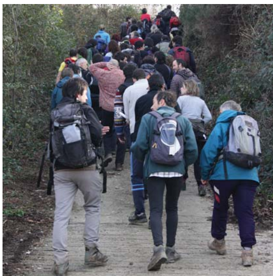
Ibitariet lau orduko martxa burutu dute.