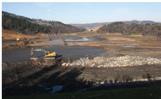
Makrokartzela egin nahi duten tokiak. Tunelaren beste aldean erraustegia legoke.