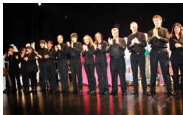
Akordeoi joleek kontzertu borobila eskani zuten eta amaitzean, emotioak gainetza egin zuten.