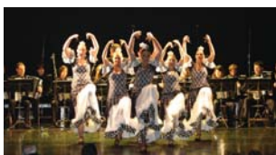
Zambra taldeak ikusleaz polka eskani zuten. Irudian, kritikariek antzerria.