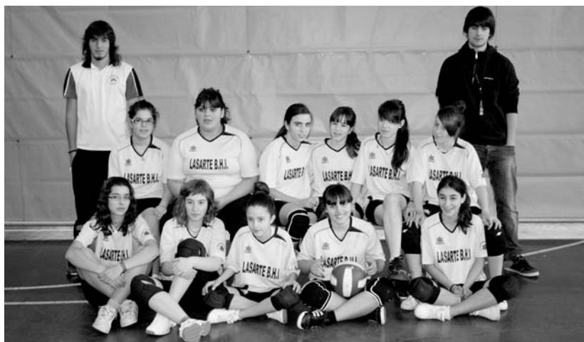
Larunbatean, ligako partidua hasi baino lehen, Lasarte-Oriako kiroldegian ateratako talde-argazkia.

Kopuruz ere bikain dabilta: "Gehienez 12 fitxa egiteko aukera dago eta 12 neska daukagu partiduak jolasteko aukerarekin. Hala ere, orain