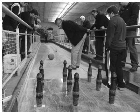
Parte-hartzaile bakoitzak zortzi aldiz bota behar izan zuen 9 kiloko bola.

Hala ere, arestian aipatu bezala entrenatzaile bikoteak ez die emaitzei gehiegi begiratzen, galtzea "inorentzat gustagarri" ez dela aitortzen duten arren. •