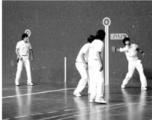
Intzako kadetek Zazpi Iturriren aurka jokatu beharko dute gaur finalean.

Bestalde, II. mailako kadetek ere finalerdia jokatu zuten larunbatean.