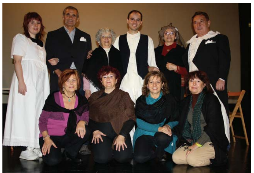
Antzerki taldeko kideak aste honetan Kultur etxean burututako entseguan.

Saioa 20:00etan hasiko da eta sarrerak 2 eurotan daude salgai. Antzerkia publiko guztiarentzako da. •