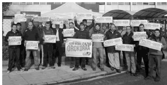
LAB sindikatuko kideak Michelin enpresako harreran egon ziren. LAB SINDIKATUA

Urtarrilaren 7ko manifestazioaren harira, egun hauetan Donostiako kanpusean baraualdia egin ari dira.