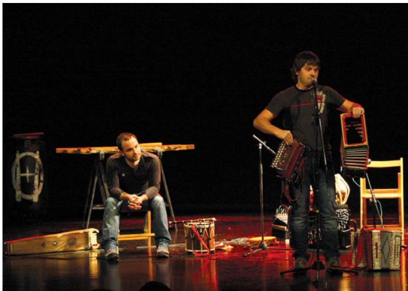
Trikitixa bat barrutik nolako den ikusi zuten Manuel Lekuonako aretoan zeuden haur eta helduek.