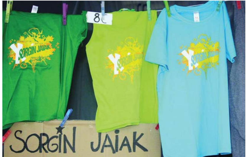
Sorgin Jaia beharrezkoak ote diren eztabaidatzetik hasita, hausnarketa sakona egingo dute jai alternatiboiei buruz.

Eztabaidaren bultzatzaileek ustez, "lehen debekutik hamar urte igaro ostean, beste egoera baten aurrean kokatzen gara, herriaren babesa