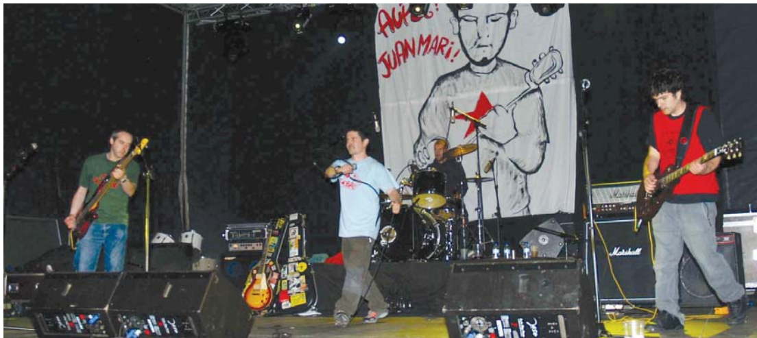
40 de Fiebre taldekoak Multimusikalean jotzeko elkartu dira berriro. Ostiral gauean joko dute Okendon Oi Salimos, Bartzelonako La Kinky Beat eta Rude Kanka Sound System-ekin.