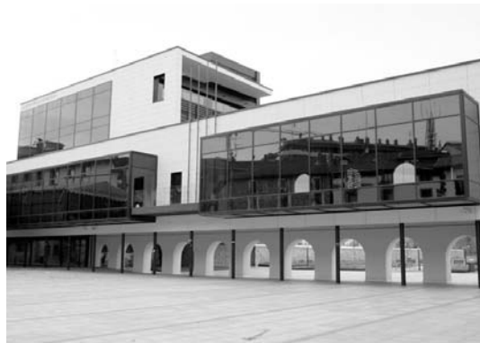
Udaletxe berria erabili ahal izateko 600.000 euro ordaindu behar ditu Udalak.

Era berean, Bilduko Tasio Arriabalagak eta LOHP Ana Isabel Prietok PSE-EEK hainbat komunikabideetan argitaratu