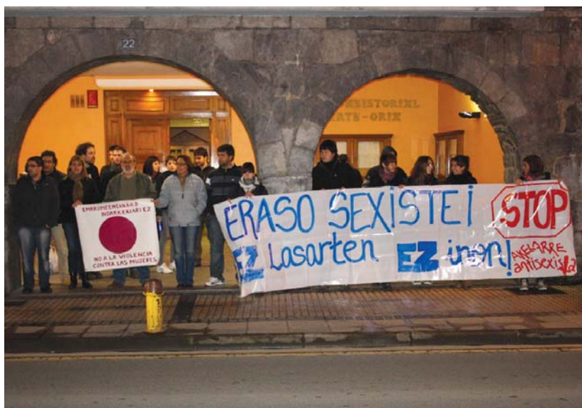
Herriko alderdi politiko ezberdinetako ordezkariek eta herritarrak bildu ziren aurreko asteburuko indarkeria kasua salatzen.

Larunbatean atxilotu zuten 34 urteko gizonezkoa Lasarte-Orian ustez genero indarkeria delitua egotzita. Ertzaintzak jakinarazi zuenez, bikotekideari eraso egin zion eta eskailere-tatik behera bota. Eraso ikusi zuen pertsona bat emakumeari laguntzen saiatu zen, baina, lekukoaren eta erasotzailearen arteko liskarra hasi, eta tirabiran zirela ertzaintza heldu eta hau atxilotu egin zuen. •