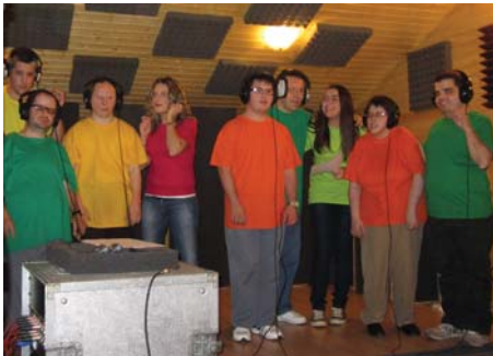
Musikari profesionalen antzera elkarrean kanta grabatzen aritu dira '20 minutu' taldeko kideak.