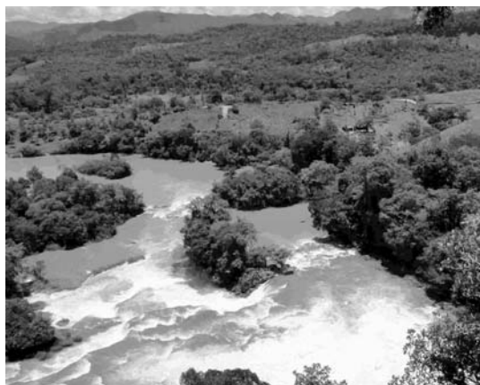
Oso handia da Mexiko, denetarik du eta batetik paraje berdeak erakutsiko ditu.