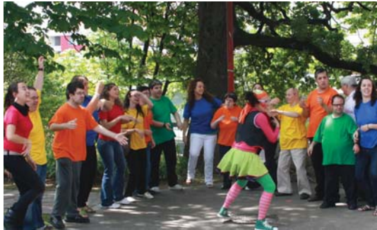
Pirrox, Porrotx eta Mari Mossen biokiporen grabaketan parte hartu dute Jalguneko kideak aurrin.