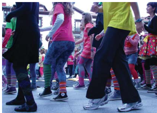
Koordinazio handia behar da lip dub bat egiteko, eta oso ondo aritu ziren denak.