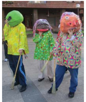
Buruhandi lanetan jalguneko hiru kide doctore jantzia.

dualki' ehun partaide inguru. Herriarrok bertara gerturatzeko animatzen dituzte Jalgunekoak "sarrera irekia da eta ondo pasatuko dutea ziurtatu daiteke". Goniadepanek www.lasarteoriarairean.eu-n eskura daitezke. Bazkaria laguntzaileekin Gainera ospakizunak ez dira jaialdiarekin amaituko, abenduaren 3an bazkaria egingo dute Goiegi jatearekin Jalgunekoak, gazteak, begiralearak, familiarak eta urte guztian beti laguntzeko prest egon diren lagunak. Bazkariaren ostean, dantzaletan egingo dute Villa Mirrentsun 17:00etatik 20:00etara eta hemen DJ bat egingo da festa giroaren. Honetan ere nahi denak hartu ahal izango du parte "herriarrok parte hartzea animatzen ditugun, hurrengo urteko ibilbidea gurekin osatu dezaten". Anbulategi herriko bigarren solairuan bilzen dira Jalgunekoak eta beraien ezagutu edota egiten dituzten jardueratan parte hartzea prest daudelarik "beti ongi etoririk izango dira". Facebook sare sozialean aurki daitezke ere Jalgune Elkartearen ikurak, bide horretatik euren kontaktuan jantzi daitezke informazio gehiago eskatu edo egiten duten guztia hobeto ezagutzeko. ■