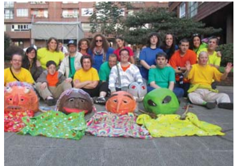
Buruhandak presenten egon dira herriko beste Karrezoako festatan, besteak beste, Semblante Andaluz elkarreko antolatzaileekin.