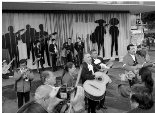
Bestetik, Mexiko Hiria oso handia, bizia, kontaste handikoa, ... da. 40 milioi bizi dira.

zuten eguna. Sekulako matematikariak, astronomoak, eraikitzaileak etab. ziren. Beraien artean gerra edota lis-karrak izan zituzten, baina ez