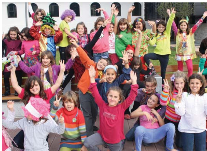
Begiraleek ere primeran pasa zuten goiza txikiak koordinatu eta haiei animoak ematen.

Antolatzaileek ekimenaren balorazioa egin zuten eta gustura geratu ziren gazteek emandako erantzunarekin. •