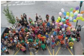
Lip Dub-a ekintza arrakastatsua izan da, 150 lagun mozorro eta guzti elkartuta.