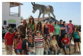
Sendiviro partera egindako inzeran gaitzak begiralearen bazara.