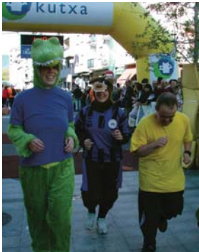
Herri krosoan parte hartu dute 'klubeko' ilar den kroledorito jantzia bazuk.