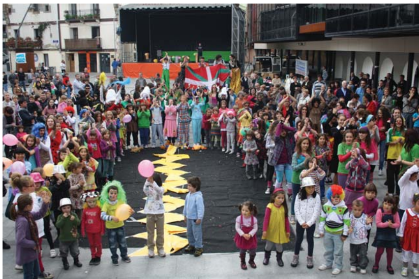
Okendo plaza jendez lepo. Gurasoek ez zuten seme-alaben saioa ikusteko aukera alferrik galdu.