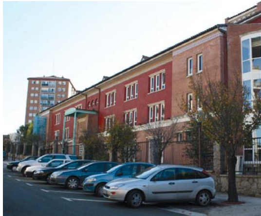
Atsobakar erresidentziako eskumenak eta defizita izan ziren eztabaidagai udalbatzarrean.