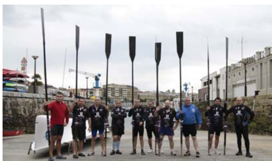
Errugbi taldekoek arrauna hartu zuten egun batez. BELTZAK

Ondoren, guztiak erronka hasi zen lekura bueltatu ziren,