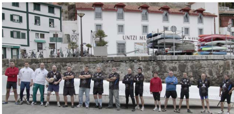
Gustura geratu ziren egindako lanarekin parte hartu zuten guztiek eta talde argazkian denak irripartsu. BELTZAK

Arraunlari beteranoen azalpenak adi-adi entzun ostean, arraunean nola egiten den lehorean probatu eta beldurrik