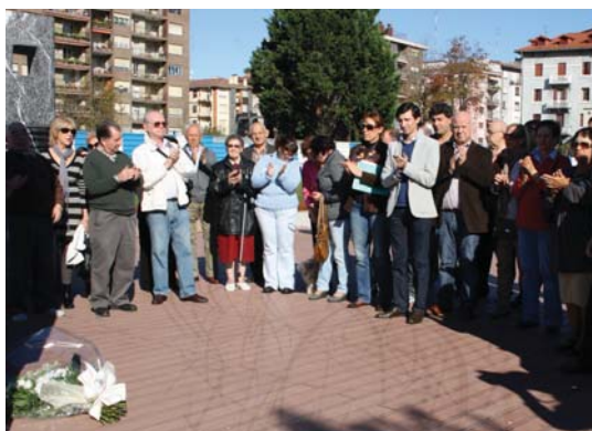
Askatasuna plazan Lasarte-Oriako PSE-EEK biktimei egindako omenaldia.

Memoria aldarrikatu behar dela adierazi zuen sozialistak, "terrorismoak eragindako biktima eta familien mina ezin dugu ahaztu eta beraiekin gaudela gogoratu nahi diegu. Ez ditugu ahaztuko askatasuna eta demokraziaren alde lan egiteagatik bizia eman dutenak". ETaren adierazpenaren harira "indarkeriarik gabeko demokrazia izango gara, baina ez memo-