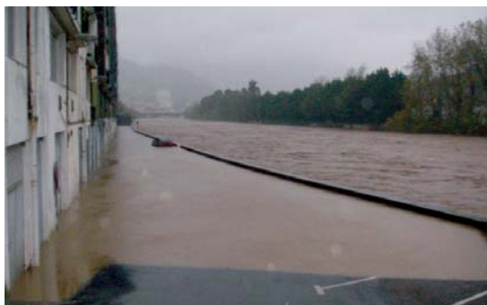
Oria ibai Erribera kalean egin zuen gainetza igandean; astelehenean, bertako lokal, garaje eta bitokietako jabeak urak sortutako kalteak aztertu eta garbiketa lanak egin behar izan zituzten.

Horrela igande goizean zehar abisuak eman zitzaiz-