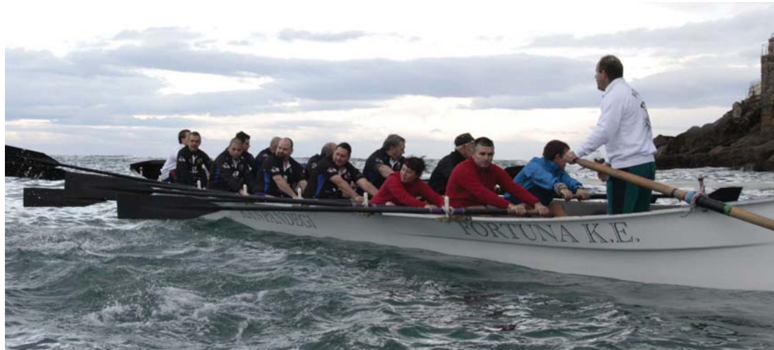
Saisoiko daudela erakutsi zuten lasarteoriarrak Uretan Kontxako bandera jokoan balitzan ekin zioten arraunari. BELTZAK

Euskadiren eguna zela eta jaieguna izan zen urriaren 25a, eta egun aproposa iruditu zitzaion Beltzak-Ostadar Jalai errugbi taldeko beteranoei kuttuna duten kirola utzi eta lehen aldiz traine-ru batean sartzeko. Gogoz ekin zioten herrikoek Donostiako Arraun Lagunak elkarteak botatako erronkari. Arraunean nola egiten den jakiteko azalpen labur batzuk entzun, beroketak egin eta prest ziren errugbi jokalaria ohiak Kontxako Badian arraunlari profesionalen antzera ibiltzeko.