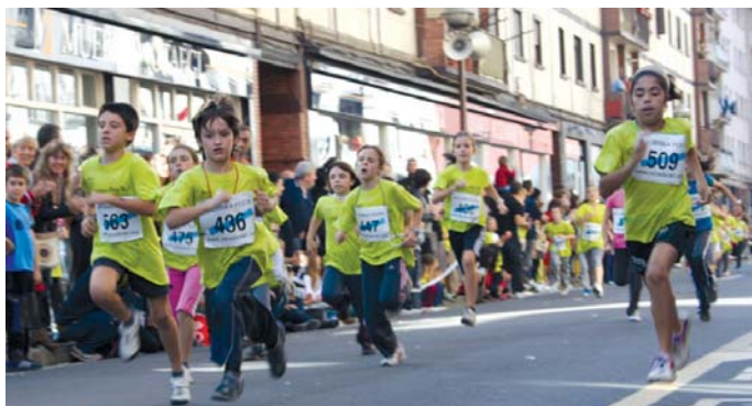
Lasterka egiteko trebeak direla erakutsi zuten herriko neska tea mutiko gazteek.