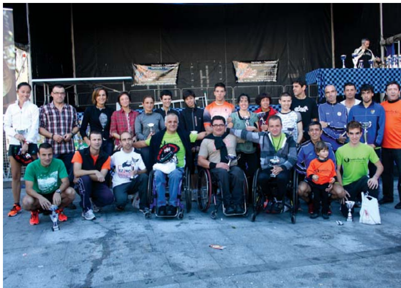
Lasarte-Oria Bai! XVI. edizioko sailkapen desberdinetako podiuma eta lasterketako antolatzaile eta babesleak.

Kilometroek aurrera egin ahala, korrikalarien aurpegiko keinuak gero eta behartuagoak zirela atzematen zen, hantxe pisua hartuko baliete bezala. Hala ere, 6. kilometro inguruan, probaren erdi aldeira, Oriako pabilioietan aho lehortua freskatzeko parada zuten lasterkariak. Oso ohi-koa izan ohi da hornidura