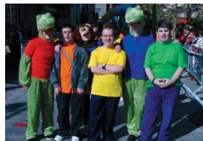
Jalguneko lagunek haien urteurrenoko ekintzekin aurrera jarraitu zuten, lasterketako azken metroak egin eta Kros festan yogurtak banatu zizkieten haurrei.