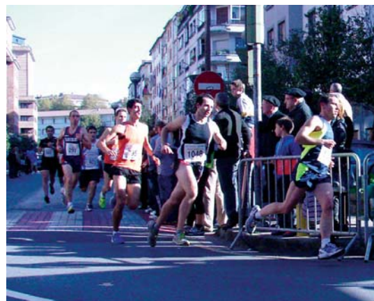
Korrikalariak herritarren animoak izan zituzten herriko kaleetan zehar.