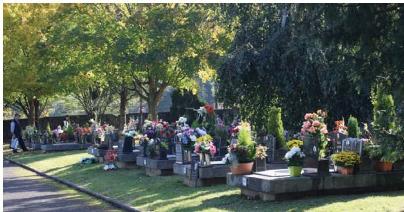
Jende askok txukun txukun jarri zituen euren ahaideen hilobiak, lore zaharrak kendu eta berriak jarri, lurra aldatu, ureztatu...