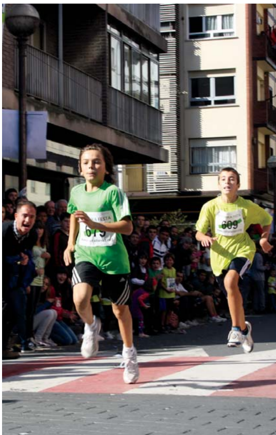
Azken metroetan ikusleek animoak eman zizkieten gaztetxo eta haurrei.