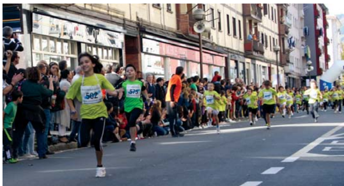
Neskak mutilak baino azkarragoak izan daitezkeela ere ikusi genuen lasterketa batean.