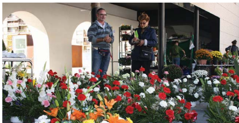
Lore saltzaileen egun handia izaten da Domu Santu Eguna, Amaren Eguna eta San Balentin Egunarekin batera.