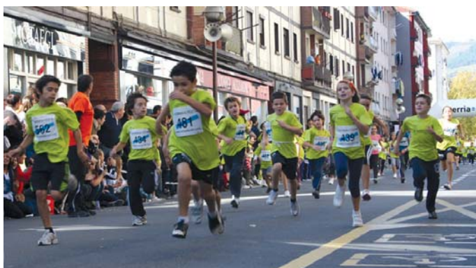
Arerioak ongi kontrolatu behar direla ederki dakite gaztetxoek. Bestela, postua galdu dezakezu.