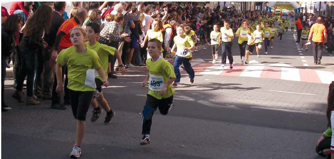
Korrikalari txiki eta gazteak fin ibili ziren haien lasterketetan. Lasarte-Oria Bai! Krosak etorkizuna duela ikusi zen igandeko Kros festan.