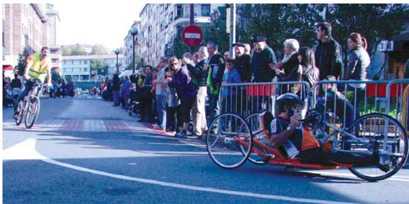
Elbarrituek eman zioten hasiera Lasarte-Oria Bai! krosari. Txapelketa honetako lehenengo sailkatuak hasieratik hartu zuen burua.