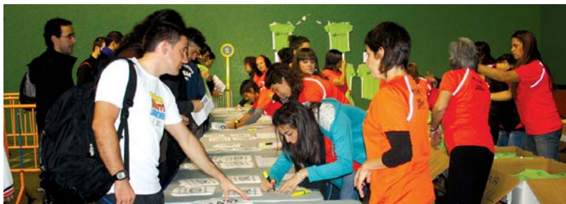
Dortsalak, txipak eta kamixetak larunbatean banatzen hasi ziren arren, igandean korrikalari asko bildu zen Michelinen.

XVI. Lasarte-Oria Bai! herri krosetako eta XI. kros txikiko argazki gehiago, www.txintxarri.info web orrialdean