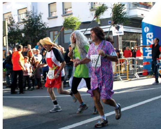
Urtero legez, umore onean eskoba lanetan izan ziren hiru lagunak.

Hauxe izan da aurtengo krosak utzi diguna. Hurrengo urtean, gehiago. •