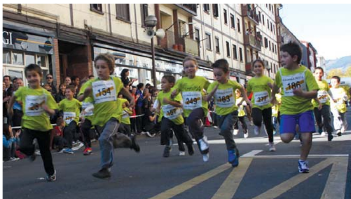
Nahiz eta lehenengo metroak kontrolpean egin, txilibittoa jo eta erritmo bizian korrika egiten zuten txikiak.