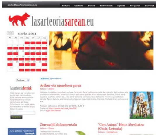
LasarteOriaSarean orrialdean herriko kultura ekintzei buruzko informazioa dago.

Kultura sailak eskaera bat egiten die herriko elkartei, "agendan ekimena argitaratzeko fitxa denborarekin