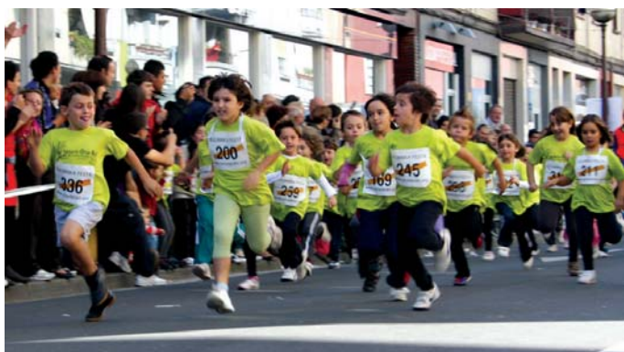
Indar eta gogo guztiak jarri zituzten gaztetxoek lasterketa buruan izan eta helmugan lehenengo izateko.