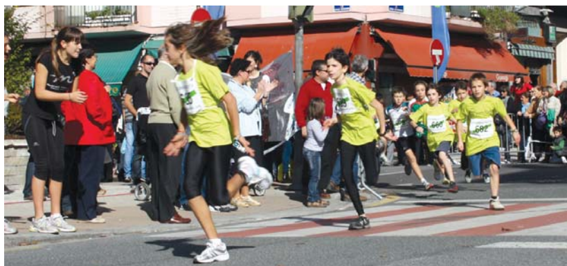
Etorkizunean Lasarte-Oria Bai! kroko irabazlea haien artean izan daitekeela erakutsi zuten gazteek haien lasterketetan.