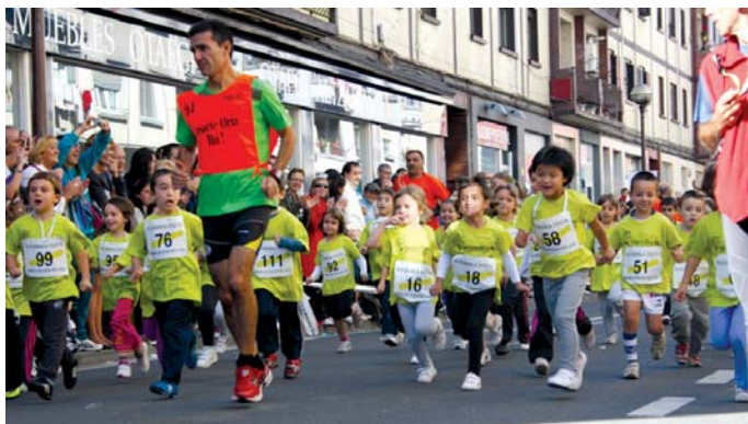
Lehenengo kros festan parte hartu zuten haurrek pozik egin zituzten lasterketako 100 metroak.

Aurtengo kros festan seirehun haur eta gaztetxo baino gehiagok parte hartu zuten