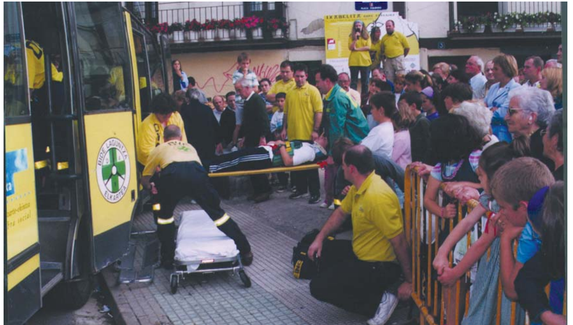
Oria Beheko DYAk bere 25. urteurrena ospatzeko hainbat ekintza antolatu ditu azaroaren 6an Okendo plazan, hala nola, erreskate-simulazioa egin edo okela txikia erreko du.

Lasarte-Oriako aurreneko taldea txikia zela jakin arazi