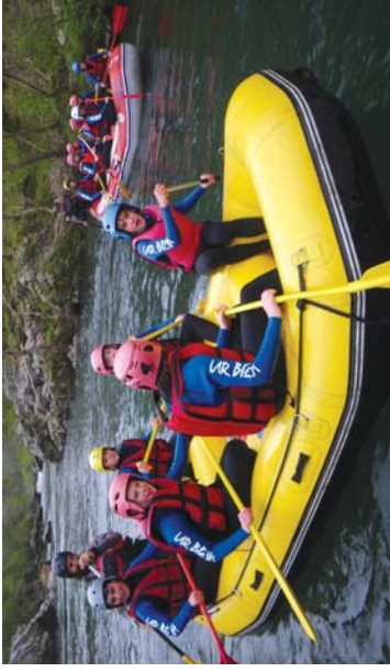
Kuadrillategiko gazteek beste herrietako gazteak ezagutu eta rinfingea egin zuten nazko KTCg festaren barruan.