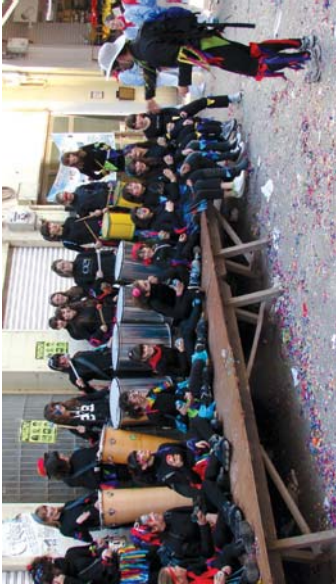
Inauteretan, San Fermineko bukadak taldeak izan ziren Kuadrillategiko neska eta mutilak.