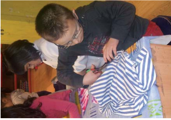
Eskulak ugarri egiten dira Ludoteketan, baita mozorroak ere.