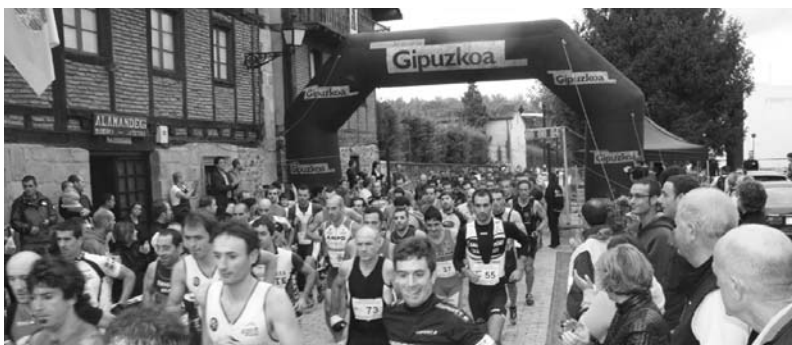
106 lasterkarik parte hartu zuten larunbat arratsaldeko proban eta ez zen aparteko arazorik izan Zubietako proban

Txintxarri diruz laguntzen duten erakundeak