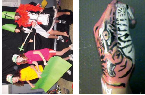
Egungo edo bodypaint izan ziren az Kuadrillategi egin ziren ekintzak.

Hurrengo Kuadrillategiko bilokue ostiralean izango dira, DBH1-DBH2, 15:30ean eta DBH3-DBH4 17:30ean. ■