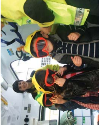
DYako lagunek, lehergo sorospenek enakuzi zieten txikiak.