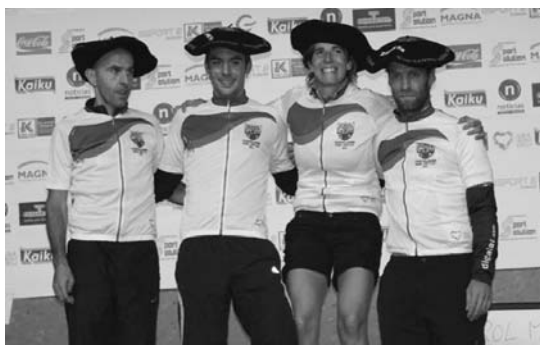
Maila guztietako Euskal Herriko txapeladunak, pozik, podiumean.

aldi berean, kontent zegoen lasterketak emandakoarekin: "Oso balorazio ona egiten dugu, jende asko bertaratu da eta lasterkariei zirkuitua gustatu zaie, gogorra izan arren". Gainontzean, "inongo arazorik" eduki ez zutela azpimarratu zuen Lasarte-Oriako kirolariak. •