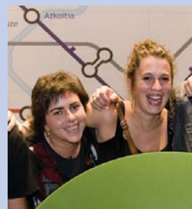
Agirre sailkatu da eta Labakak eskura du.