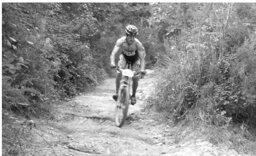
Zubietako inguruko mendietan barrena ibiliko dira lasterka eta mendi bizikletan larunbatean proban parte hartzen dutenak.

Era berean, lasterketa hau Euskal Herriko Txapelketa ere