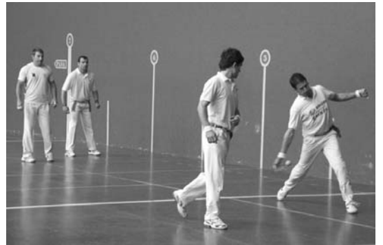
Seniorrek partida ona egin arren, ezin izan zuten garaipena eskuratu. TXEMA VALLES

Lehenengo larunbatean, horietako hiru bikoteek Michelingo kirol guneko pilotalekuan jokatu zuten eta kalitatezko partidak ikusi ahal izan zituzten bertara hurbildu ziren ikusleak.