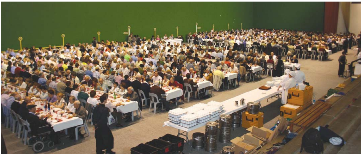
Igandean, urriaren 2an, Zahartzaroaren omenaldiako bazkarian 580 lagun izango dira. Ondoren, antolatu diren brindis eta dantzaldira ordea herriko pertsona adindu guztiak daude gonbidatuak.