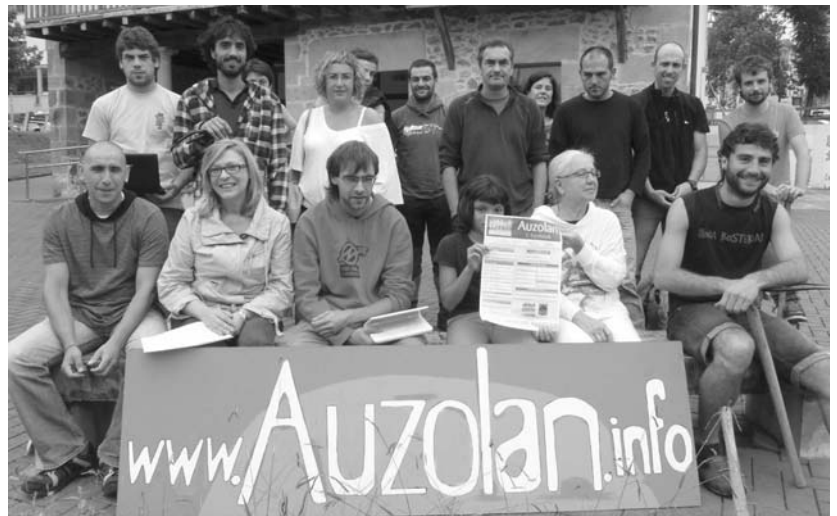
Auzolan ekimenaren bultzatzaile eta asteburuko topaketaren antolatzaileak aurkezpenean.

Urriaren 1ean larunbatean, goizez, 14 tailer ezberdin egingo dira besteak beste ura eta lurraldea, elikadura, kultura, energia, hezkuntza, etxebizitza, euskalgintza, herri festak, Hacktibismoa, hondakinak, osasuna eta des-hazkundera gaien inguruan. Arratsaldean aldiz biltzarra egingo da: Ekonomia alternatiboa eta tokiko