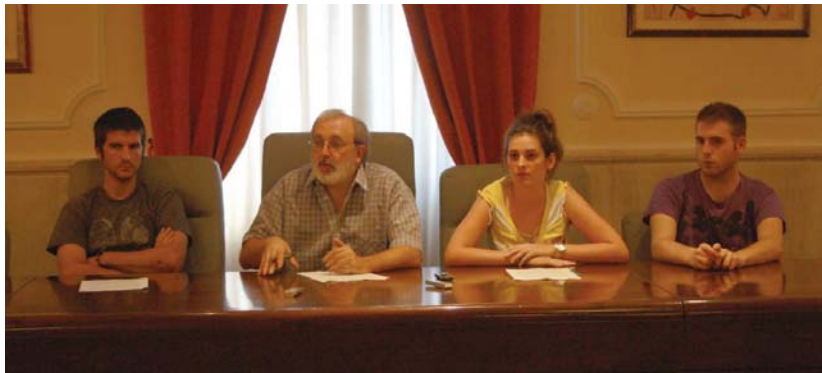
Bilduko korporazio kideek hiru hilabete hauetako azterketa egin eta aurkitu dituzten arazo ugari azaldu zituzten.

Bestetik, gauzak ahoz, irizpiderik gabe eta modu informalean egiteko ohitura zegoela ere jakinarazi zuen, “askotan ez dago ez araudirik, ez protokolorik gauzak egiteko prozedurak eta moduak zeintzuk izan behar diren azaltzeko”.