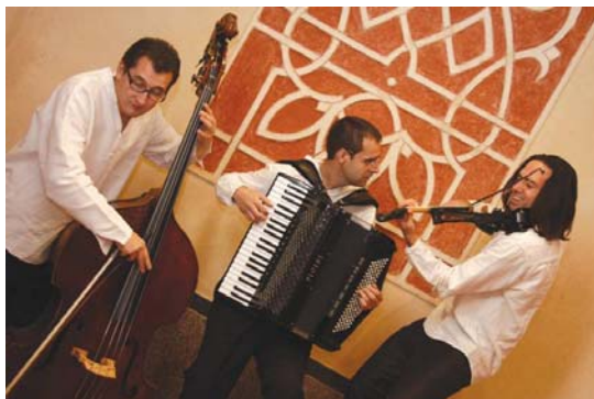
'Shtetl' judutarren giroa eta doinuak ekarriko dituzte Klezmatica Trio -k. L-O UDALA

Sarrerak 3 eurotan daude eskuragarri kultur etxeko sarreran. •