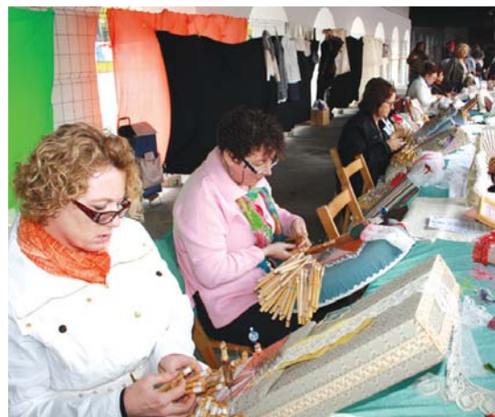
Hainbat postu arkupean jarri ziren. Irudian, herriko Ehozirizaleen taldea.