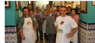
Semblante Andaluz elkarten afaldu zuten parodian parte hartu zutenek.