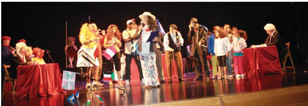
Turistei Lasarte-Oriako Udaletxe berria eta bere ezagarrri bereziak erakutsi zizkien gidari batek: barrutik hutsa dagoela, leihorik ez duela, kristal ilunak eta argi gorriak dituela...