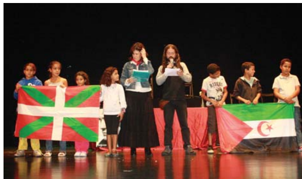
Udara pasatzera Sahararik etorri diren haurrak igo ziren parodia hasi aurretik eta kanpamenduetako egoera azaldu zuten.