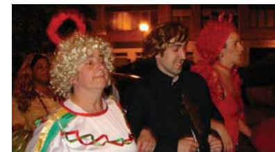
Kalejira egin zuten elkartetik Kultur Etxera. Irudian, aingeru, apaiza eta deabrua.