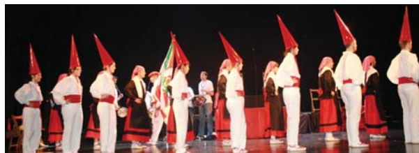
Santa Ana gaueko parodia Erketzen dantzatzatuko Sorgin Dantzarekin amaitu zen urtero bezala.