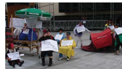
Egungo egoerarekin "haserretuek" kanpamentua jarri zuten Okendon.

Gidari turistikoa atera zen ondoren kanpotar talde bati Lasarte Oriako erakusteko asmoarekin. Kubatar, senegaldar, nikaraguar, saharar, asteasuar eta aiarra ziren turistaren artean. Udaletxe berria erakutsi ziren berak, estilo modernoko eraikinean Oteizaren eragina nabarmena dela aipatu, barrutik hutsa hutsa dagoelako, negu eta uda aire egokitua erabiliko dela, leihorik gabe egin dutela, leihorik gabe egin dutela inork bere buruz beste egin ez dezan, kristal ilunak dituela barnean koskabiloak nola ukitzen dituzten ikusi ez dadin,... eta gauean dituen argi gorrien misterioa eta udaltzainek gaueko bantand lan egin nahia ere argitzen saiatu ziren. "Bugaite ez dute itxi lekuz aldatu dute".