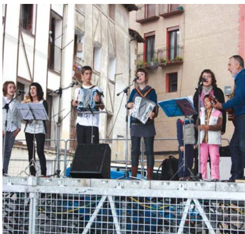
Eguraldi txarrari aurre eginez, giroa alaitu zuten Amalurrekoek.