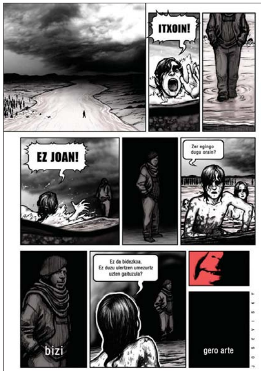
Laboaren omenezko komikia erakusketan ikusi daitekeen lanetako bat da.

Gainera, horrela erakustetari gai bat jartzeko aukera nuen. Erakusketan jarritako umore zintak marraztu baino lehen beste modu batetako komikiak marrazten nituela egia da, hortik erakusketaren izena: Umore zintak marrazten saiatu zen komikilaria .