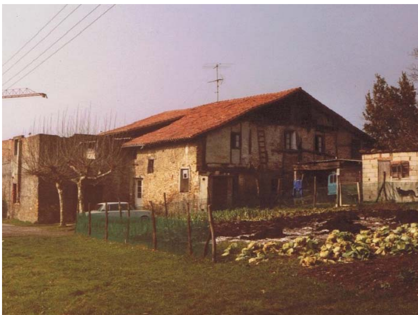
Urte ugari egon zen Goiegi Baserria dolare eta jangela erreak zituela. Garai horretako argazkia dugu hau, bertan baratza zegoela.