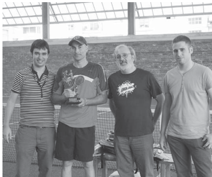
Nahiko erraz irabazi zuen Quintana azpeitiarrak finala.