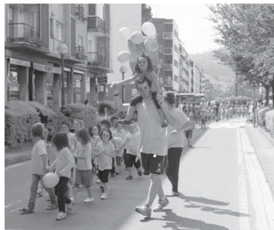
Desfileak zirko bereziak ostiralean Kulturetxean emanaldia eskainiko duela iragarri zuten.

Udako txokoetako arduradunek eskerrak eman nahi dizkiete udaltzainei desfilean zehar egindako lanagatik. •