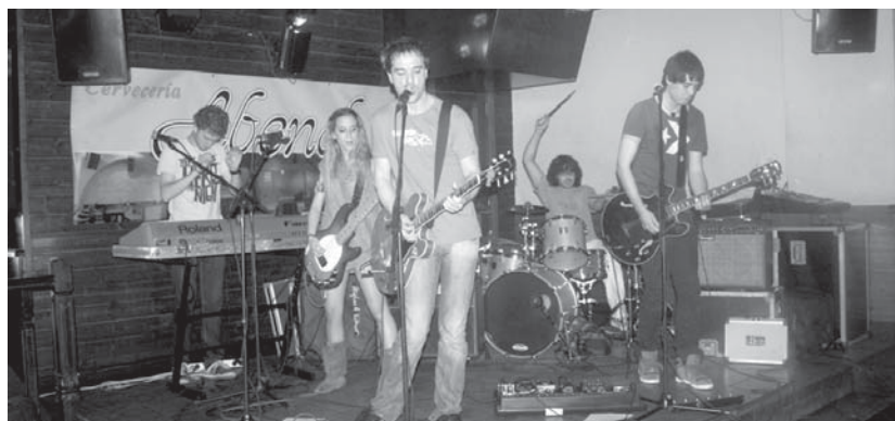
Abend kafe-antzokian Laurobak eta Peachy Joke taldeak jo zuten, irudian Laurobaren emanaldia.