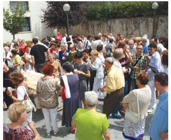
Meza ondoren lunch gozo bat dastatzeko aukera izan zuten bertaratutakoek.

Elizkizuna amaitzerakoan, trikitilariak auzotarren irteera girotu zuten. Eta ostean, lunch gozo bat dastatzeko aukera izan zuten hurbildu ziren guztiek. •