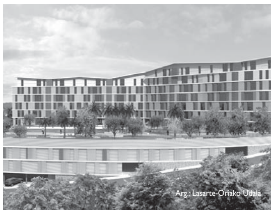
Arg.: Lasarte-Oriako Udala

Zerrenda hamabost egunez egongo da ikusgai herritarrek erreklamazioak jar ditzaten. Hau egiteko epea uztailearen 19an, hau da, bihar amaituko da. •