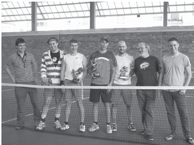
Irudian, antolatzaileak, jokalariek eta Udaleko ordezkariak sariak banatu ondoren.

Sariak banatu ondoren, parte-hartzaile guztien artean materiala zozketatu zuten (kamisetak, motxilak, fundak...). Antolatzaileak gustura daude izandako parte-hartzaileekin eta giroarekin. •