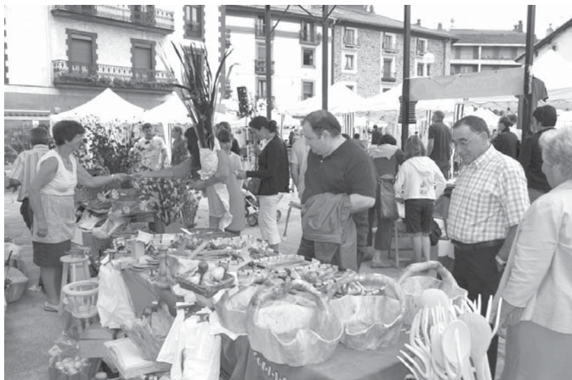
Aurten berriro egingo da Artisauen Santa Ana azoka Okendo plazan.

Eskulanetako 27 artisau inguru etorriko dira aurtengoa Lasarte-Oriara: oinetakoak, egurrezko apaingarriak, pitxiak, larruarekin egindako apaingarriak, poltsak, diruzorroak, beirarekin egindako