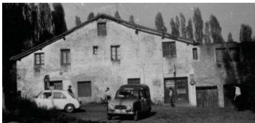
Goiegi baserria eraberritu baino lehen gaur egun duen itxurarekiko nahiko ezberdina zen. 1965.ean, sutearen ostean, erregabe geratu zen zatian jarri ziren, jangelak eta taberna. Eta 1986.ean egin zen berria.

Goiegi jatetxean hirugarren generazioa dago lanean "leku garrantzitsua da familiarentzat, bilgune bat" azaldu digute