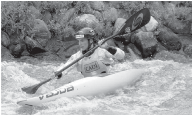
Maialen Chourraut gogor ari da lanean, 2012. urteko Londreseko joko olinpikoak ditu helburu.

Gainera, hirugarren sailkatuak, Kudejova txekiarrak finaleko jaitsieran 117,73 marka egin zuen. Baina palistak 18. atean akatsa egin eta epaileek 2 segundutako zigorra jarri zioten.