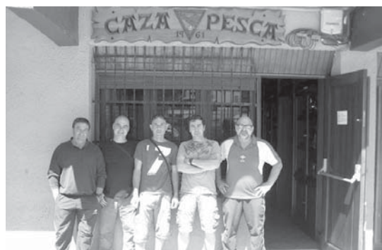
Arrantza txapelketetako sarituak elkarteko arduradunekin.