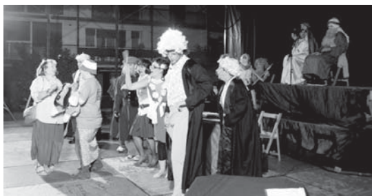
laz parodia musikala Isla plazan egin bazen ere, aurten Okendo plazara bueltatuko da.

Entseguak Manuel Lekuona kultur etxean izango dira uztailearen 18tik 22ra, 19:00etatik 21:00etara. •