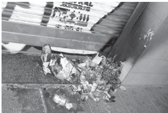
Argazkian ikus daitekeen bezala, elkarteko sarreran kalteak eragin zituen.

Era berean, lasarteoriatarrei adierazi nahi diete, "horrelako ekintzek ez dutela Xirimiriren lana oztopatuko eta herritarrekin herriaren alde lanean jarraituko dugula". •