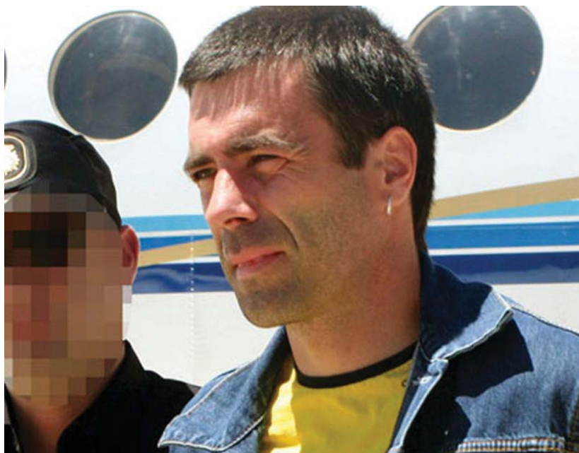
Martxoan eman zuten konfiantzazko medikuek larritasunaren berri, frogak egitea urjentea deritzote baina ez diote baimenik eman.