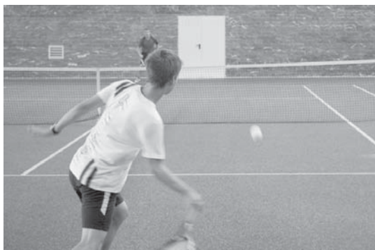
Ostiralean jokatuko da Lasarte-Oriako tenis txapelketako finala Kirol gunean.