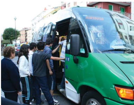
Hiribus martxan da Lasarte-Orian 2010eko udazkenetik.

Zabaleta auzoan garrantzia izan du beti erdigunera jaisteko eta erdigunetik igotzeko autobusaren gaiak eta iaz martxan jarri zenean, auzotarrek komentario ezberdin asko egin zituztela ikusita, auzo elkarteak pentsatu zuen interresgarria litzatekeela guztiei iritzi emateko aukera eskaintzea, gero Udaletxera alkateari iritzi guzti horiek elkarrekin eramateko. Beraz auzotarren iritzi hori jasotzeko asmoarekin galdeketa egin zuten martxoan, apirilean emaitzak aztertu eta maiatzean egindako azterketa eta ondorioak udalaren esku jarri zituzten.