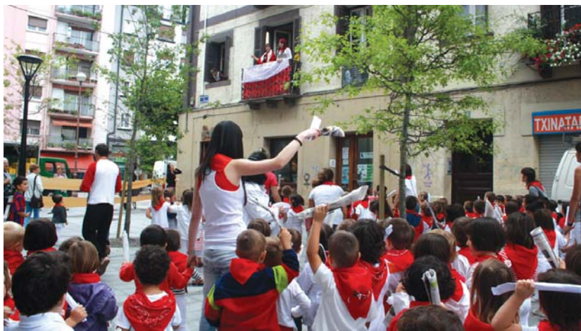
Okendo plazan egin zen entzierroa hasi baino lehen, Udako Txokoetako haurrek San Fermini abestu zioten.

Kirola egiteko parada ere bada txokoetan, eta ohiko kiroletaz gain berriak probatzeko aukera ere bai gainera. Aurtun, rokodromo berria eraiki denez, eskalada egiteko aukera ederra izan zuten gaztetxoek. Kontent ikusi genituen gora eta behera. •