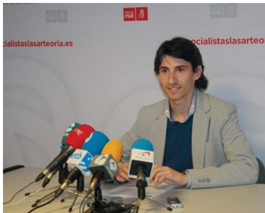
Zaballos herriko PSE-EEren bozeramaileak hurrengo egunean egin zuen salaketa.

eskultura egiteko eta inaugurazioan, alkateak herriko biktimei senideak ez zituela gonbidatu kritikatu zuen.