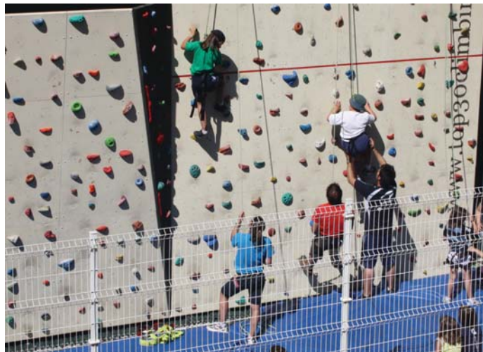
Ohiko kirolez gain beste kirol batzuk ere praktikatzen dituzte Udako txokoetan etxeko txikienek.