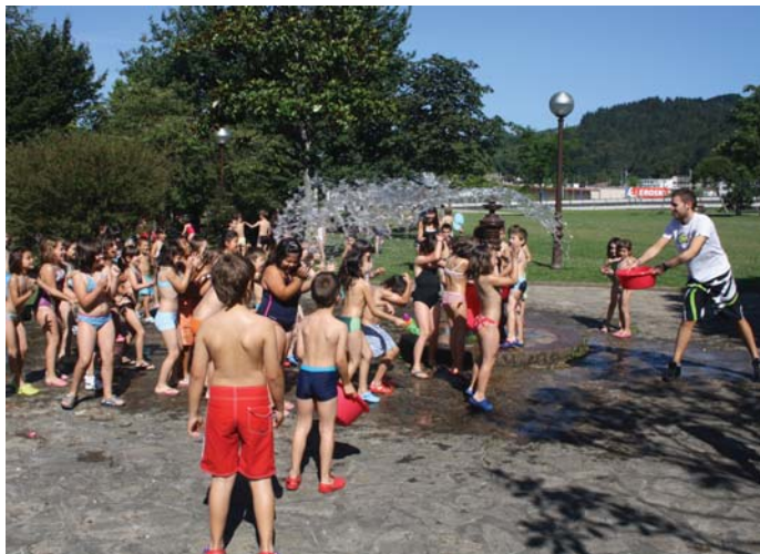
Atsobarreko parkean ur jolasetan aritu ziren ostiralean. Tenperatura altuei aurre egiteko modu ederra.