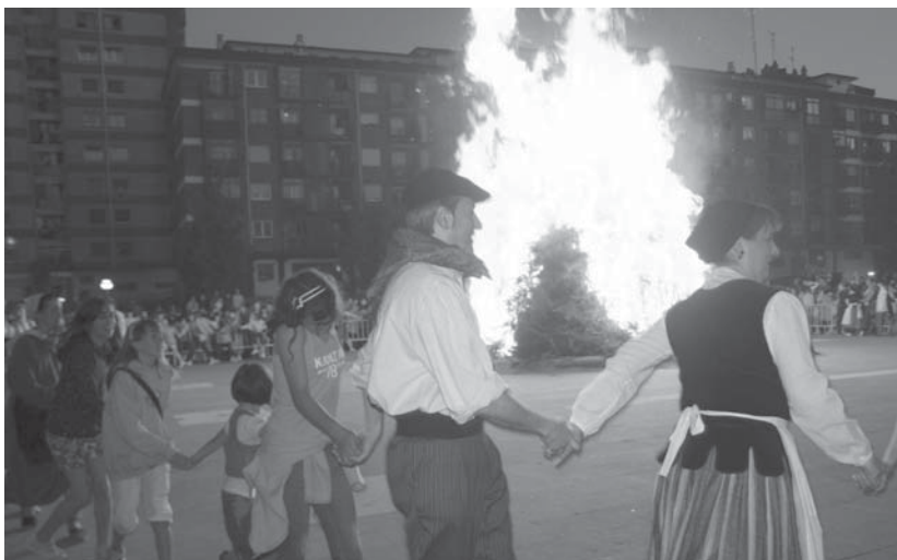
Oroitzapen txarrak erretzeko aukera izango dute herritarrek ostegunean Okendo plazan egingo den San Joan suan.