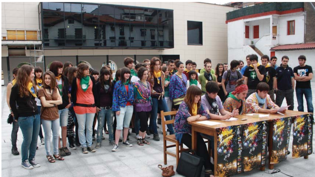
Herriko hainbat gaztek parte hartu zuen Sorgin Jaien aurkezpenean. Txupina Sorgin Dantzako kideek botako dutela eta aurtengo berrikuntzak ezagutarazi zituzten.

Sorgin Jai alternatiboak antolatzen dituzten herri-tarrek ostiral arratsaldean aurkeztu zuten Okendon aurtengo egitarau zabala. Alde batetik jaiari hasiera emango dien txupina Sorgin Dantzako kideek botako dutela jakinarazi zuten, eta bestetik egitarauan aurten izango diren berrikuntzen berri eman zuten, besteak beste antzerki eta dantza emaldiak, kamioi rocka, eskalada eta bakailao txapelketak, koadrilen arteko bazkari autogestionatua eta jai alternatiboak antolatzen hasi zirenetik hamargarren urteurrena ospatzeko ezusteko betetako afari berezia.