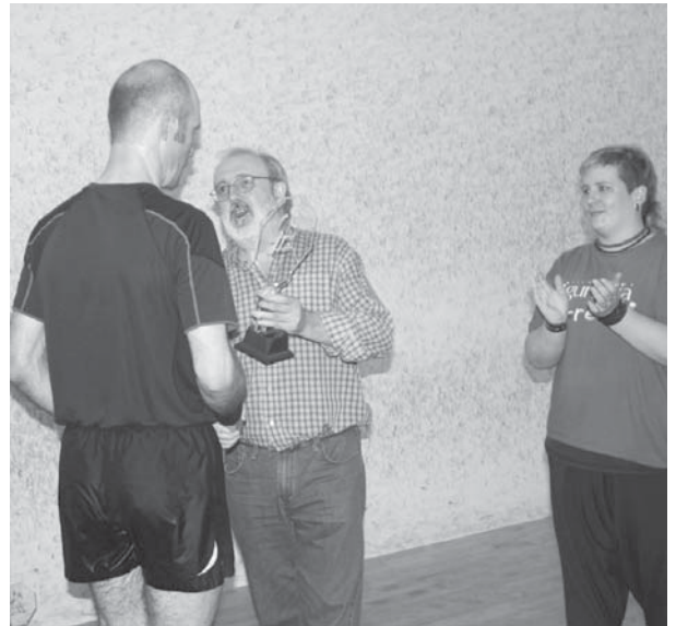
Finala oso borrokatua eta bizia izan zen, tanto luzeak eta set batzuetan oso berdinduak ibili ziren Udabe eta Erkizia.