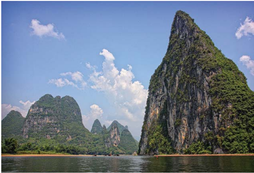
Junan inguruan, Guilin eta Yangshouko mendi ikusgarriak dira Txinan ikusi duen toki gomendagarrietako batzuek. Txinako mugen barruan dagoen Mongoliako parte ere ederra dela dio.