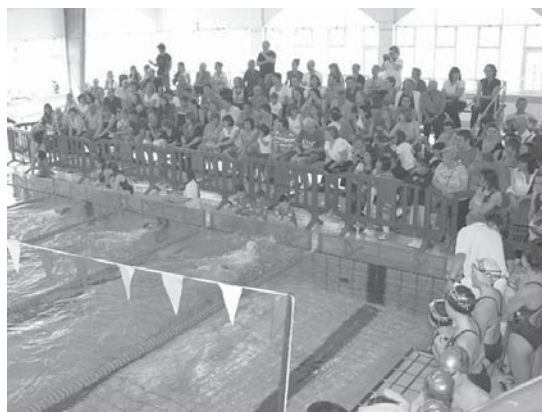
Jende ugari hurbildu zen larunbata goizean igerilekura txapelketa ikustera.

Lasarte-Oriako gazteak bigarren postua eskuratu zuten uztai lanean eta era berean, hirugarren geratu zen sokarekin egin zuten lanari esker. •