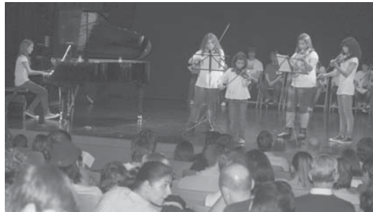
Pasa den urtean Musika Eskolako ikasleek eskainitako kontzertua.

turte honetan maila gainditu duten ikasleei dagokien Diploma banatuko zaie eta ondoren, eskolako talde desberdinen eta pianojoleen txanda iritsiko da.