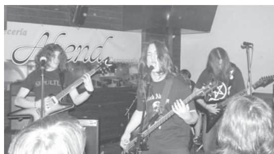
Hilotzek Abend-en IX.Multimusikalaren barruan eman zuten kontzertuan.

Interesa duenak 637 250373 telefono zenbakira deitu dezala eta Mikeletaz galdetu. Autobuserako txartela 30 euroko prezioa izango du. Hilotz taldeetik jendea animatu eta eurekin Zaragozara joateko gonbitea luzatu nahi deitu. •