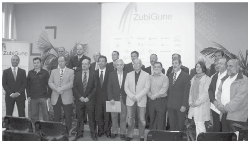
Zubigune fundazioa sortu duten enpresa, erakunde eta Usurbilgo Lanbide Eskola ordezkariak aurkezpen ekitaldian.