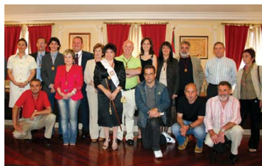
Duela lau urte, 2007-2011 legealdiko udal batzarra eratu zuten zinegotziak.

Maiatzaren 22ko hauteskundeen emaitzek gure herriko mapa politikoa aldatu zuten. PSE-EEK 7 zinegotzi lortu zituen, Bilduk 5 ordezkari, EAJ eta LOHPak bina zinegotzi bakoitzak eta PPK bat. Beraz, gutzia herriko