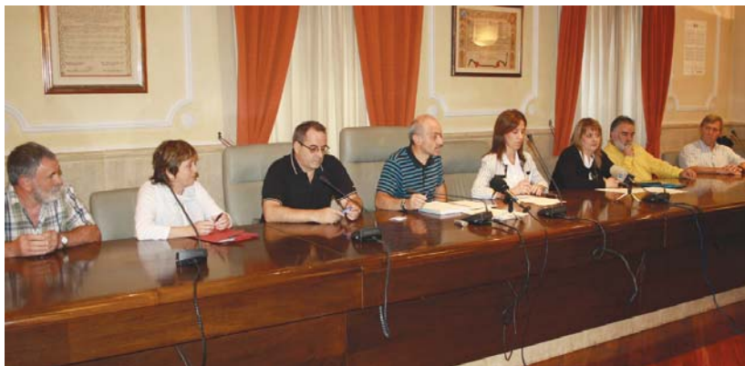
Oposizioiko alderdiek, PPK izan ezik, udalbatzarra amaitzean gertatutakoari buruzko adierazpenak egin zituzten.

Ezker abertzaleak ondorioen txostenean guztien iritzirik ez dagoela salatu zuen eta beraz, idazkariak aurkeztutako idatzia "partziala eta eskasa" zela adierazi zuten.