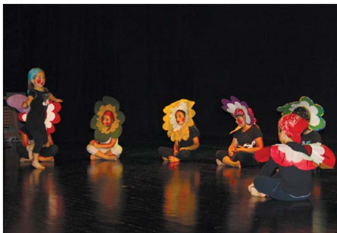
Sasoeta ikastetxeko txikiak Goazen jolastera lana eskaini zuten astelenean.