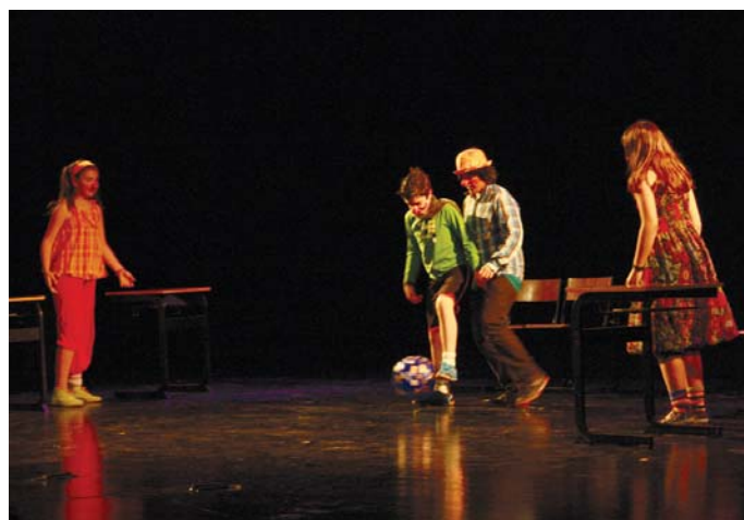
Amassorrain ikastolako gazteek lehenegoa haien lana eskaini zuten kultur etxeko aretoan.

Bigarren saioan, Solaskideko taldeak Andrearen urtea lana antzeztuko du eta Jalgune elkarteak gazteek 20 urte hamaika bertute eskainiko dute. •