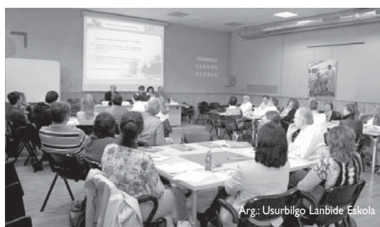
Arg.: Usurbilgo Lanbide Eskola

Era berean, denbora tarte horretan udal igerilekua publikoarentzat itxita egongo da. •