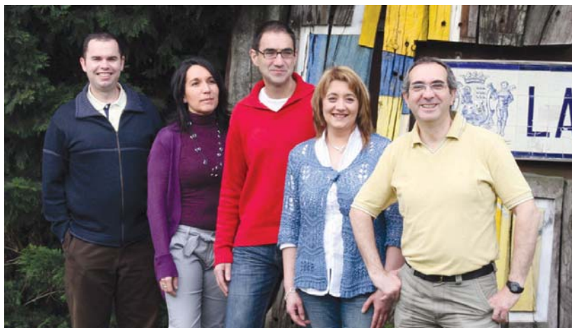
PSE-EErekin izandako bileran zintzotasuna eta erantzukizuna eskatu zizkiola soilik adierazi du LOHPk.

Honen aurrean LOHPk argi utzi nahi izan du "Lasarte-Oriako alkate izan nahi duena ez