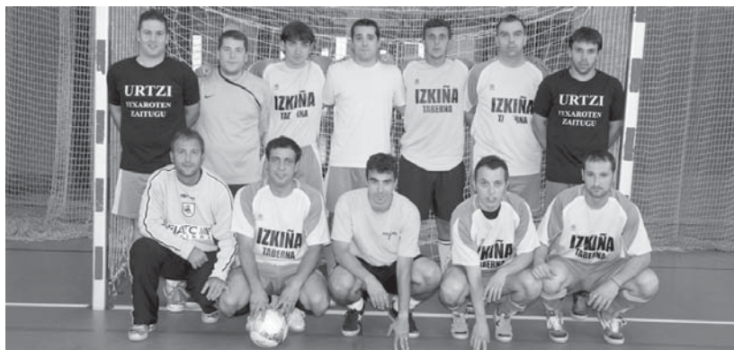
Izkiña taldeko jokalariek Buruntzaldeko lehen areto futboleko lehiaketan txapeldun izan dira.

18:00etatik aurrea, LOKEko atletik parte hartze mugagabeko probak dituzte, Anoetako miniestadioan, Donostian.