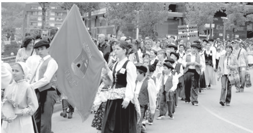
Desfile polita eta koloretsua bizi zen aurreko urtean. Goizean ateri mantendu bazen, arratsaldean Mlchelinin ospatu zen ekitaldia.