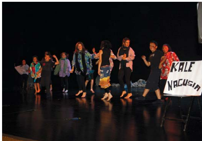
Landaberriko Eskale musikariek herriko Kale Nagusia alaitu zuten haien dantza eta kantuekin.