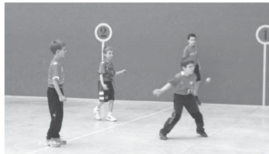
San Pedroetako lehiaketako gaztetxoek, zein helduek gogotsu ematen diote pilotari.

Horiek guztiak, maiatzaz geroztik, mailako desberdinetako partidak jokatu dituzte