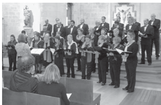
Legazpiko Santikutz abesbatzaren bisita izango du Albokak bihar arratsaldean.

Legazpiko abesbatzak lehenengo zatian Purcell, Mozart eta Vivaldi musikari handien doinu sakroak entzungo dira eta bigarrenengan, berriz, euskal eta nazioarteko abestiak