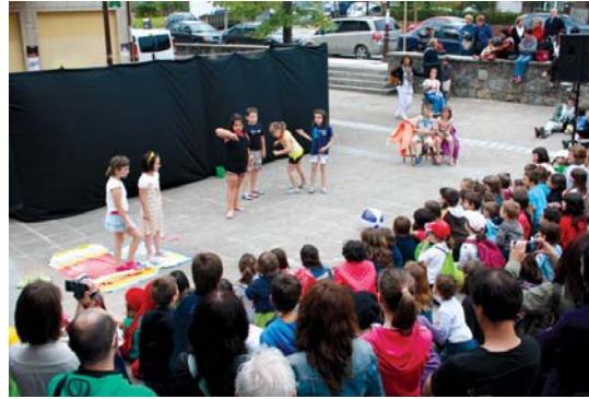
Landaberriko LHko gaztetxoek antzerki lan desberdinak eskaini zituzten atzo.

Honetaz gain, 22:00etan, Kukuka antzerki eta dantza eskolakoek dantza garaikideko emanaldia eskainiko dute eta jarraian, Xumela abesbatzako kideek euren ahotsez disfrutatzeko aukera eskainiko dute.