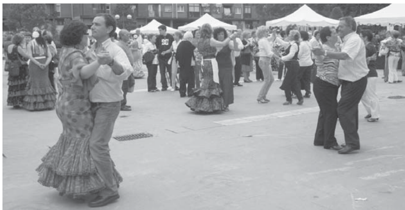
Ederki dantzatu zuten erromerian izan ziren herritar eta gonbidatuek iaz Andatza plazan. Aurten, Atsobakarreko parkean izango da.