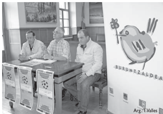
Lasarte-Oriako, Usurbilgo eta Andoingo kirol zerbitzuetako ordezkariek aurkezpenean.

Astearteko prentsaurrekoan azaldu zuten, Lasarte-Oria, Usurbil, Urnieta eta