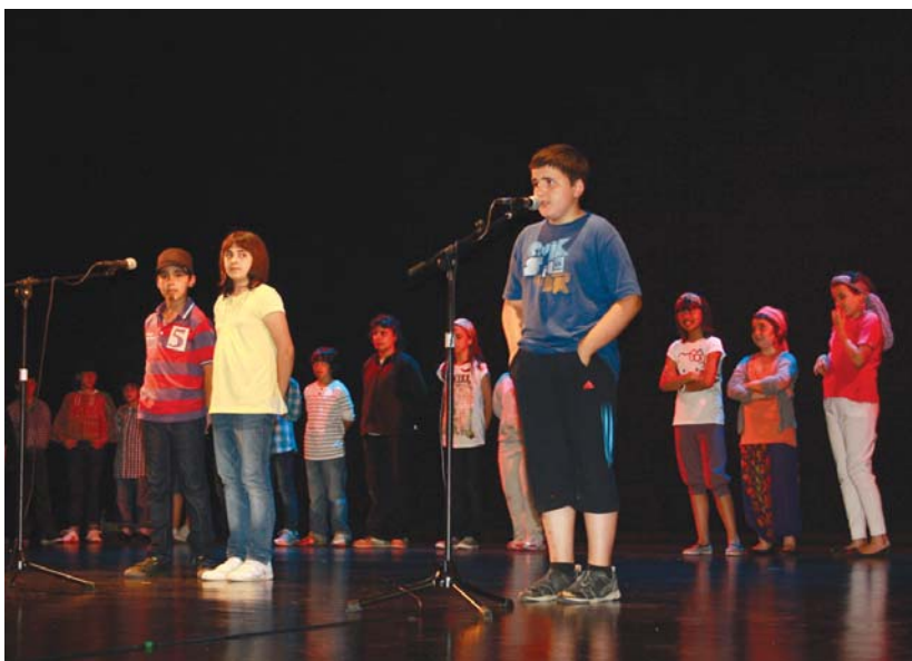
200 haur inguruk kantatu zuten astelehenean Kultur Etxean Ahozkotasunaren jaialdian.