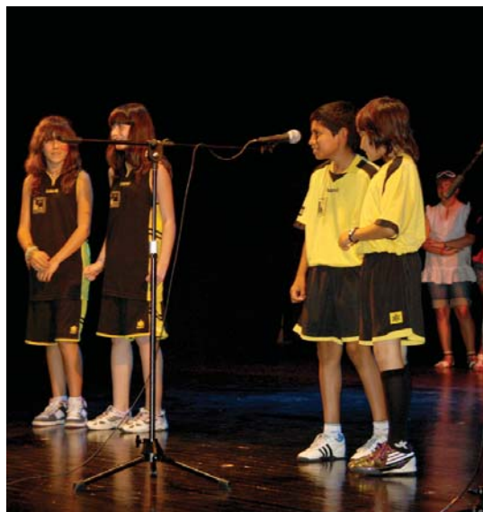
Landaberi eta Sasoeta ikastetxeetako neska mutilek umore onez kantatu zituzten aurretik eskolan prestatutako bertsoak. Gehienak mozorrotuta atera ziren oholntza gainera eta kultur etxean izan zirenek ondo pasa zuten.