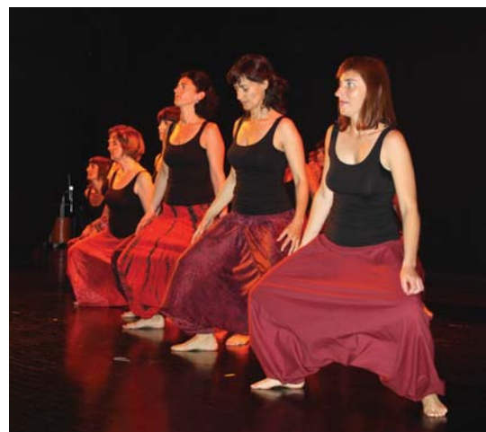
Igande arratsaldeko dantza garaikide saioa ikusteko toperaino bete zen Kultur Etxea.

Bestalde, aurreko aste gutxian bezala igandean ere bi saio eskaini ziren kultur etxean. Dantza garaikide emanaldi horiekin parentesi edo eten bat ireki du Antzerki Asteak: ekainaren 6tik 12ra jarraituko du egunero bi emanaldirekin, bat goizez ikasleentzat eta bestea arratsaldean nahi duten guzientzat. •