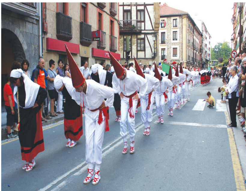
Aurten Sorgin dantzako doinu eta dantzek San Pedro egunean alaitu eta beteko dituzte Lasarte-Oriako kaleak.

Taldea osatzeko, Udalak adin horretako herriko gaztetxo guztiei ohar bat bidaliko die eta haurren zortzikotean parte hartu nahi dutenak kulturetxeko Gazte informazio bulegoan, hirugarren solairuan eman beharko dute izena. •