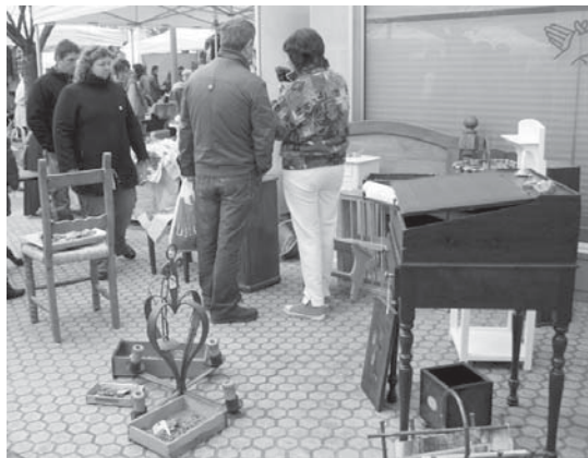
Aste Berdea 2011 bigarren eskuko objektuen azokarekin hasiko da, ekainaren 4an.

Egoera onean dagoen edo zer gauza saldu, trukatu edo oparitzeko aukera egongo da bigarren eskuko merkatu honetan. Liburuak, jostailuak, mahai-jolasak, arropa, dekorazioa, bizikletak, kirol-tresneria, haurtxoentzat gauzak,