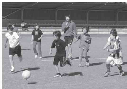
Hainbat kirol egiteko aukera izan zuten neska mutilak Eskola Kirolaren ospakizunean.