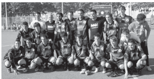
Ostadarreko jokalariek pozik partiduaren amaieran Mutrikuri 5-1 irabazita gero.

Gipuzkoako Gorengo ligaxka honetan bi lehenengoak ohorezko mailara igoko dira eta hirugarrena, Ostadar alegia, beste emaitza batzuen zain dago. Igo egingo da mailaz hirugarren mailan diren Gipuzkoako talderen batzuek bigarren B mailara igotzen baldin badira, eta hori ez da gutxi gorabehera sanpedroak