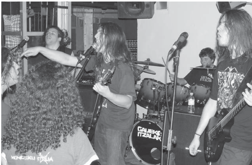
Saria eskuratu eta gero, maiatzaren 6an lehengo "Zuloan" jo zuten "Gaueko Itzalak" taldearen disko aurkezpenean.

Duela bi larunbat Donostiako Guardetxean jo zuten, Euskal Metal Fest kontzertuan, Donostia aldeko bi tal-