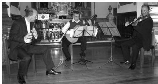
Diru laguntzen araudi orokorra onartu ostean, arlo bakoitzak berea egin beharko du.

Alkateak Andre Joakinari dagokionez, Udala Partzuer-