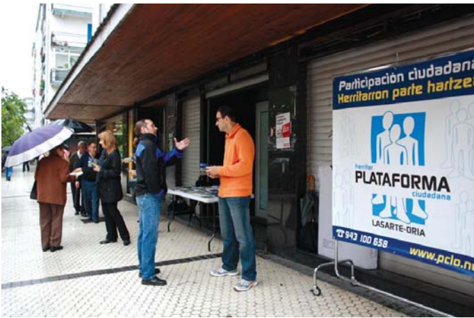
Herritar Plataformako kideak Kale Nagusian egon ziren herritarrei programa azaltzen.