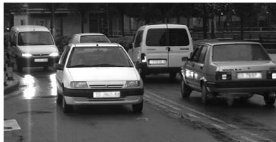
Udalaren zerga eta tasa bilketa ona izan da Lasarte-Oriako 2006-2010 urteen artean.

Hau guztiaz gain, bide exekutibora bideratzen diren ordainketa eta berreskuratzen diren kopuruen ehunekoak ere eskaini ditu Udalak.