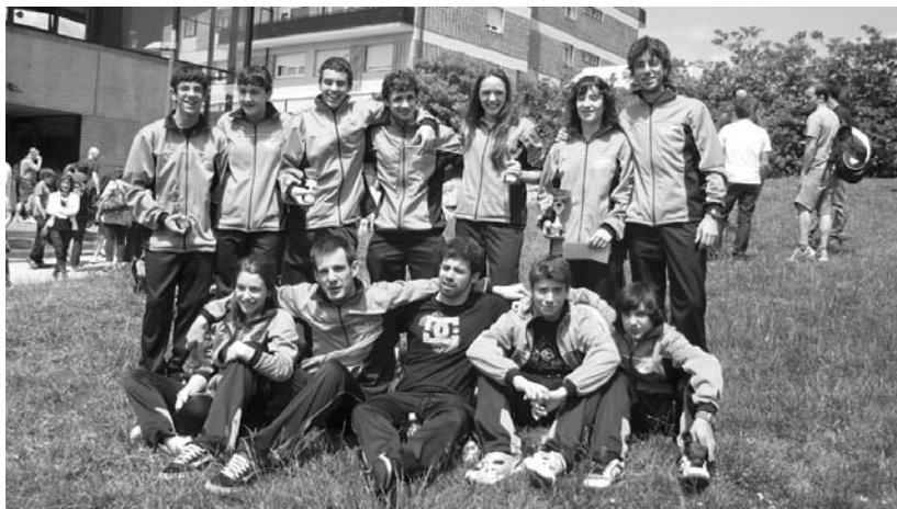
Buruntzaldea IKT-ko kideak eta entrenatzaileak Sopelako txapelketan lortutako sariekin.

“Taldekide guztiak bikain aritu ziren,” azaldu digu entrenatzaileak.