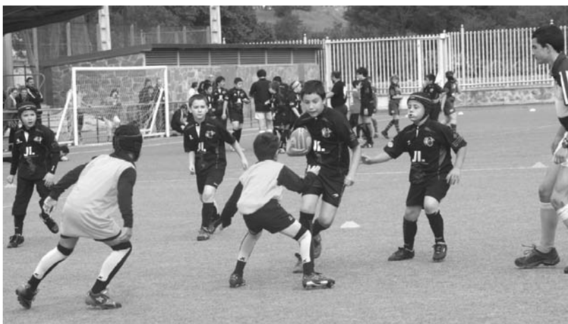
Trebetasun handiz jokatu zuten Errugby eskola desberdinetako gazte txokak. Argazkian, Beltzak Ostadar Jalai taldeko benjaminak lehian.

Eta 50 m. libre proban, berriz, haien marka hobetu zuten