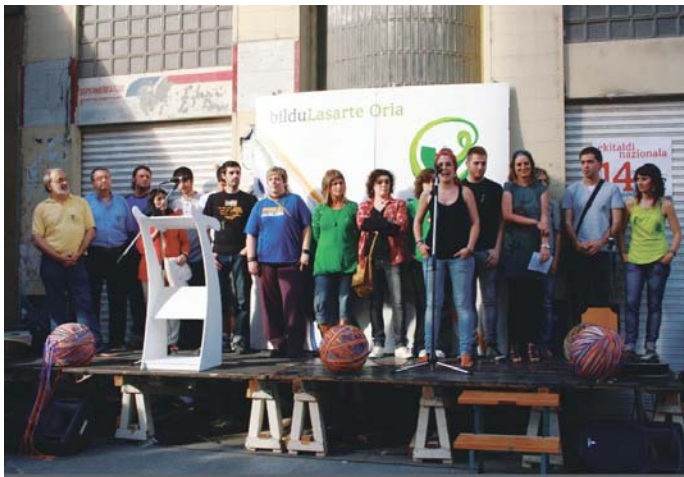
Bilduk ostiralean dantza, musika eta hitza batzen zituen ekitaldia egin zuen Sagardotegi kalean.