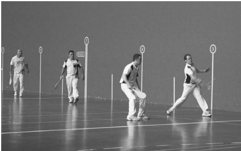
Partida luzea, ordu eta erdi baino gehiagokoa izan zen aurtengo Gomazko pilotako pala txapelketako finala,