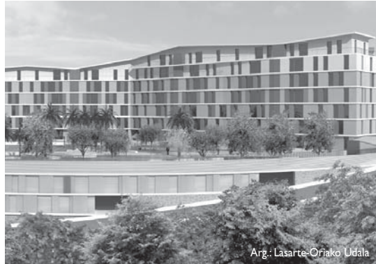
Adarra kalean, Loidi-Barren eremuan, babes ofizialeko 100 etxebizitza zozketatuko dira.

Adarra kalean, Loidi Barren eremuan zozketatuko diren 100 etxebizitza babestuak lurrazaleko eskubidearen erregimenean adjudikatuko zozketaren deialdiko baldintzak eta prozedura onetsi zen.