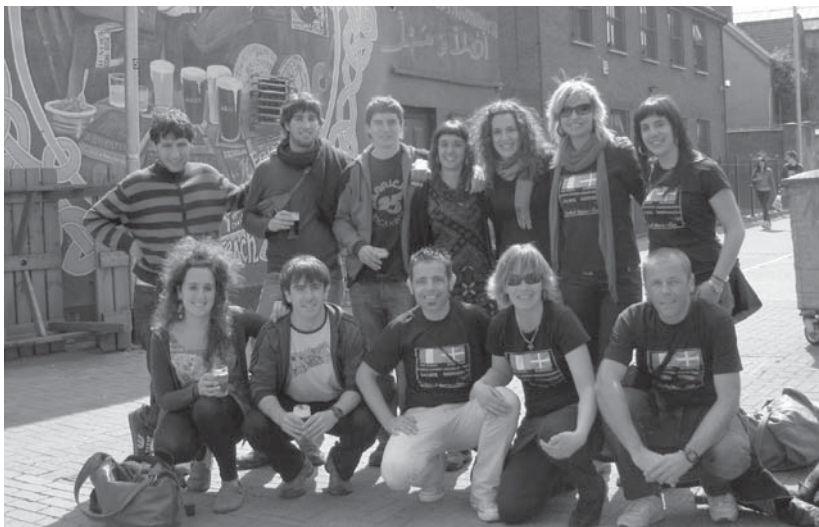
Bertso Dinner-era joan eta tabernaz taberna ibili ziren Belfasten. Irudian, 12 herritarrek Maddens pub-eko atarian.