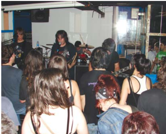
Herritarren aurrean aurkeztu zuten diskoa eta abestiak ostiral gauean.