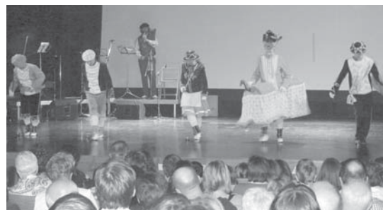
Erketz taldeko dantzariak Godale dantza eskaini zuten.