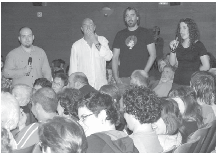
Jaialdi amaieran oholatzatik jetsi eta publikoarengana jo zuten eurei eskainiz azken bertsoak.