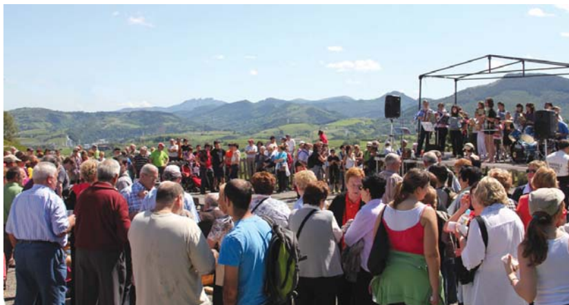
Urtero legez, herritar ugari bildu ziren atzo Azkorten antolatutako erromerian. Giro oso polita egon zen.