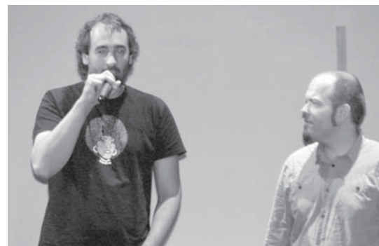
Jaialdiaren aurkezpena eta gero, Muñoa eta Estiballesen desafioa izan zen.

Ttakunek eta Bertso Eskolak berriro ere bertsoak beste kultur diziplinekin nahastuz, jaialdi polita eskaini zuten. •