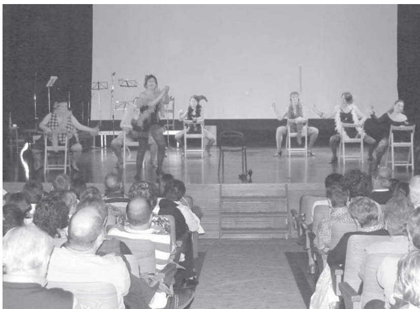
Barre algara handiak sortarazi zituzten Kukula Antzerki taldeko kide hauek eskaini zuten kabaret dantzarekin.