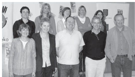
Udal ordezkariak eta euskara teknikariak autoeskoletako arduradunekin.

"Buruntzaldeko herritarrei jakinarazi nahi diegu gidabaimena euskaraz ateratzeko daukaten aukera, batez ere, aurten 18 urte betetzen dituzten gazteei. Horretarako, gutuna eta diptikoa iritsarazi