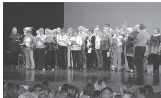
Xumela abesbatzak Euskara oi euskara abestia eskaini zuten.