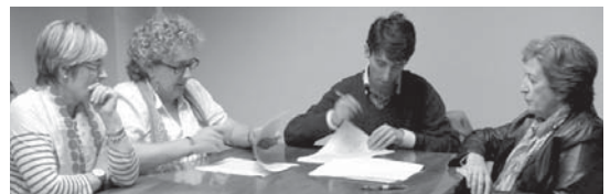
Aterpeko ordezkariak, alkatea eta Zubiri merkataritzako batzordeburua sinaketan.

Gauzak honela, komertzioa dinamizatu eta herriaren bizikaltatea eta erakargarritasuna sustatuko duten negozio aukerak sortzeko, hainbat proiektu eta ekintza eramango dituzte aurrera bi erakundeek, esaterako Stock eta Saldoen azoka. •