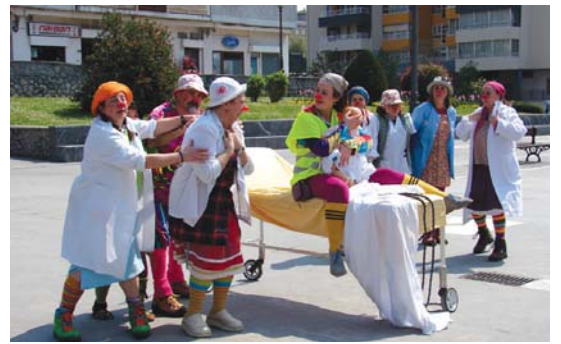
Kukukako clownek azkenean alta eman zioten gaixoari.