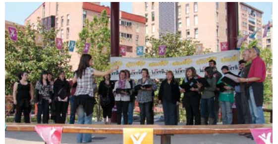
Alboka abesbatzak emanaldi polita eskaini zuten bazkaldu aurretik.