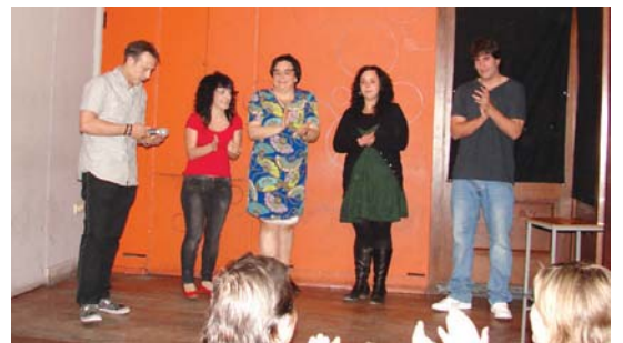
Barre algarra ederrak egin zituzten Jalgin bakarriketak entzutera joandakoek.