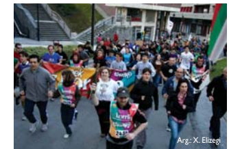
Erketekin batera errotondari buelta eta Errekalderuntz!