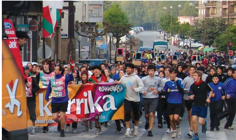
Goizeko 7etarako jende ugari ikusi zen kalean Korrika noiz helduko zain. Aurten ere Lasarte-Oriako herriak parte hartze zabalza izan du Korrikan!