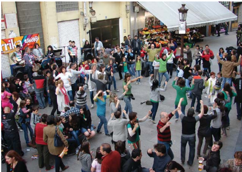
Erromeria Sagardotegi plazan egin zen eta, eguraldia lagun, izugarritzko giroa egon zen bertan.