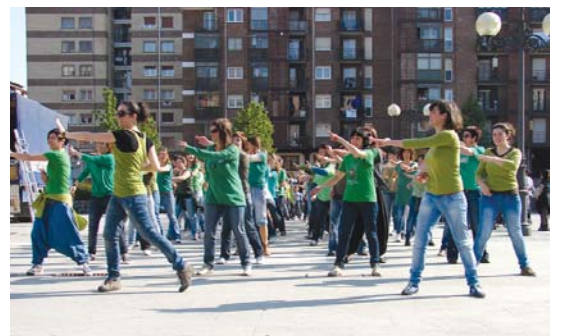
Kukukako dantzariek sasoiko daudela erakutsi zuten.