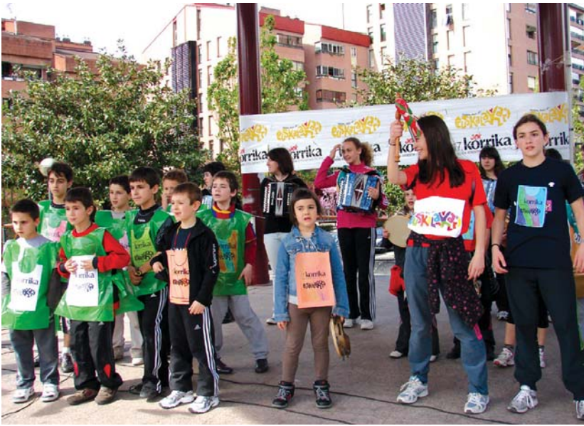
Korrika Txikiko lekukoa eraman zuten ikastetxeetako haur eta gaztetxoak Andatza plazako kioskora igo ziren.