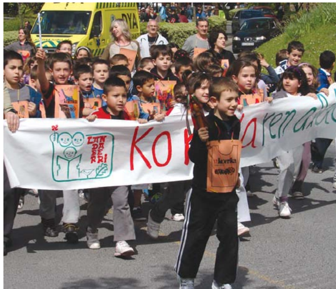
Ederki egin zuten korrika herriko ikastetxeetako gaztetxoek herriko kaleetan barrena.