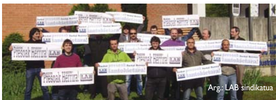
Arg.: LAB sindikatua

Bide batez langile guztiak animatu nahi dituzte presoen eskubideen aldeko ekimen guztietan parte hartzea. •