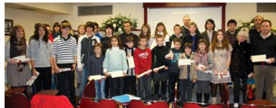
lazio Literatura lehiaketan parte hartu eta sarituak izan ziren gazte eta helduak.

Lanak, 2011ko maiatzaren 13ko eguerdiko 13:00ak baino lehen eraman beharko dira