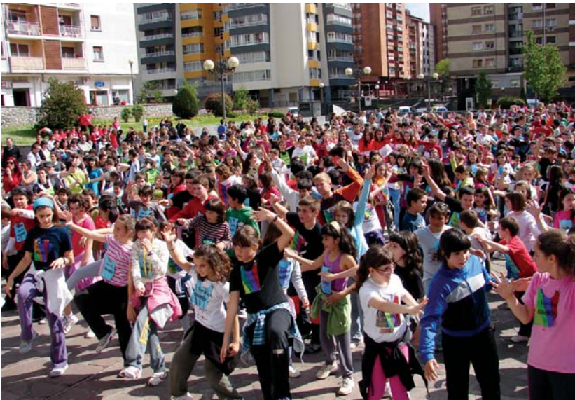
Herriko ikastetxeetako haurrek Korrikako eta erraustegiaren aurkako flash mobak ederki dantzatu zituzten.