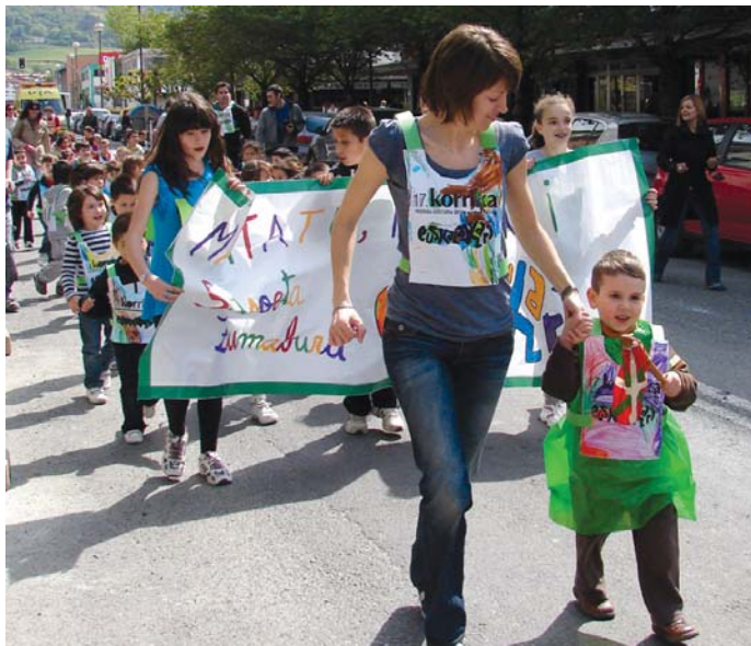
Sasoeta-Zumaburu ikastetxeko txikienek eman zioten hasiera Korrika Txikiari.