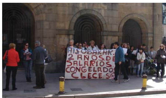
Aste honetan, asteazkenean, udaletxearen parean kontzentratu ziren langileak.

Lasarte-Oriako 2011ko literatur lehiaketa martxan