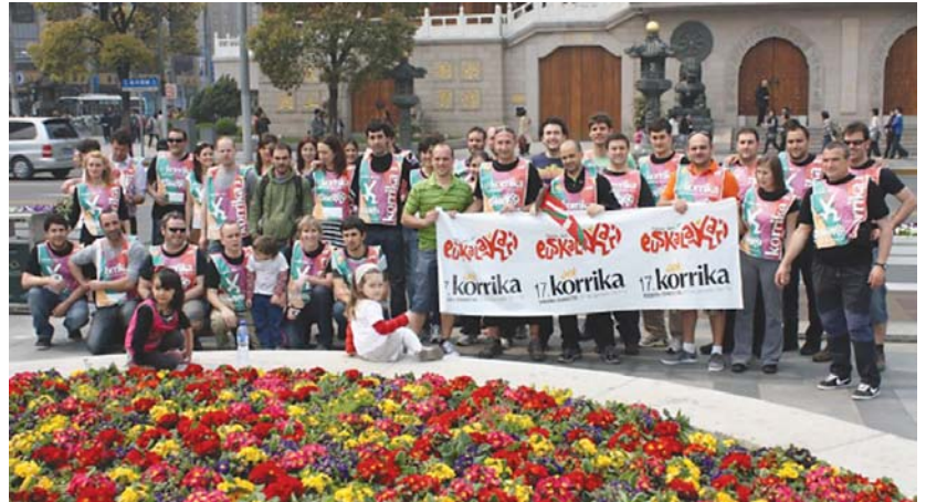
Korrikaren parte hartu zuten Euskal Etxeko kideek Jinqiao Temple aurrean aterata zuten argazkia.

Goizean goiz, hasi ziren ekintzak. Izan ere, Euskal Etxeko kide batzuk Jinqiao kros herrikoian parte hartu zuten. Eta euskal etxeko blog-ean diotenez, zortzi kilome-