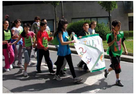
Sasoeta-Zumaburu ikastetxeko gaztetxo batzuk ia ibilbide osoa egin zuten.