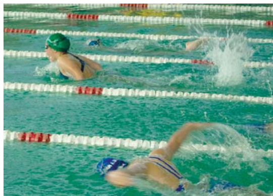
Tximeleta proban bikain aritu ziren taldeko igerilari gazteak.

Honetan gain, igerilarieei biomekanikaren inguruan hitzaldiak eman eta tratamendu indibidualetan Activación Muscular Training -ek prezio bereziak egingo dizkie.