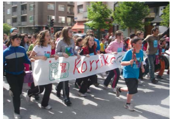
Landaberri ikastolako txikiak lekuko bana izan zuten. Gazteek, berriz, indar guztiak jarri zituzten korrika egin eta era berean abesteko.