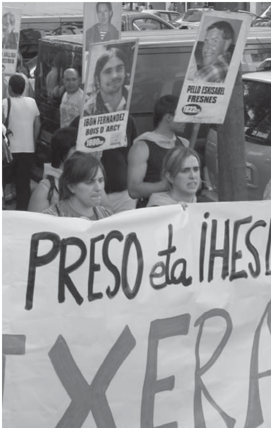
Eskisabelek sei urte eman ditu Parisen preso. Asteartean 17 urteko zigorra ezarri zioten.

Pellok, asteartean, epaiketako azken egunean hainbat adierazpen egin zituen epailearen aurrean: "Espainiak eta Frantziak nahi badute estatu demokratiko gisa ezagutuak izateko, bederen euskal jendartearen aldetik, badakite zer egin. Bazter dezatela errepresio estrategia, onar ditzatela Euskal Herria nazio gisa, bere lurraldetasuna eta etorkizuna askatasunez erabakitzeko euskal herritarrei dagokien eskubidea. Historiaren haizeak horren alde ufa egiten du, eta berandu baino lehen, gizon eta emakume askez osatutako Euskal Estatu Independentea nazio askez osatutako nazioarteko komunitatearen parte izango da".