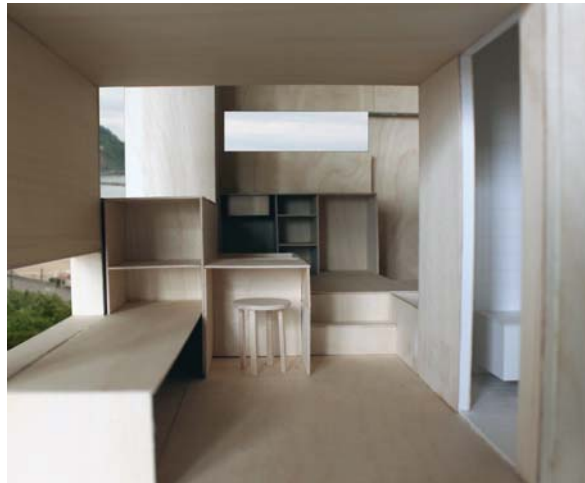
15m 2 ko etxebizitza txiki hau izango luke. Sukaldea, komunak, egongela, ohea... ez zaio detallarik falta.

Eta hortik neurri hauek? 15m 2 ko etxebizitza bat neurri minimoekin egina bada ere, eroso da. Sukaldea, komunak, logela eta erlazatzeko tokia du. Lekua ondo aprobetxatu behar da eta horretarako altuerekin jokatu nuen. Bolumenari esker, espazio irekia lortu ditut eta gauzak gordetzeko leku askorekin. Eserlekuak adibidez, gauzak