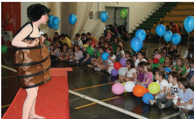
Giro bikaina izan zen larunbatean egun osoan Michelingo frontoian egin zen Amaraun jaialdian.