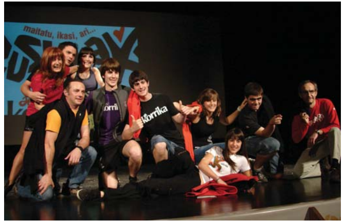
Dotore eraman eta erakutsi zituzten korrikarako prestatu dituzten arropak.