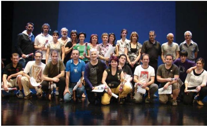
Korrikan parte hartuko dutenek euren kilometroa egiteko petoak eta zenbakiak jaso zituzten ostiralean.