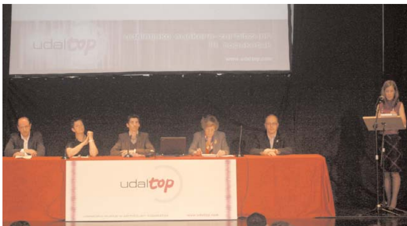
Euskara zerbitzuen III. edizio hau antolatzen duten erakundeen ordezkariak eman zituzten hasiera topaketari.

Gaur amaitzen den edizio honetan berrikuntzak egon dira. Batetik erakusketa eta bestetik azoka izan dira. Erakusketan, hainbat udalei bere esperientziaren berri emateko aukera eman zaie. Azokan, enpresa, elkarte eta erakundeek haien zerbitzuak saltzeko aukera dute. •