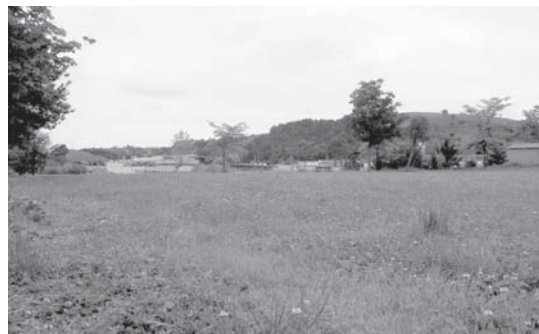
Ez da Atsokabarreko eremuan konpostarako plantarik ezarriko.

"aurkeztutako helegitearen helburua da lasarteoriatarren interesak defendatzea, eta horrela lortu dugu, beraz, oso pozik gaude bere momentuan hartzea erabaki genuen neurriengatik". •