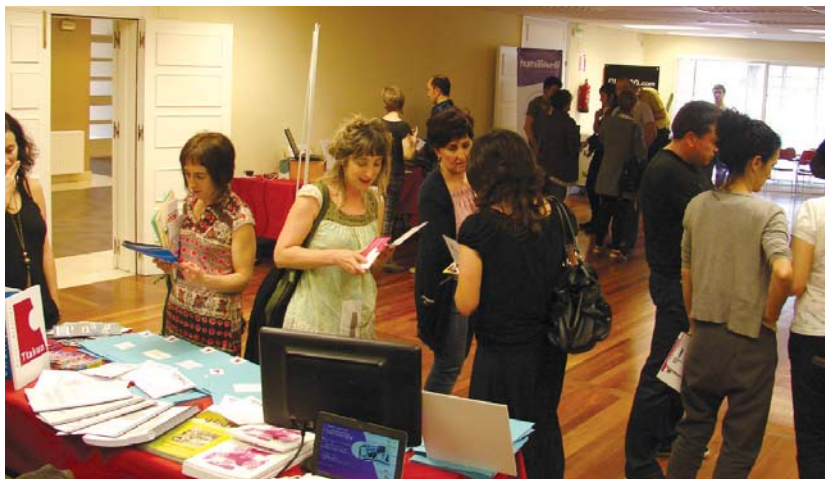
Aurten, gainera, enpresa, elkarte eta erakunde desberdinek euskara sustatzekodituzten haien zerbitzuak eskaini zituzten azokan.