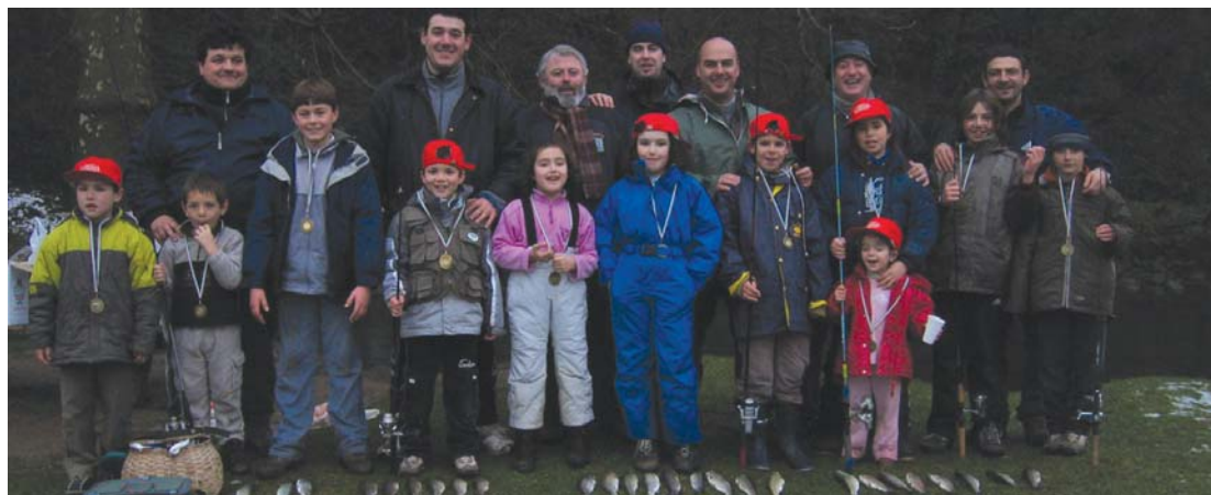
Buruntz-Azpi elkarteak hainbat txapelketa eta erakustaldi antolatu ditu 50 urte hauetan. Argazkian, 2005eko haurren arrantza txapelketa.

Eta aipatu dutenez, zerbait bereziki antolatuko dute ehiza eta arrantza sailekin udariari begira.