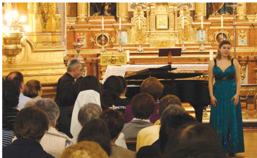
Francisco Escudero kontserbatorioko kantu ikasleek bakarka, binaka eta hirukotea eskaini zituzten egile ezagunen lanak.