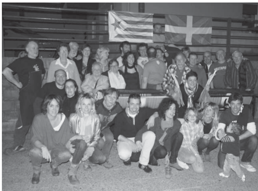
Urtero bezala Buruntz-Azpi antolatutako Calçot jana ostean taldeko argazkia atera zuten bertan bildutakoak.

Bazkalostean giro bikaina izan zen, trikitixa eta txalaparta doinu eta umore onarekin luze jo zuen Calçot jana hirugarren edizio honek. •