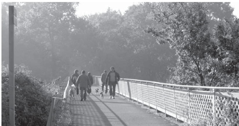
Plazaolako trenaren bidean zehar dauden zuhaitzak aztertuko dituzte, besteak beste, Oinatz taldeko lagunek, hurrengo igande.