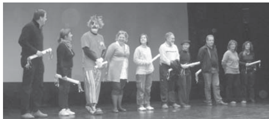
Kilometroren bat erosi dutenek aurkezpenean petoak emango dizkiete.

Korrikaren inguruko informazioa emateko, apirilaren 8an aurkezpena egingo da kulturetxean 20:00etan. Talde ugari