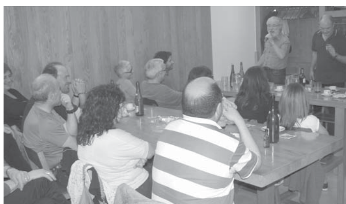
60 lagun inguru bildu ziren bertso-saioan, eta guztiak ederki gozatu zuten bertsolaritzaren bi maisu handi hauekin. Bi bertsolarien arteko ika-mikak barreak eragin zituen saioan zehar.

Txintzarri diruz laguntzen duten erakundeak