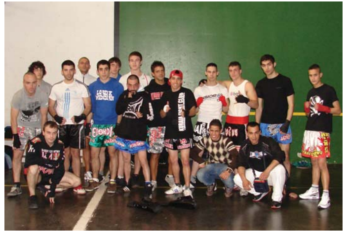
Elkarren aurka borrokatu arren, euren arteko harreman ona erakutsi zuten parte hartzaile guztiak.