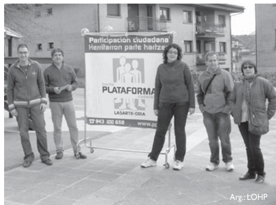
LOHPko partehartze karpa Zabaleta auzoko plazan egon zen martxoaren 19an.

Duela hamabost egun Zabaletako Antonio Blas plazan egon ziren eta herritarrekin hurrengo hitzordua, Andatza plazan izango dute. •