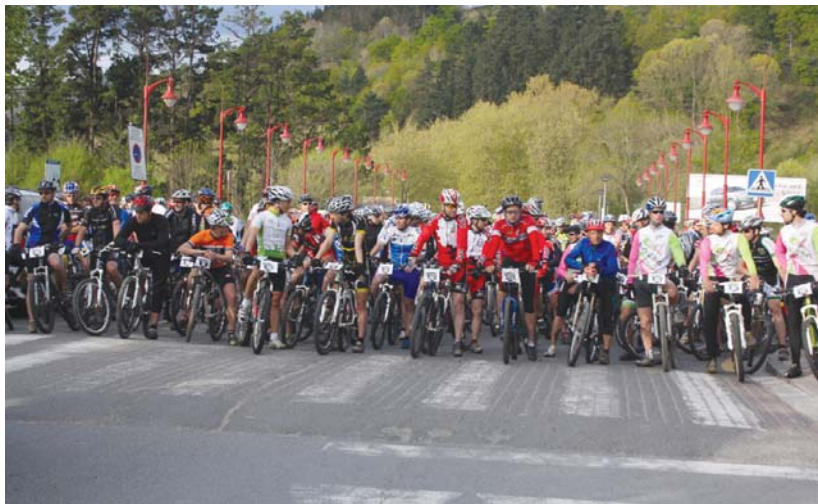
Hipodromoko zubian 271 txirrindulari bildu ziren iazko BTTan. Aurten ere antzeko kopurua espero dute antolatzaileek.

Ibilbide motza aukeratzeko dutenek, Andatza mendira egingo dute eta bertan mendi pistetatik igoko dira eta hortik Lasartera egingo dute buelta. Antolatzaileek azaldu digutenez, "ibilbidea lasaia goa da eta ez da prestakuntza berezirik behar hau egiteko".