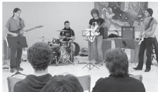
Ikasleek elkarrekin jotzen zuten lehenengo aldia zen kasu batzuetan.

Apirilaren 14a bitartean apuntatzeko aukera dago, baina ez galdu denbora, kopurua mugatua da eta, lehenengo 40 haurrentzat egongo da lekua bakarrik. Izena emateko Ttakun K.E-tik (Geltoki kalea 4, behe) pasa, 943 371448 telefono zenbakira deitu edo www.ttakun.com helbidean sartu. Bestela, Amaraun Ludotekan ere izena emateko aukera badago. •