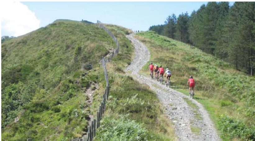
Txirrindulariak Andatza eta Buruntza mendietako pisten barrena ibiliko dira proba honetan.

Informazio gehiagorako, inskripzioaren baldintzak, kuotak eta lasterkariaren programak edo izena-emateko formularioa www.saiatuz.com web gunean aurkituko dituzte interesatuek. •