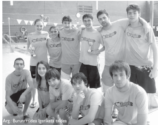
Arg.: Buruntzaldea Igeriketa taldea

Honetaz gain, taldekideek zortzi marka personal hautsi zituzten. "Udako zikloa hasi besterik ez dugu egin eta igerilariak horren forma onean daudela ikusteak sekulako poza eta ilusioa ematen