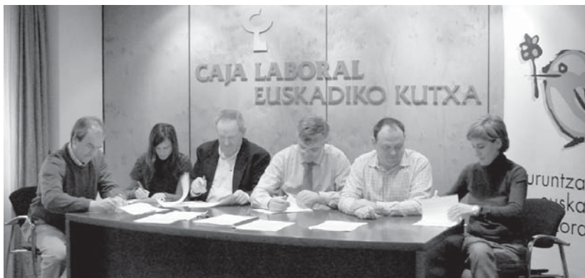
Buruntzaldeko udalerrien eta Euskadiko Kutxako ordezkaria, erdian, hitzarmena sinatzen.