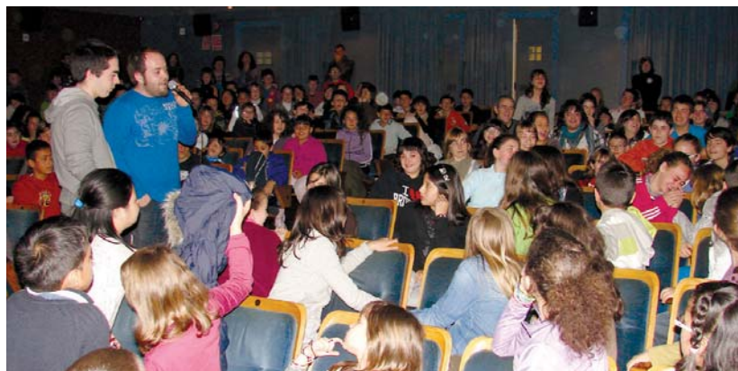
Muñoa eta Gaztelumendi gaztetxoaren artera jaitsi ziren eta bat baino gehiago lotsatu zen haren izena entzuterakoan.