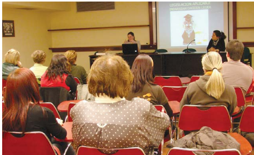
Herritar talde bat bildu zen kulturetxeko hitzaldi aretoan indarrean dagoen txakurrei buruzko legedia ezagutzeko.

Hitzaldi hau Udalak eta elkarteak hitzartutako txakurren jabeek eskaintako ikastaro teoriko praktikoaren hirugarren saioa izan da. Hurrengo, maiatzaren 25ean izango da. •