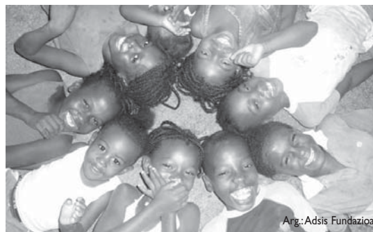
Esmeraldaseko haur, gazte eta familiak festan bildutako diruaren onuradun izango dira.

23:00etara, kontzertuetaz gozatzeko aukera egongo da. Estilo desberdinetako taldeek, hala nola, A Human Disaster , Tamerlayn , A pie de calle