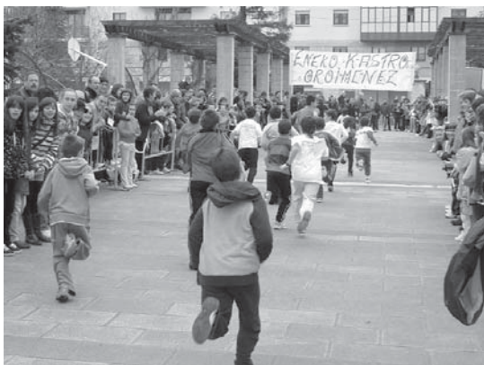
Haur eta gazteek Euskal Krosoko lasterketa desberdinetan parte hartuko dute.