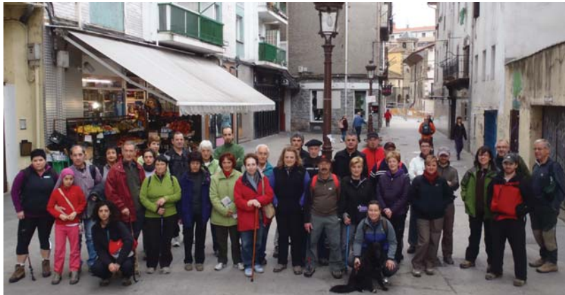
Talde handia bildu zen mendi martxa egin eta Lasarte-Oriako mugak, historia eta bitxikeriak ezagutzeko asmoz.

Oriara egiteko ordua iritsi eta bertan auzo hau zeren eraginean industrializatu zen aztertu zuten. "Nekazariak ziren hemengoak, baina Brunet familia iritsi zenean kapitalismoaren aro modernoan sartu ziren". Familia garrantzitsua izan zen, Donostiako alkate, Diputatu Nagusi ere izan ziren hauek bartzuk.