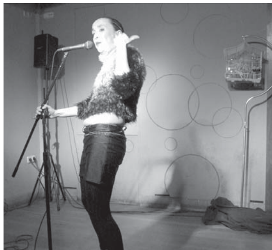
Aktoreak, emanaldiaren hasieran, Barbie itxurako panpin bat sartu zuten kaiola batean.