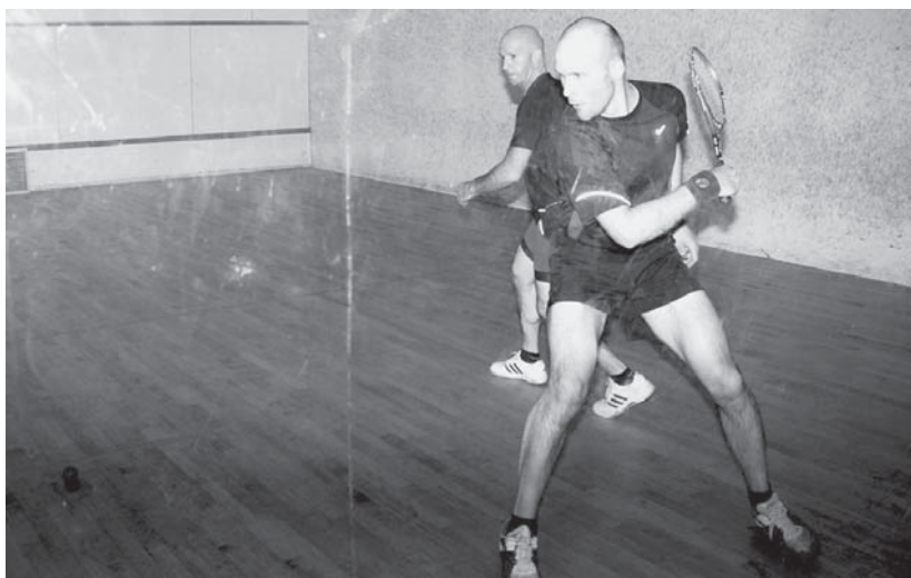
Udabe eta Erkizia azken bi finalean egon dira. Aurten ere finalean egon daitezke, baina hemezortzi lehiakide dauzkate garaitzeko.

Bigarren fase horretan ligasak jokatu ondoren lehenengo bi sailkatuek finalerako txartela lortuko dute. Hirugarren eta laugarrenok, aldiz, Kontsolaziozko finala jokatuko dute.