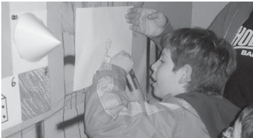
Herriko haur eta gazteek ongi pasatzeko aukera izango dute Amaraun klubak eta Gazte klubak prestatutako jolas eta probekin.