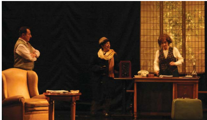
Helduen Hezkuntzako Lan eta Lan antzerki taldeak La Ratonera lanarekin misterioz bete zuen kultur etxeko aretoa.

Ostean, Araeta jatetxean amaitu ziren ospakizunak emakumeek egin zuten afari herrikoiarekin. •