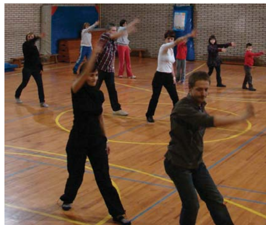
Asteazkenean 19:30etan egingo da entsegu orokorra Sasoeta ikastetxean.

Disko jartzaile batek jai giroa alaituko du, eta euskal dantza, break eta dantza latinoko erakustaldiak izango dira. Gutxi gorabehera 13:30ean ekingo diote flash mob-a dantzatzeari. •