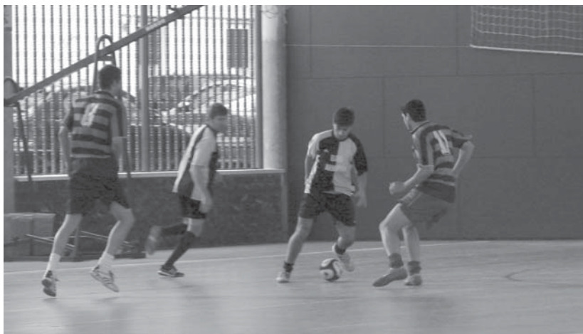
Asteburu honetan eta hurrengoan, gogor lan egin beharko dute talde batzuk final handiko edo ligaxkaren bidea hartzeko.

urteen antzera, hiru txapelketa egingo direla azaldu digute antolatzaileek.