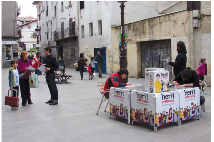
"Zure ahotsa, gure hitza" lelopean ezker abertzaleak herri programa osatu nahi du. Horretarako, Sagardotegi kalean jarri zuten mahai

Honetaz gain, ezker abertzaleak herritarren ahotsa, iritzia, kezka eta iradokizunak jasotzeko Xirimiri eta Artizar tabernetan eta Zabaleta auzoko dendan buzoiak dituela ere gogorazai behar da. •