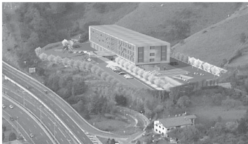
Irudian, Goeigi Gorako hotelaren proiektua. Bertan ikusi daiteke estaldurarik gabeko igerilekua.

Honen bitartez, 15 urtez hotelaren igerilekuaren erabilera publikoa izango da. Herriko