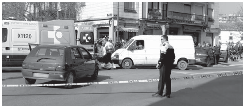
Lehenengo planoan ikusi daiteken kotxeak bi bidaiariak eraman zituzten ospitalera.

Bestalde, LOHP eta Ezker abertzaleak diru laguntzen araudiari helegiteak egitearen epea luzatzea eskatu zuten eta epea aste bete gehiago irekia egotea adostu zuten. •