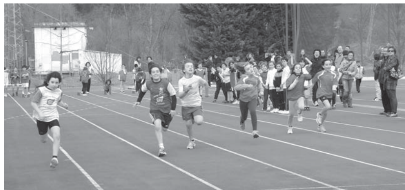
Indar eta gogo guztia jarri zuten Landaberri, Sasoeta-Zumaburu, Jakintza eta Udarregi ikastetxeetako gazteek lasterketan.

"Pozik gaude laguntzen dutelako eta esfortzua egiten dutelako," aipatu dute Ostadarreko antolatzaileek. •