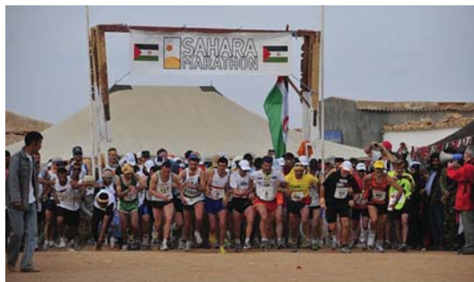
126 korrikalarik parte hartu zuten Saharako maratoi gogorrean eta 120k amaitu.