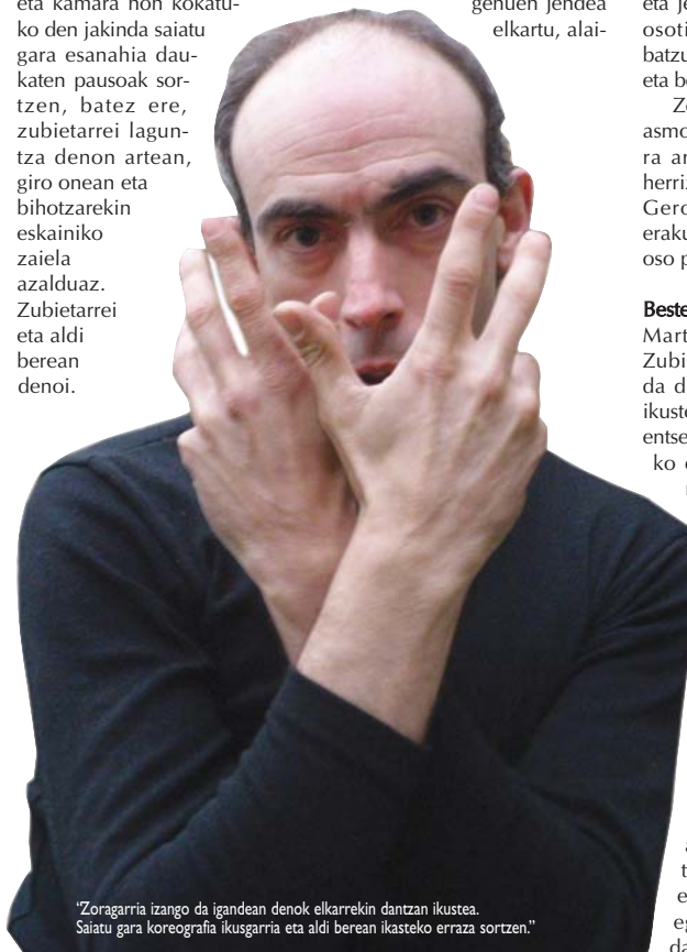
“Zoragarria izango da igandean denok elkarrekin dantzan ikustea. Saiatu gara koreografia ikusgarria eta aldi berean ikasteko erraza sortzen.”

Koreografia erraza da, bi mila lagunek dantzatu eta ondo pasatu dezaten prestatua baina ikusgarria ere bai. Horretan saiatu gara, ikusgarria izan dadila baina ikasteko erraza. Mundu guztia animatu nahi dugu: aurretik ezer prestatu ez badute ere, lasai joatean daukate, egunean bertan ikasi eta dantzatzeko. •