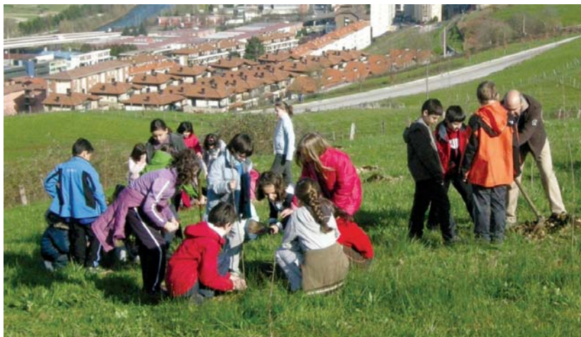
Landaberri ikastolako eta Sasoeta-Zumaburu ikastetxeoko gaztetxeoek 75 zuhaixka landatu zituzten.

Atzo, aldiz, Helduen Hezkuntza eskolako, euskaltegiko eta jubilatuetako lagunen txanda izan zen. •