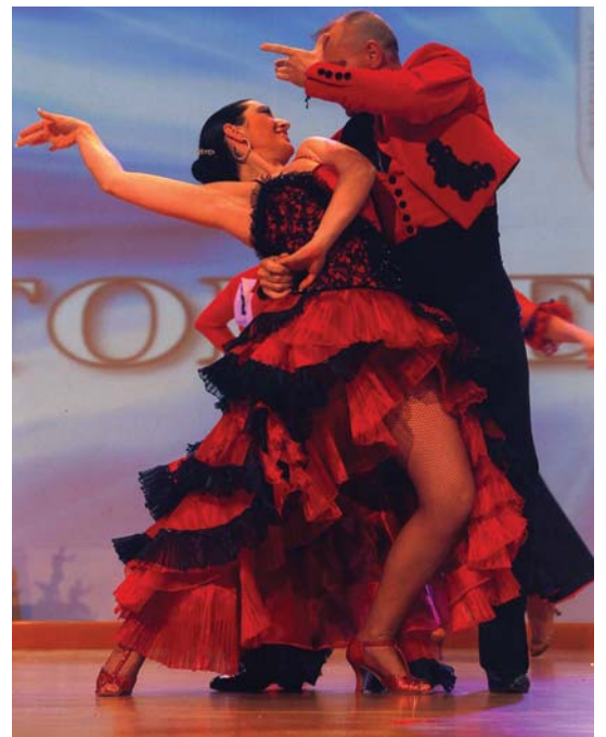
Europako pasadoble txapelketan lehenengo postua eskuratu zuen bikoteak.

Apirilean irekitzea dugu pentsatuta hastapenetan daudentzako, eta gero udari begira, uztailean ikastaro intentsibo bat egiteko. •