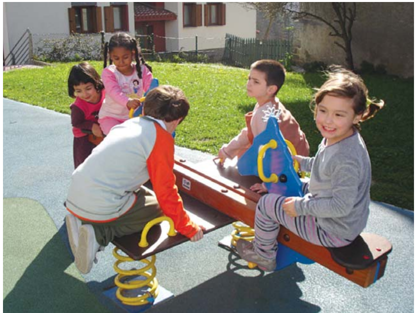
Ederki pasako dute haurrek jolasean Aste Santuko Txokotan.

Eta azkenik apirilaren 29an eta 30ean probatu dituzten kirol guzti hauen final handiei emango zaie