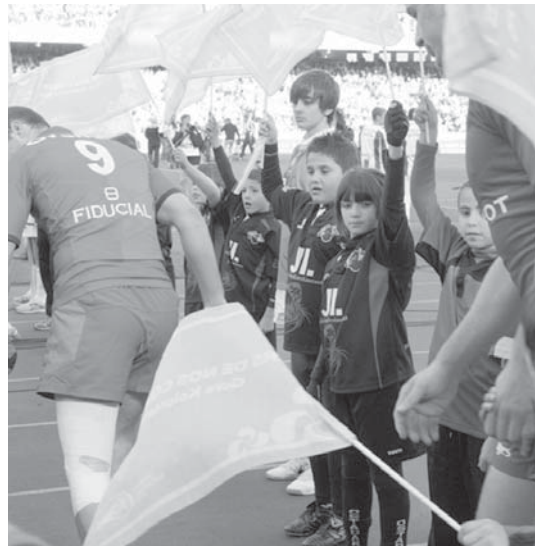
Beltzak Ostadar Jalai eskolako benjaminak ohorezko pasilloan.

Honetaz gain, Beltzak Ostadar Jalai eskolako benjamin mailako lau kidek partida hasieran taldeei egiten zaien ohorezko pasilloan egoteko zortea izan zuten. •