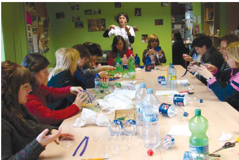
Bi botila ipurdi, kremailera bat eta oihal zati batekin diruzorroa egiten ikasi zuten biziklapen tailerrera gerturatu ziren emakumeek.

Amaieran, emakumeek ere gaiari buruzko haien iritzia eskaini zituzten. •