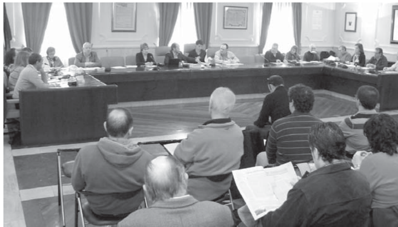
Ikusmin handia sortu zen atzoko Udalbatzarraren inguruan eta horrek, batzar aretoa herritarrez betea egotea ekarri zuen.

Ezker Batuako zinegotziak "interesatua eta alderdia lehe-