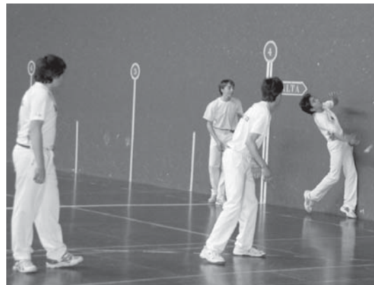
Intzako bikoteak joaneko emaitzari buelta ematen saiatuko da.