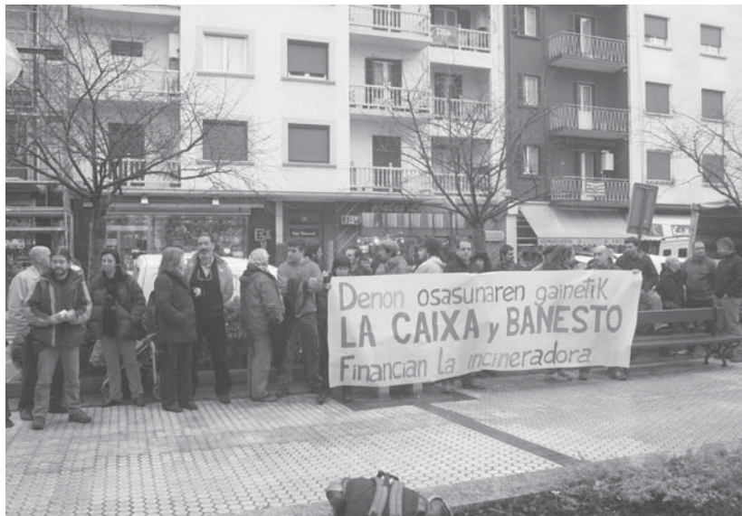
La Caixaren aurrean elkartu ziren Lasarte Oria Bizirik taldekoak Erraustegia finantzatzeko duela jakinarazi eta salatzeko.

Beraz, azken finean errausketaren alde egin duten banku hauek errefusatu dituzte plataformak, herritarren eta oro har luraren osasunaren aurka ari direlako, errausketa bazterten