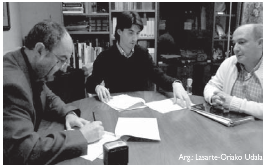
Erroak elkarteko ordezkaria, alkatea eta lanbide dinamizatzailea sinaketa ekitaldian.

Proiektuaren arduradun den tekniko baten eta irakasle baten eskutik, abenduaren 30ean hasi zuten prestakuntza eta otsailaren 25etik ekainaren 29ra, udal zerbitzuei lagunduko diete eskoletako patioetako, eraikineta