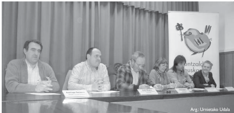
TSST enpresako ordezkaria, udal ordezkariak, sindikatueta ordezkaria eta euskara teknikariak egitasmoaren aurkezpen ekitaldian.

Buruntzaldeako herrien ekimen berri hau 10 langiletik gorako enpresei zuzendua dago, beti ere, euskara edo euskarazko sorkuntza enpre-