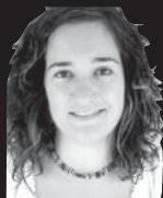
Helburua + Kamarak = KONTROLA

Udaletxe berriko eraikuntza lanak gertutik bizi ditudala aurreko zutabe batean ere agerian geratu zen. Azken hilabeteetan asko dira salatzekoak baina aste honetakoak norbanakoaren duintasun eta hiritartasunerako muga guztiak gainditzen dituelakoan nago.