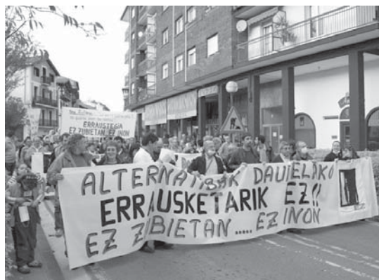
Erraustegiaren aurka beste mobilizazio bat egingo da larunbatean, 12:00etan.

Gauzak honela, Lasarte-Oria Bizirik! taldeak larunbatean, otsailaren 12an, eguerdiko 12:00etan Denon osasunaren gainetik beraien negozioa aurretik lelopean elkarretaratzea egingo du Lasarte-Oriako La Caixako bulegoaren, Kale Nagusia 38, aurrean.