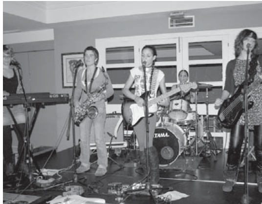
Musika eta arte eszenikoak txandakatuko dira kultur etxeko kafetegiko emanaldietan.

Honetan Nasdrovia antzerki taldeak bakarriketarik