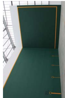
Frontoia lanen lehenengo fasean egon zen eta bigarren fase honetan frontoia bareratu egin da. Ber dago zabalik erabiltzeko prest. Osoailek aurrera Udak instalazio berri hauek jartu dituzte eta orain herriaren dibertigarria eramanen hauek erabili eta jolatu egiten. Pigeu, sarrerak gaitu eta egiten dituzte.

Ikasleak, eta ordu beteko saria izango da. Herriaren padelaren grina barneratu nahi diet, Nola jolasten den eta kirol hau mailatzen irakatsi. Biharkeaz gain beste bihurtu saio egongo dira. Hurrengo otsailaren 20an, igandean izango da. Beste bi saioak larumbatean izango dira otsailaren 26an eta martxoaren 12an.