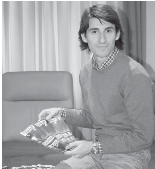
Herritarrek aste honean beherapenen berri ematen duen diptikoa izango dute etxean.

Gazte txartela egiteko, gazte bulegora joan eta 5 euro ordaindu behar dira txartela lortzeko. “Kasu honetan