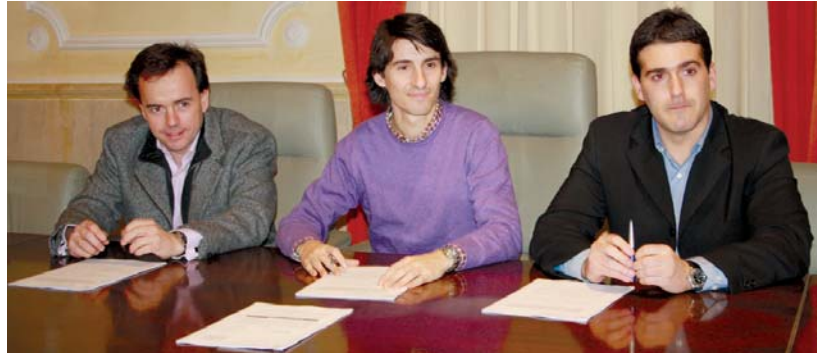
Udalak Zabaleta Berri eta NASIPA enpresekin sinatutako hitzarmenari esker, 127 etxebizitza zozketatu ahaliko ditu.

Gauzak honela, alkateak azaldu zuenez, Goiegi Ibarreko lehengo zozketan sartu