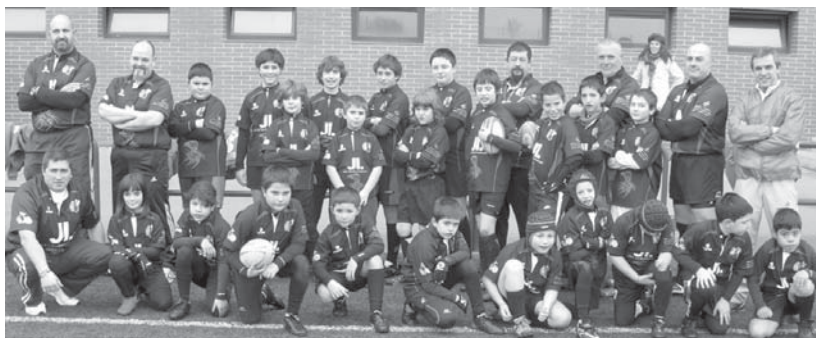
Beltzak Ostadar Jalai Errugby eskolako gaztetxoek ederki gozatu zuten Logroñon.

Kutxa Sariko finaletz gain, Buruntzaldea Igeriketa taldea larunbatean 2. Mailako Gipuzkoako Neguko Sarian lehiatuko da Zarautzen. •