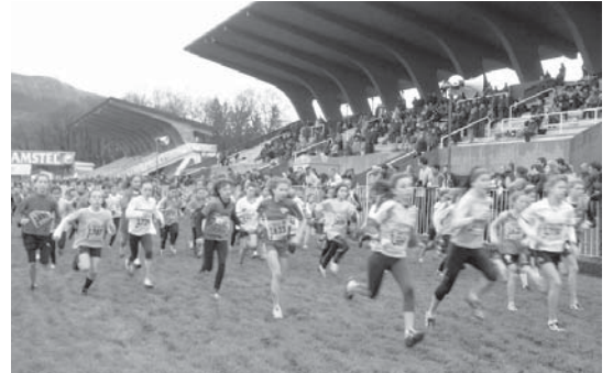
Hipodromoan adin eta nazio desberdinetako korrikalariak ikusiko dira igandean.

Goiza osoan zehar, 10:30etan hasita, proba desberdinak