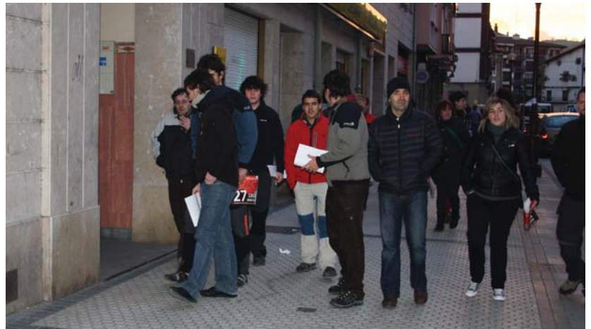
Goizeko 8etan pikete informatiboak herriko kaleetan barna grebaren nondik norakoak azaltzen ibili ziren.

Atzo herritarrek pentsioen eraldaketaren kontra batu eta protesta egin zuten. •