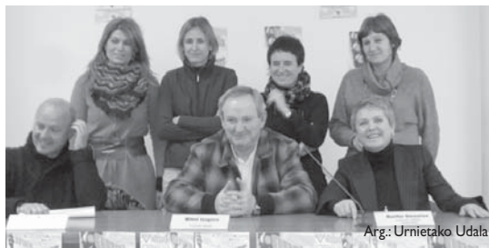
Arg.: Urnietako Udala

Honenbestez, zuzenean jasotako arreta, txalo eta agurak testuen egileei iristea nahi dute. "Gurpila bueltaka jarrita, haiek guztiengana iritsi nahi dugulako. Gurpila ez dago geldirik. Iristeko dagoen konponbide demokratikoa, gurpilarri eragiten edo arraunean ari garelako helduko da," adierazten dute. •