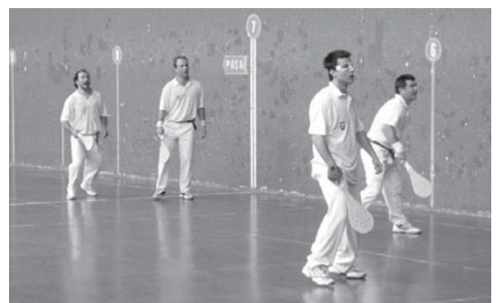
Gomazko Pala txapelketa otsailaren erdialdean hasi eta finalak maiatz aldera izango dira.

Partidak aurreko edizioetan bezala, udal instalazioetako frontoian, Michelingo frontoian, jokatuko dira asteburuetan.