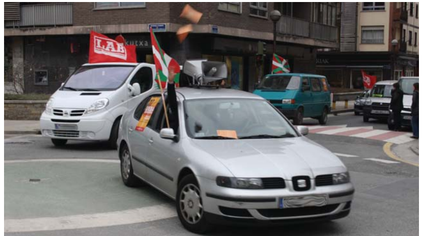
Kotxe bozina ugari entzun ziren Lasarte-Oriako kaleetan, bai astezkenean baita atzo ere.

ELA, LAB, Stee-eilas, Ehne, Hiru eta CNTk pentsioen eraldaketaren aurka greba deialdia egin zuten atzo