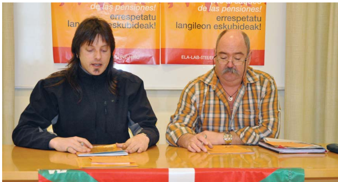
ELA eta LABeko ordezkariak ostiralean Hernanin egin zuten eskualdean datorren ostegunean greba orokorra egiteko deialdia.