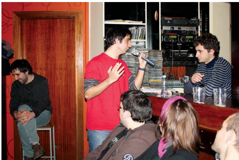
Saio politta egin zuten zarauztarrek tabernako barraren bi aldetan.