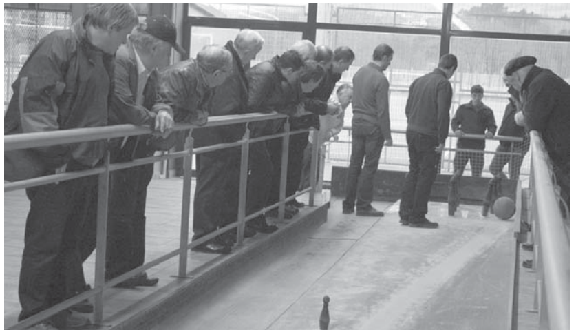
Gipuzkoa osoko bolari asko etorri ziren atzo Michelin Udak Kirol Guneko bolatokira. Ikusmin handia sortu zuten berdinketek.