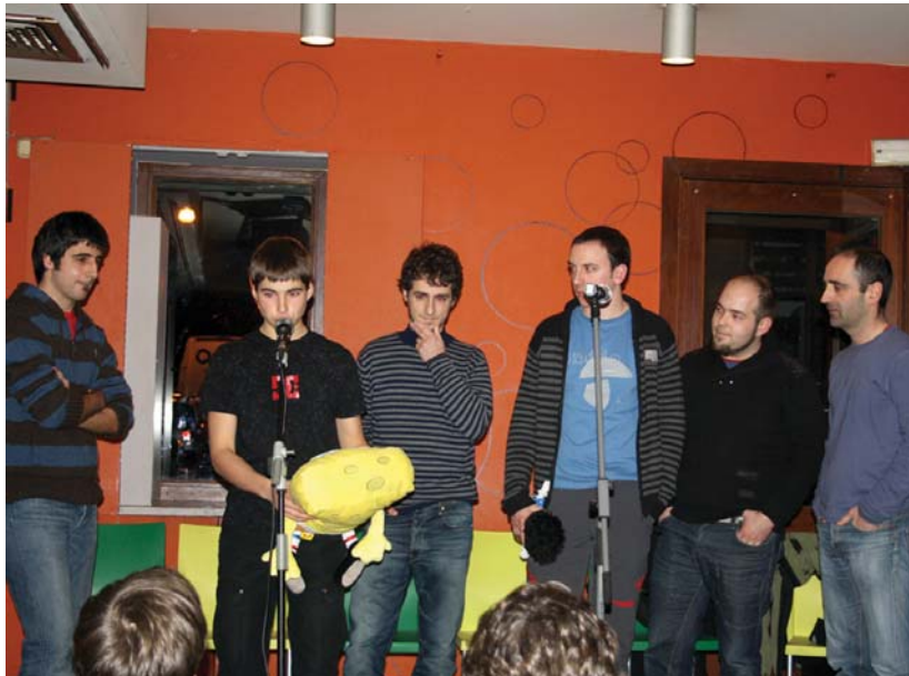
Maleta handiarekin etorri zen gai jartzailea ostiralean, eta gai eta ariketa bereziak jarri zituzten bertsolariei.