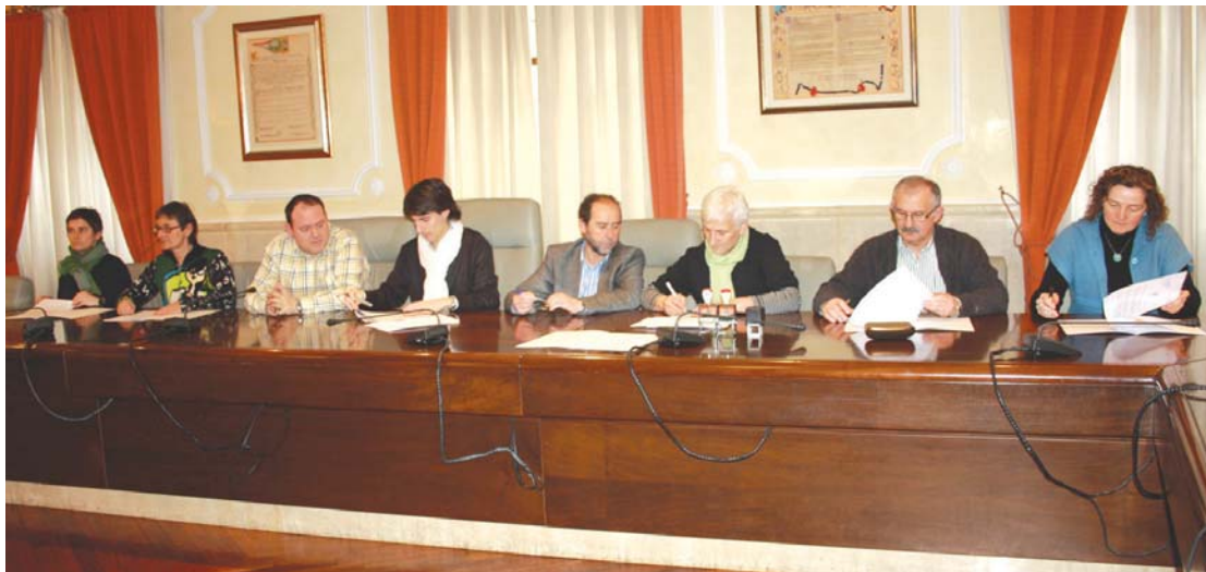
Lasarte-Oriako Udaleko ordezkariak, ikastetxeetako zuzendariak eta Ttakun Kultur Elkarteak lehendakaria hitzarmen sinaketa ekitaldian.