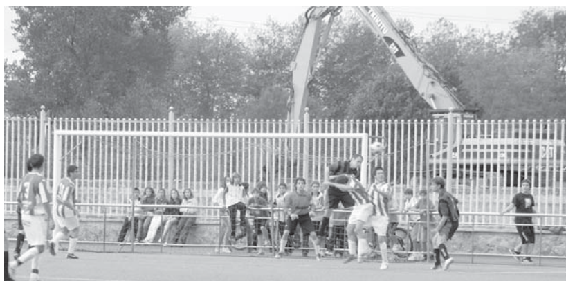
Sareri ez dagoenez, entrenamendu, zein partidetak baloia Michelin lantegiko obretara doa eta horietako asko galtzen dira.

Gauzak honela, Ostadarreko arduradunek sarea jartzea eta taldeen kalte ekonomikoak,