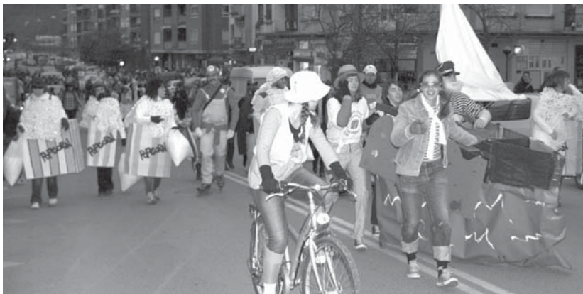
Txankete eta bere lagunak bisita izan genuen izako inauterietako desfilean.