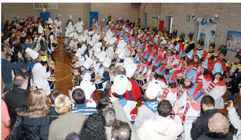
Zumaburu-Sasoeta ikastetxeako gazteek gimnasioan bildu eta Sarriegiren doinuak jarraituz danborrak astindu zituzten.