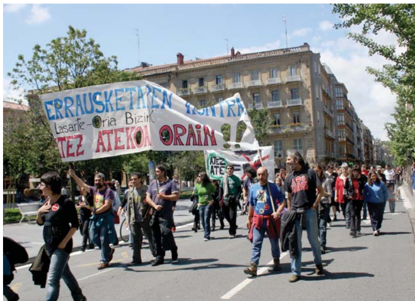
lazio ekainean, erraustegia eraikitzeko proiektuaren moratoria eskatzeko manifestazioa egin zen Donostian.

Ekonomia arrazoiak ere aurkeztu dituzte Jaurilaritzan. Batetik 264.010.000 euroko aurrekontua ez dela zuzena argudiatzen dute. 500 milioi euroko aurrekontua gaindituko dela uste dute plataformek, aipatutako aurrekontuari benetan izango diren beste