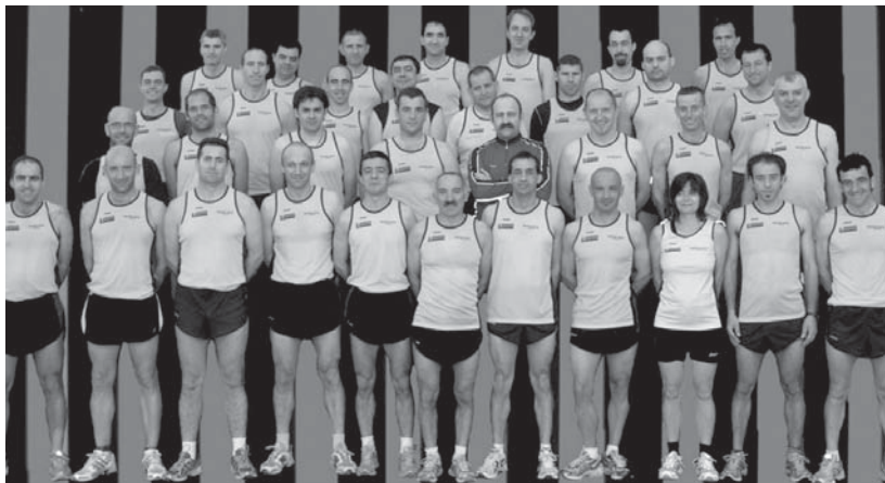
Ostadarreko atletismo saileko kirolarietako batzuk aurreko kirol jantziarekin.

09:30etik 10:45era, LH4 mailako gaztetxoentzat Errugby topaketa antolatu da, kiroldegian. 10:45etik 12:00etara, LH3 mailako gaztetxoentzat Errugby topaketa antolatu da, kiroldegian.