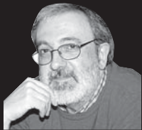
Sentimentala jarriko naiz gaur

...ekonomiaz hitz egingo dut, beraz. Logiko, ezta? Ez litzateke arraro gertatu behar behintzat, dena elkar lotuta baitago mundu honetan.