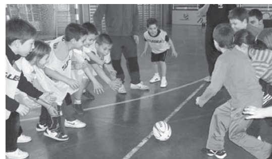
Multikiroleko gaztetxoek errugby topaketak hasi dituzte eta ederki gozatu zuten.

Jarraian, linea deritzon ariketa egin zuten. Honetan bikoteka jarrita pase bat egin