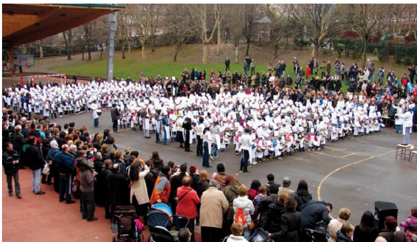
Landaberri ikastolako txikiak, gurasoen begiradapean, ilusio handiz jo zituzten lehenengoz danborrak Garaikoetxeako patioan.

Landaberri ikastolako, Garaikoetxea eraikinean, haurrek patioan jo zituzten beraien danborrak, txikiak ilusio handiz lehenengoz astindu zituzten gainera; Zubietako eraikineko ikasleek ere txintxintxo jarraitu zituzten zuzendarien aginduak.