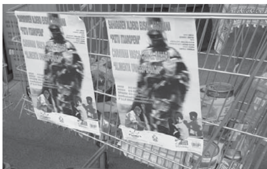
Sahararen aldeko janari bilketa egiten ari dira herriko supermerkatu eta ikastetxeetan.

Ekimen honetan parte hartu nahi baduzue bi modu daude, batetik 3035 0080 94 0800054177 kontuan dirua