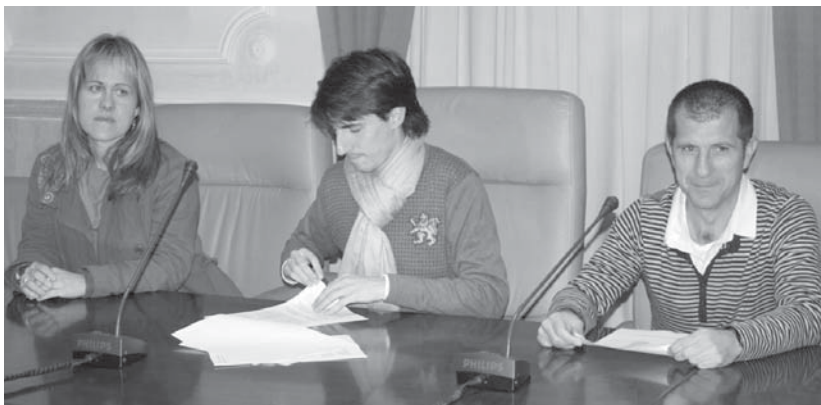
Behemendi elkarteak Lasarte-Oriako Udaleko Gizarte Zerbitzuek eskaintzen dituzten zerbitzuak landa mundura hurbilduko ditu.