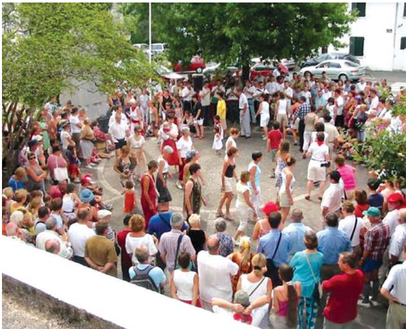
Iparraldeko herri askotan, hilean behin antolatzen dute dantza saioa. Adin guztietako dantzariak biltzen dira.