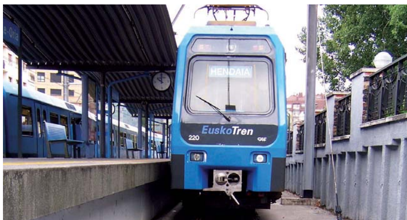
EuskoTren Oria auzora iristeko azterketari buruzko mozioa jorratu zen atzoko Udalbatzarrean.

Honen bitartez, Udalak Eusko Jaurlaritzako Etxebizitza, Herri Lan eta Garraio sailari lotura horren bidegarritasun ekonomiko, azpiegiturakoa eta sozialaren azterketa eta honen jasangarritasuna ikertzea eskatzen dio.