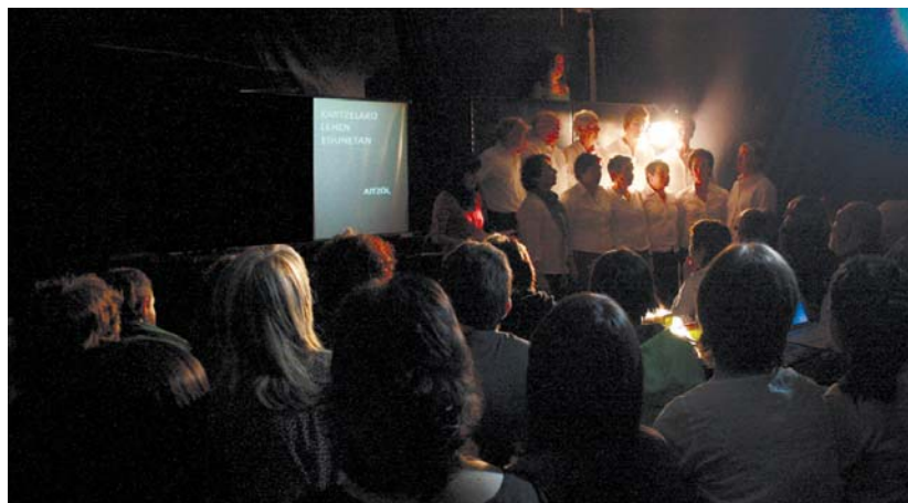
Dantza, kantua, musika, hotsak, irudiak,... Horiak guztiak, hitzen laguntzaile izan ziren eta, era berean, Xirimiri elkartearen bildutako herritarrek presoen olerki eta eskutitzak hobeto ulertzeko balio izan zuten.