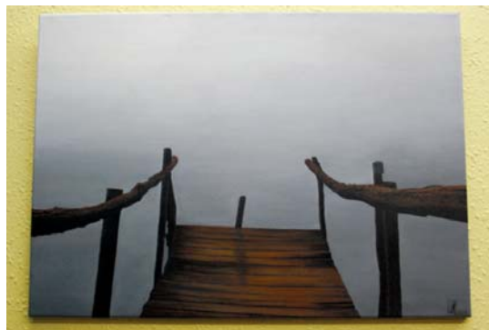
Aginako Patxi Segurola presoen margoak ere ikusi ziren Xirimiri elkartearen hormetan.