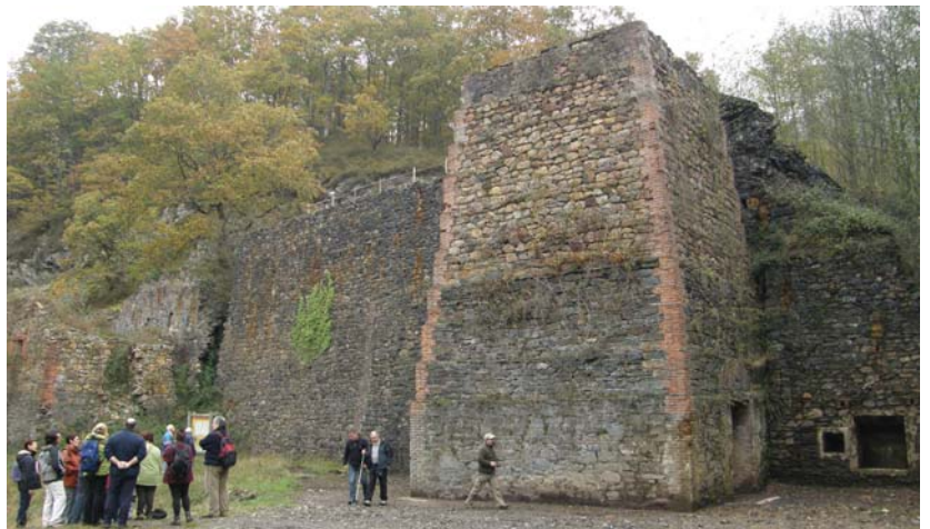
Leitzarain Bailarako iraganera hurbildu ziren Oinatz taldekoak Burdinak taldeak egindako lana ezagutzeko.

Segura eta Zeraingo bisita honetara animatzen direnei.