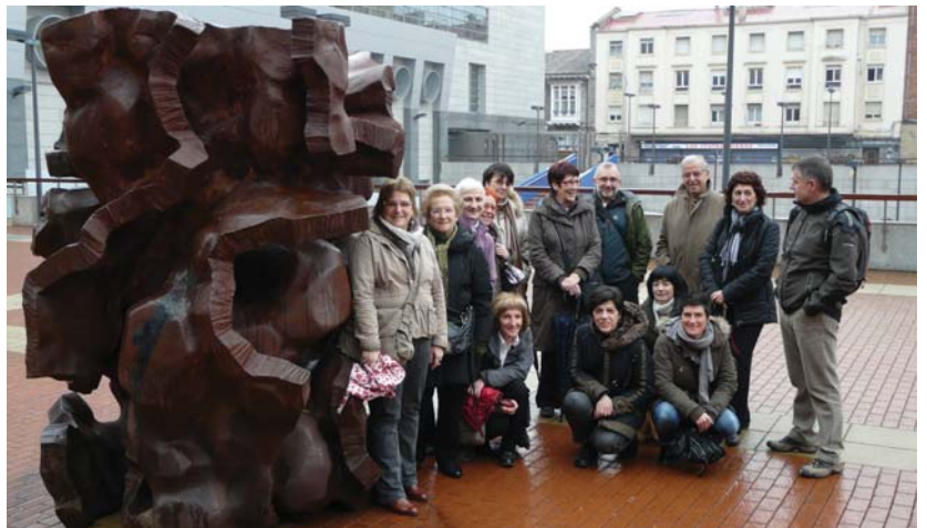
Landa inguruaz gain pasa den urtean Gasteiz hiria ezagutzeko parada ere izan zuten Oinatz taldekoek.

Gauzak ezagutu behar dira baina ulertu ere bai, eta horretarako ikustearekin bakarrik lortzen den informazioaz gain, osatzeko informazio gehiago helaraziko zaie