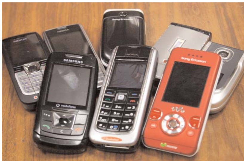
Telefonia Mugikorreko operadoreak dira Lasarte-Oria kexa eta kontsulta gehien sortarazten dituztenak.

Hala ere, azpimarratzekoa da, kontsumitzaile eta erabiltzaileen aldeko 131 ebazpen egon direla bukatu berri den urte honetan.