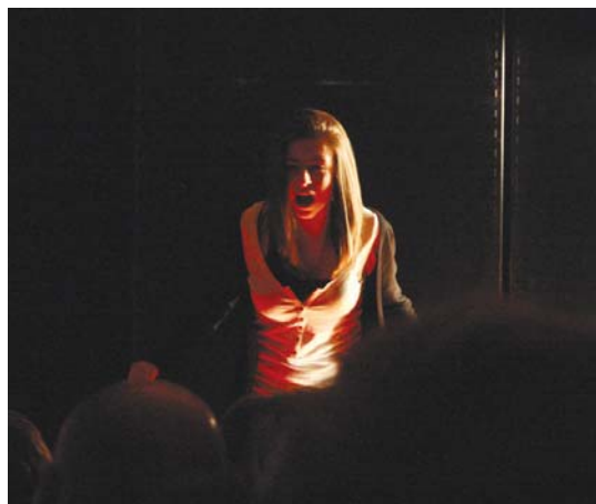
Presoen senitartekoez, bertsolariak eta herritarrek irakurri zituzten olerkiak eta eskutitzak. Gehienetan bakarkako irakurketa izan bazen ere, olerki eta eskutitz batzuk taldean taularatu ziren.