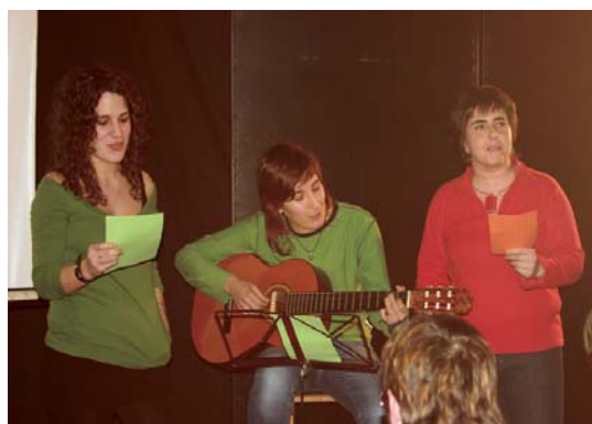
Amaieran, hirukote honek Xirimiri bildutako ikusleak kantuan jarri zituen.

Era honetara, tarteka ekitaldiak eginez, elkarren berri izateko bide horri bizirik eutsiko zaiola adierazi dute antolatzaileek. •