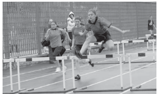
Gaur eta bihar, herriko atleta gazteak lehiatuko dira, Donostiako belodromoan.