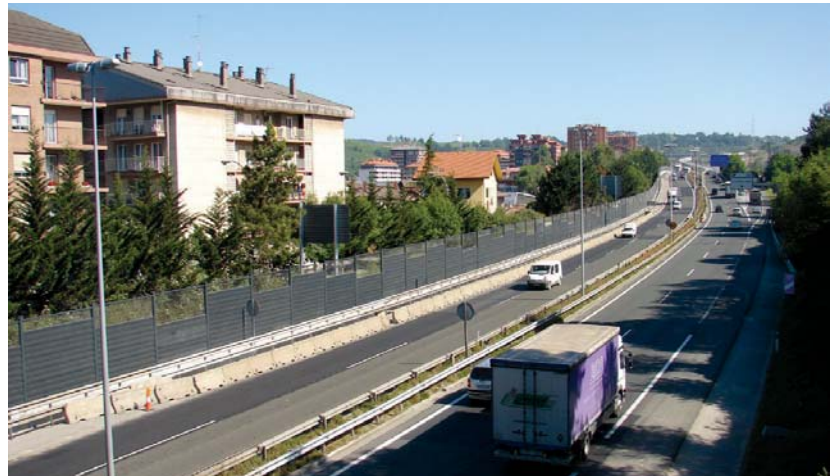
Lasarte-Oria zeharkatzen duen N-1 errepidean soinu pantaila gehiago jarriko dira PSE-EEren ekimenari esker.

zehatu gabe egon, "Gipuzkoako Batzar Nagusietako PSE-EE taldeak lan horiek lehenbailehen aurrera eramateko lan egingo du," adierazi zuten.