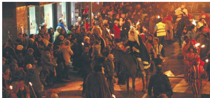
Herritar ugari izan zen Lasarte-Oriako erdigunean Erregeen kabalgata ikusten. Argazkian, Geltoki kalea.