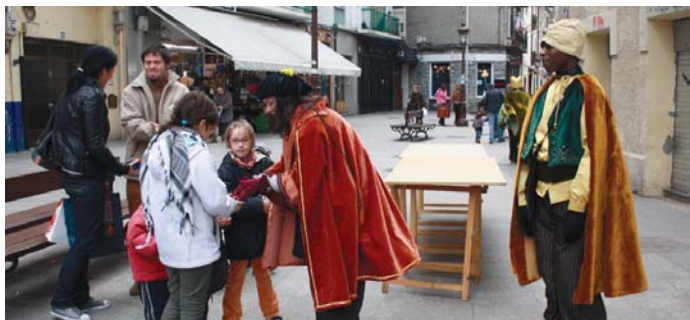
Erregeen laguntzaileek goizean haurren eskutitzak biltzeaz gain, eskutitzen tailerra antolatu zuten.