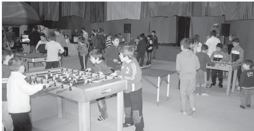
Gabonetako haur parkean zeuden joko, makina, zezen mekaniko eta puzgarriekin ederki gozatu dute haur eta gaztetxoek.