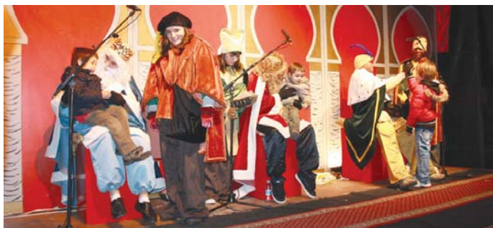
Erregeekin egon eta eskutitza emateko irrikitan zeuden Andatza plazan bildu ziren haurrek.