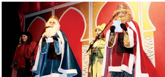
Haurrek bidalitako eskutitzak irakurri zituzten Meltxor eta Gaspar erregeek eta ostean, goxokiak bota zituzten.