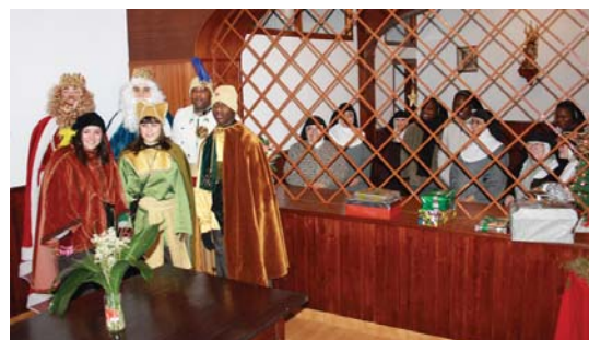
Ama Brigitarren komentuko jaiotzako haurrek opariak utzi zizkieten errege eta mojei ere bisita egin zieten.