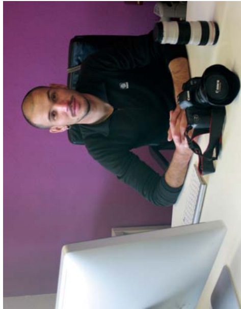
Golf plaza 4 behean, Aizobakarren Ander. Gartziazindarekin sortu zuen dulea urte bete Aizobak. Espiritho Estudioa.

Beste lehiaketa batzuetan parte hartu al duzu? Dexentelan aurkeztu naiz. Urte mordoan darazatik argazkilaritza munduan amantzen duen argazkilaria da. Argazki hori argazkilaritza munduan amantzen duen argazkilaria da.