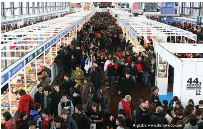
Jende ugari hurbiltzen da urtero Durango Azokara. Ohitura bihurtu da abenduko zubian Durangoruntz egitea