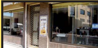
BIYONA iturgintza, Pili www.fontanerlabiyona.com