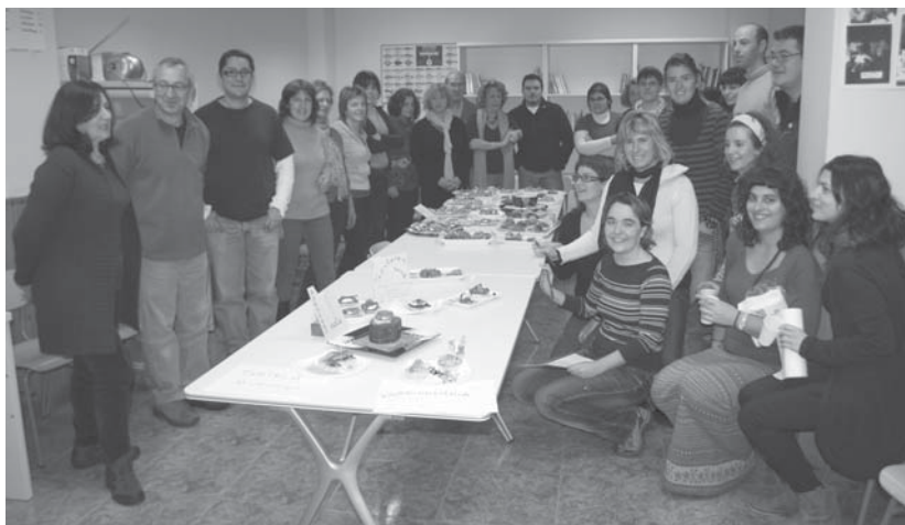
Kalitatezko pintxoak aurkeztu ziren Munterri-AEKko pintxo lehiaketan. Argazkian, goizeko lehiaketan parte hartu zuten ikasleak.