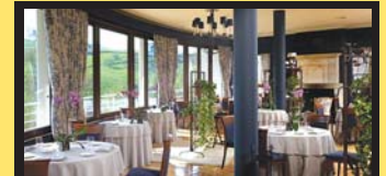
MARTIN BERASATEGI jatetxea, Martin www.martinberasategul.com