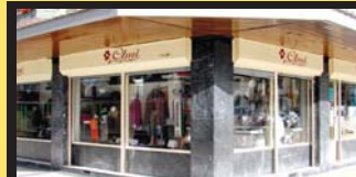
OLMI merceria, Olmi