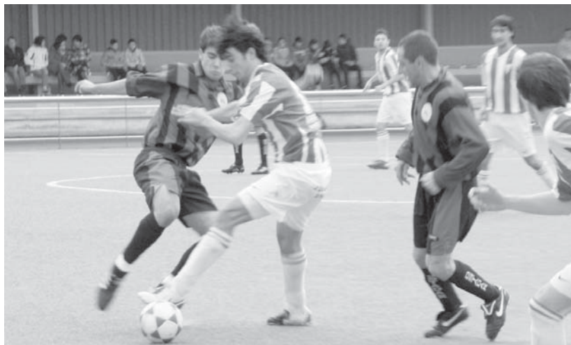
Nahiz eta Ostadarrek partidako lehen gola sartu, Texas Lasartearra taldeak partidari buelta eman zion.

11:30etan, herriko hainbat korrikalarik 32. bikote mixtoen krosean parte hartuko dute, Zarautzen.