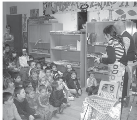
2010. urte hasieran Kontu Kantoirean ipuin bereziak arretaz entzun zituzten umeek.

Abenduaren 10ean, Giza Eskubidearen eguna izanik "momentu aproposa iruditu zaigu Mendebaldeko Sahararen egoera salatzen" azaldu digute antolatzaileak. Saharar herriaren egoera gero eta larriago den honetan "herritarrek euren elkartasuna erakusteko gonbitea luzatu nahi diegu" adierazi dute. •