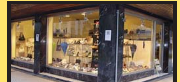
ITURBE oinetakoak, M a Ixabel