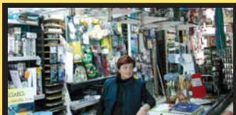
SUKOA burdindenda, M a Jesus