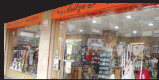
ARITZA merceria, M a Carmen www.merceriaaritza.com