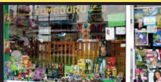
ZUMABURU liburutenda, Lola