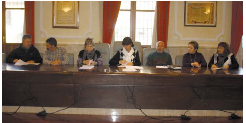
Lasarte-Oriako alkatea, kultura saileko ordezkariak eta talde kulturalak ordezkariak hitzarmen sinaketa ekitaldian.

Zero Sette akordeoi orkestrari dagokionez, urtean bi emanaldi egin behar ditu; Lasarte-Oriako Udalarekin ados jarrita beste akordeoi orkestra kontzertu bat antolatzeko konpromezua hartzen du, honekin elkartrukea egiteko aukera izango duelarik eta