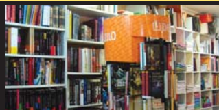
EKAIN liburutenda, Iñaki www.ekain.net