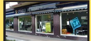
OTAEGI altzariak www.inchaustidecoracion.com