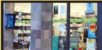
PARAFARMAZIA LASARTE , Iñigo www.parafarmazia.com