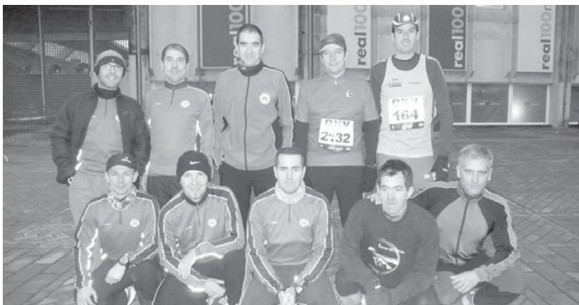
Ostadar K.F.-ko korrikalariek taldeko argazkia atera zuten Donostiako Maratoian parte hartubaino lehen.

Lasarte-Oriako Udal Kirol Zerbitzuk jakin arazten du, datozten abenduaren 6 eta 8ean egun osoaz Kirol Gunea, Michelin, itxia egongo dela. Halaber, erabiltzaileei jakinarazten zaie Lasarte-Oriako Udalaren Kiroldegia eta igerilekua, abenduaren 6 eta 8ean, goizez zabalik egongo dela, 9:00etatik 13:00etara.