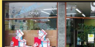
LIZARRI optika, Izziar