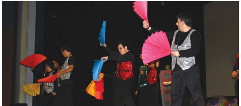
Locomia taldea egon zen, artista gonbidatu bezala, Jalguneko lagunak San Pedro jai berezi hauetan.