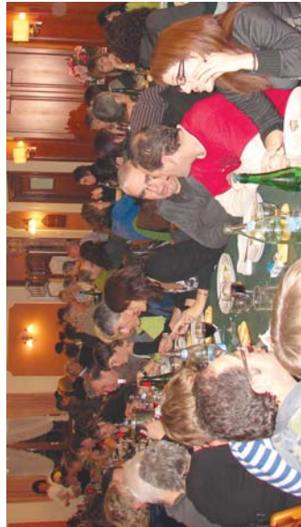
Giro ederra egon zen ekitaldi aurreko aharian. Bihun bat heldu en gazteko bidu ziren Takoloki omenaldia egiteko.