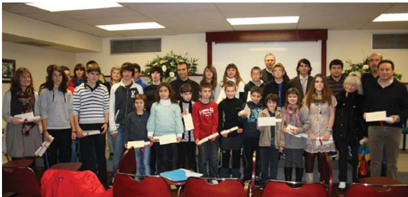
Saridun guztiak eta udal ordezkariak argazki ofiziala ateratzeko bildu ziren ekitaldia amaitutakoan.