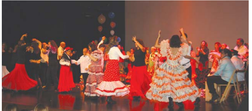
Ondo ibili ziren Jalgunekoak sevillan dantzatzeko Semblante Andaluzeko lagunak doinuak erritmorik.

Eta nahiz eta jaietako amaiera eman, Jalguneko lagunak abesti eta dantza sorta ederra eskaini zituzten, parte hartzaile guztiei bihotzez eskerrak eman eta jaialdia amaitutzat eman baino lehen. •