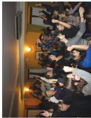
Karroselan Agur Mujika omenaldia honen amaiera eta arretoko guztiak abestu eta dantzatu zuten, hain nola, patuzen Mile-768 abestu.