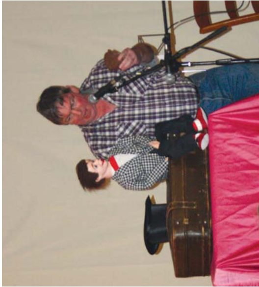
Agus ezin izan zion gogoratu esueli. Amaren balarra dionua kantatu eta Martinxo pauphararen saioa egin zuen.

neurriak ere adi entzun zituzten guztiak.