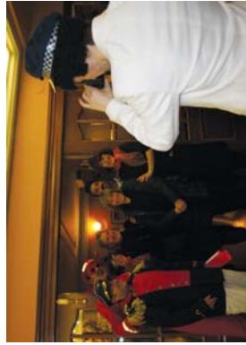
Ekitaldi sarru lehen, argakiak saio berez egin zen Goiegoko harreran.

Omenaldiko aroetan sartu baino lehen, bidai hasierako angakia ateratu zuten itsasontziaren eta gure herrian eta honetatik tempo euskararen alde egin dituen guztiak ez-