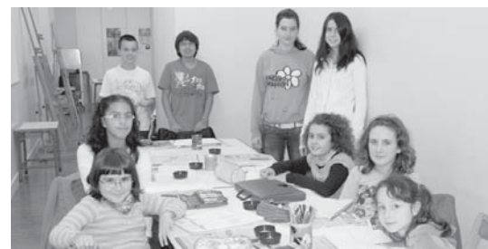
Adin guztietako ikasleak daude Pintura eta marrazki eskolan.