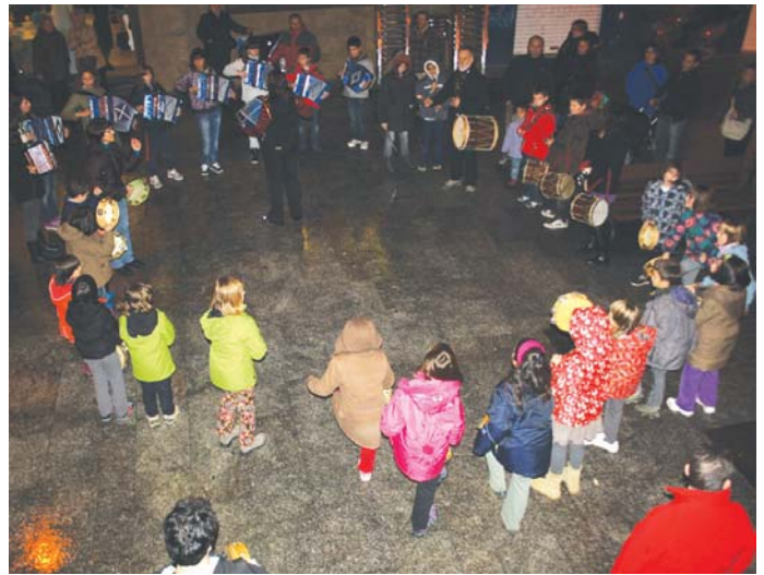
Sargardotegi Kalean jende ugari bildu zen Amalur trikiti eta pandero eskolakoen musikaz gozatzeko.