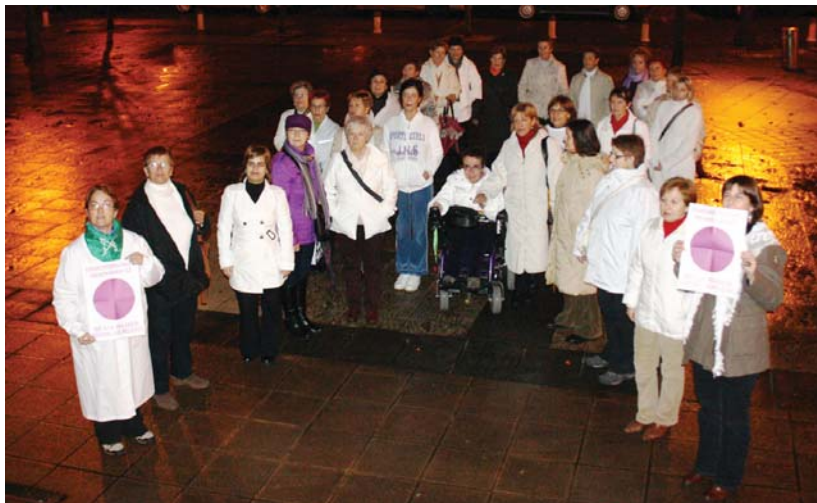
Emakumeen Zentro Zibikoko hogeita hamar bat emakume bildu ziren atzo arratsaldean indarkeriaren aurkako lazo txuria egiteko.

Gaur ere ekintzak egingo dira. Zentro Zibikoko taldeen eskutik antzerkia egongo da, 19:30etan, eta eguna ondo amaitzeko, afaria Araetan. •