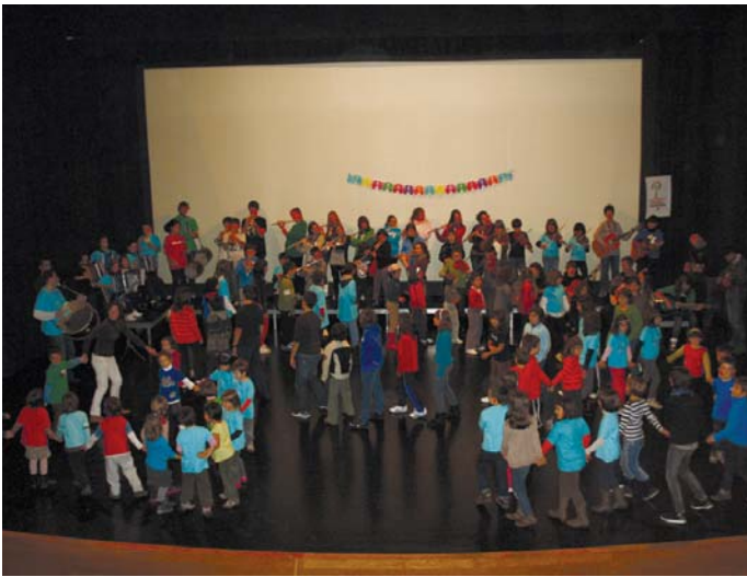
Kalerako prestatuta zeukaten emanaldia kultur etxera egokitu behar izan zuten Musika Eskolakoek.