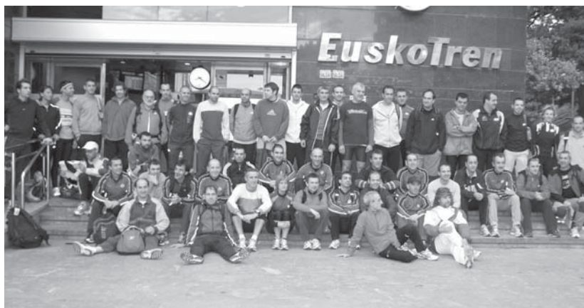
Goizeko 08:15ean Behobian parte hartuko zuten korrikalariak zuten zita tren geltokian argazkia ateratzeko.