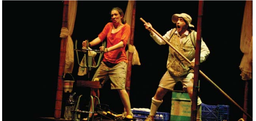
Alabaren bila joan zen Afrikara antzerkiko protagonista, eta bidean nahiko komeri eta abentura bizi behar izan zituen.

Hasiera batean bere berri maiz bazuten ere, gero eta gutun gutxiago jasotzen joan dira. Halako batean, gutun batekin alabak bere egunerokoa bidali die. Ez omen dago oso ondo, gaixorik sentitzen da... Aita arduraturik Afrikara bidaiatzea erabakitzen du. Hasieran ez du ulertzen bere alabak zer ikusten dion erakargarri Afrikari, baina poliki-poliki, eta egunerokoaren laguntzaz, zenbait gauza hobeto ulertzen ditu. •