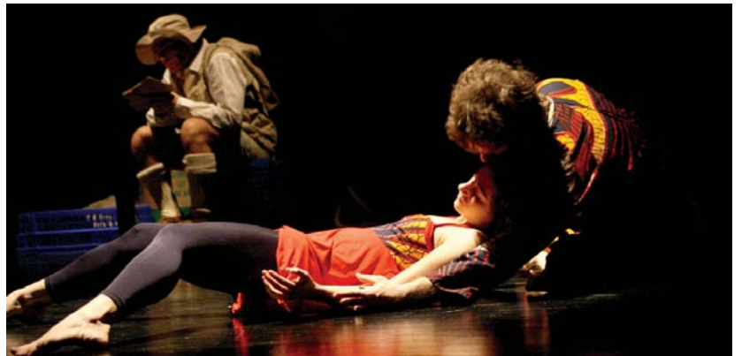
Bere egunerokoa bidali du etxera, ez da ondo sentitzen, gaixotu egin da Afrikan eta botikak lortzea ez da erraza...