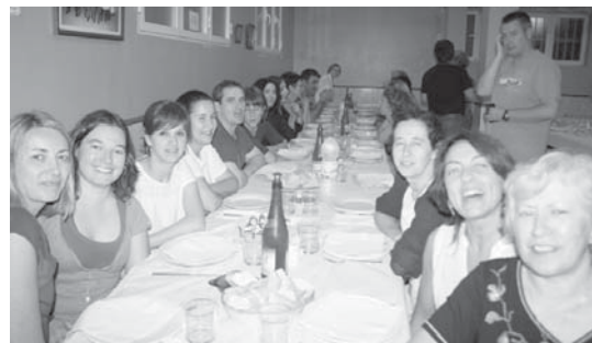
Giro ederrean Solaskideko euskaldun berri eta zaharrak afariak egiten dituzte.

Afarirako txartelak 12 euro balio dituzte eta gaurtik aurrera eskuragarri egongo dira Ttakun elkartearen. Tiketa eskuratzeko azken eguna osteguna, azaroaren 18a izango da. •