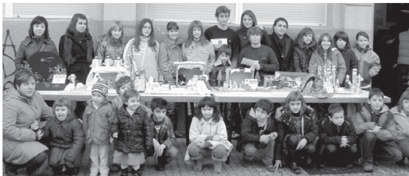
Danok Kide XVIII. jaiotzen lehiaketako saribanaketa Errege egunean egiten bazen ere, aurtun 2011eko urtarrilaren 2an egingo da.

Era berean, Kirol Zerbitzuek gogoratzen dute abonua familiarren barnean egon diren 25 urte arteko gazte baimenduak adin hori igarotzerakoan ezin direla abonua familiar horretako onuradun izan. Horren ondorioz, abonua indibiduala egin behar dute kirol instalazioak eta zerbitzuak erabiltzeko. •