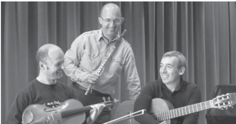
Oria Hirukoteak kontzertu ederra eskainiko du hilaren 19an, ostiralean Brigitarren komentuan