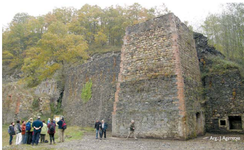
Leitzaran bailaran dauden iragan industrialeko aztarnak, hala nola, meatzak eta hauen labeak, ikusi zituzten Oinatzeko lagunek.

"Harrigarria da hori Leitzaranen egotea. Hain gertu bizi gara eta hain gutxi ezagutzen ditugu gure inguruak," adierazi digu bisitarietako batek. •