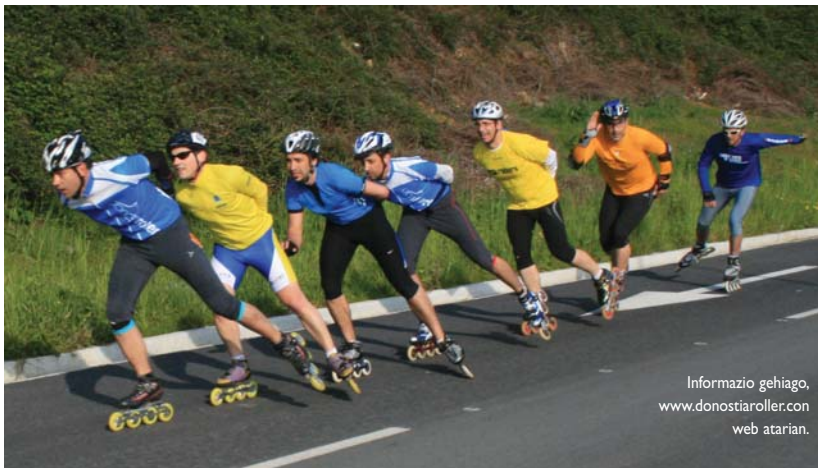
Informazio gehiago, www.donostiroller.com web atarian.

Esperientzia berria izan da niretzako Le Mans-eko 24 orduetan parte hartzea. Nire-