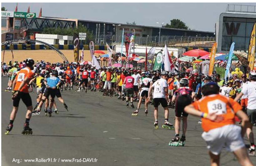
Arg.: www.Roller91.fr / www.Frad-DAVI.fr

kin batera beste lasarteoriatar bat egon zen.