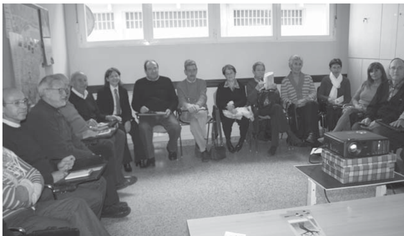
Jende ugari hilaren 9an Danak Kideko lokalean bildu zena formazio iraunkorreko ikastaroetan parte hartzeko

Gainera, kurtsoa osatzen duten oso bestelako ikasgaietan sakontzeaz gain eta Giza ikasketen barruan markoztatzen da, beti ere kontuan hartuz osasuna eta erlazio sozialak hobetzera bideratzen dauden beste ikastaroak.