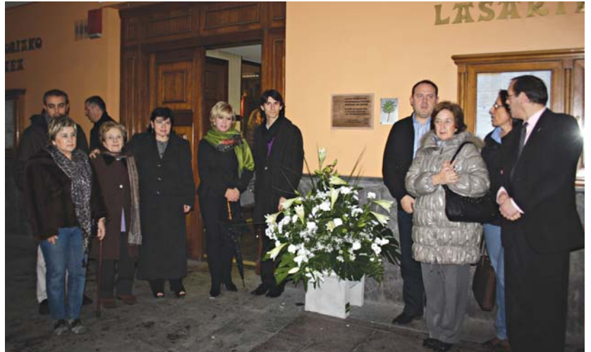
50 pertsona inguru bildu ziren Lasarte-Oriako Udaletxeko aterpean terrorismoak sortarazitako biktimak oroitzeko

Lasarte-Oriako Udaletxean burutu zen ekitaldian indarkeriaren biktimen senideek ere