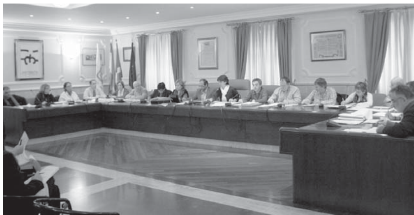
Ordenantzen aldaketen puntuan hogei bat emendakin eztabaidatu zituen Batzarrak eta horiek guztiak atzera bota ziren.